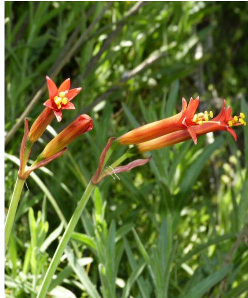
Región Metropolitana, Caleu