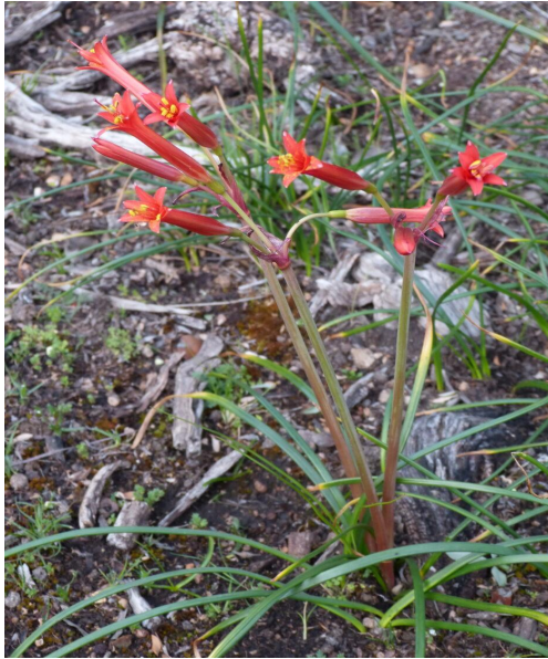
RM: Altos de Chicauma de Lampa