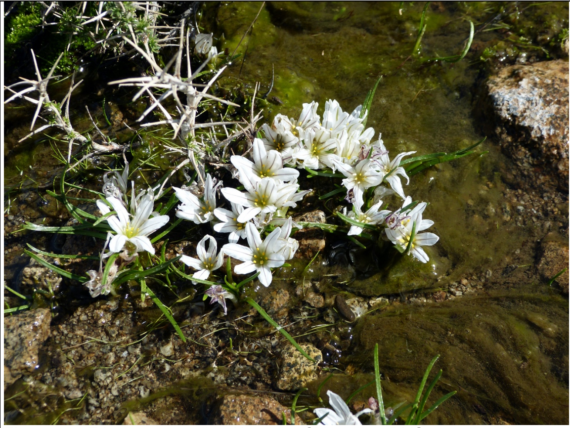
Figura 5. Tristagma sessile , Altos de Chicauma, RMS, octubre de 2018.