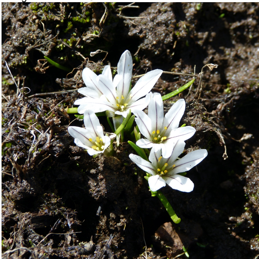
Figura 4. Tristagma sessile , Altos de Chicauma, RMS, octubre de 2018.