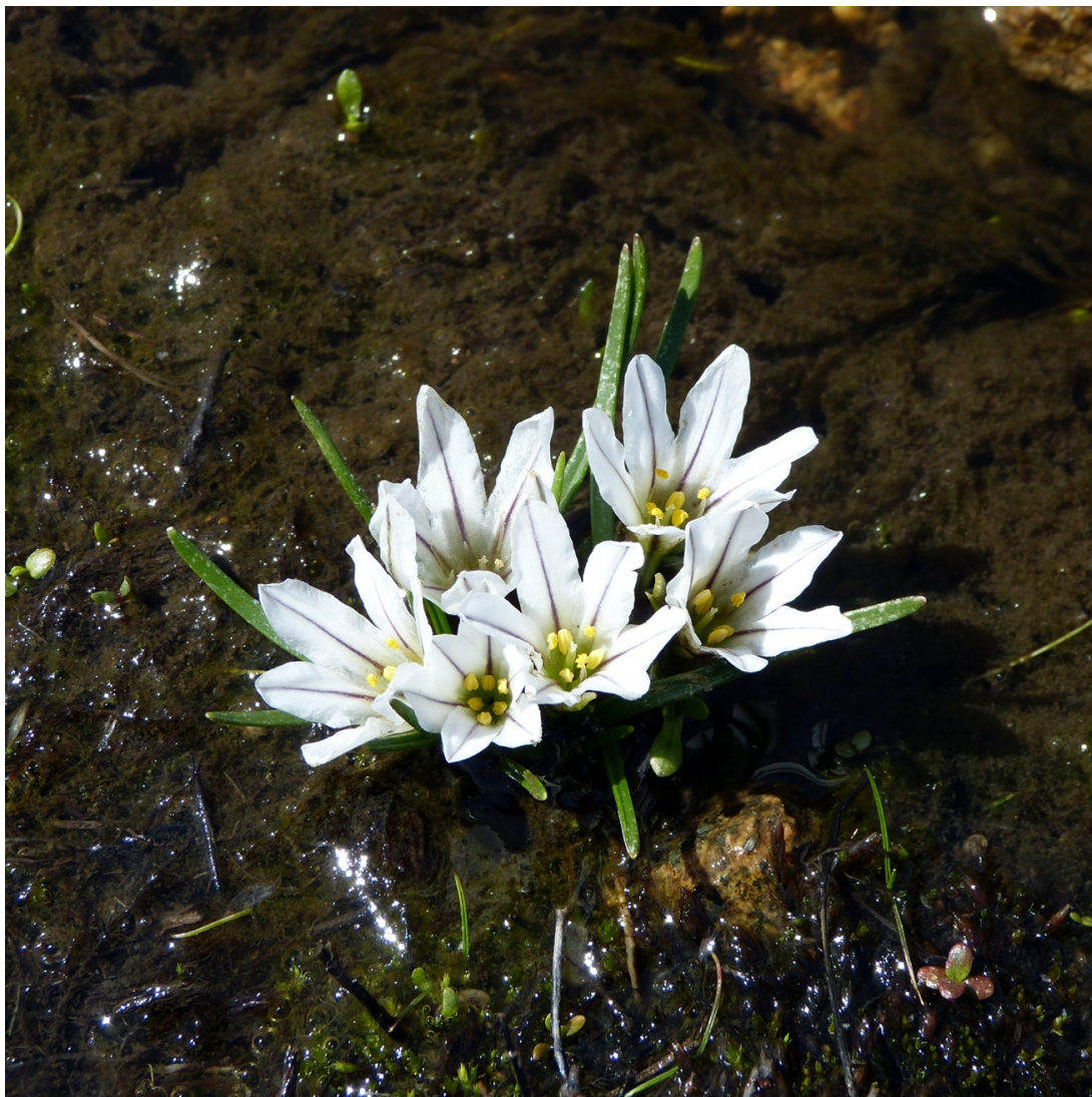
Figura 3. Tristagma sessile , Altos de Chicauma, RMS, octubre de 2018.