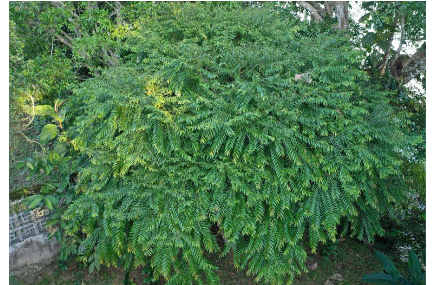
Reserva Natural de la Sociedad Civil. Hacienda Esmeraldas, Municipio de Puerto Milán. Caquetá, Colombia.

fecha. Es una madera muy fina para construcción de establos en lugares secos, para listones, barillo-nes, tablas para piso y paredes. Su reproducción es rápida en potrero, no es de sombrío. Su semilla es alimento para las aves y se esparce fácilmente. Se obtiene sin dificultad y su germinación es propicia en secaderos de café. Las camas de arena son ideales húmedas hasta llevar la plántula a 30 cm de altura y buscar su trasplante a potrero para establecer som-bríos para el ganado, y si es en escala sirve para con-formar corredores biológicos. Se siembra entre 6 y 10 mts de distancia, permitiendo otras especies a los callejones del arreglo silvopastoril.