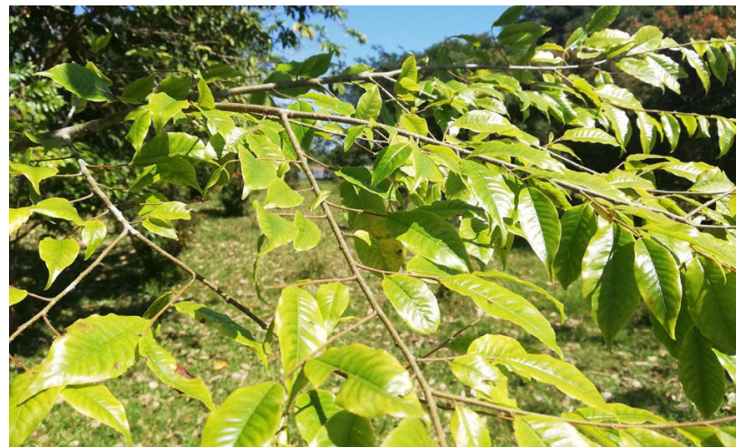
Reserva Natural de la Sociedad Civil. Hacienda Esmeraldas, Municipio de Puerto Milán. Caquetá, Colombia.

oscuro, bastante fisurada, la cual se desprende en tiras largas y es usada como amarres; corteza interna de color blanco cremoso y apariencia fibrosa. Hojas simples, alternas con borde aserrado, dísticas y sin estipulas. Flores grandes y dispuestas en panículas terminales, de cáliz llamativo de color blanco-amarillento. Fruto en pixidio leñoso, piriforme y deshiscente por un opérculo apical que contiene numerosas semillas aladas.