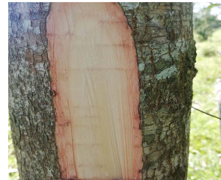
Reserva Natural de la Sociedad Civil. Hacienda Esmeraldas, Municipio de Puerto Milán. Caquetá, Colombia.

claros. En las colinas del Chocó, el abarco crece generalmente aislado, aunque en zonas bajas con periodos cortos de inundación forma pequeñas masas homogéneas; en el medio Atrato se encontraron 12 árboles de gran porte en 4 hectáreas. La especie ha sido catalogada en peligro crítico, de acuerdo a las categorías de las listas rojas de la UICN por lo que se requieren acciones inmediatas de propagación.