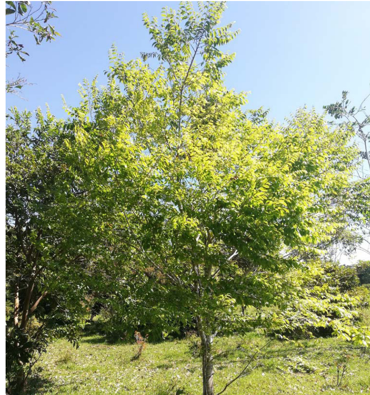
Reserva Natural de la Sociedad Civil. Hacienda Esmeraldas, Municipio de Puerto Milán. Caquetá, Colombia.

Árbol maderable y su altura llega a los 40 mt. Sin embargo es comercial a los 20 mts de altura. Uso medicinal no conocido por el resguardo hasta la