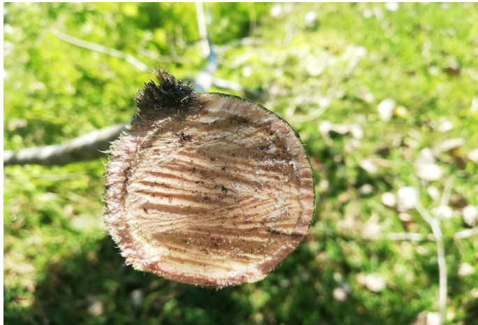
Reserva Natural de la Sociedad Civil. Hacienda Esmeraldas, Municipio de Puerto Milán. Caquetá, Colombia.

de Florencia, Parcela # 7 y Parcela # 8 de la vereda Florencia en el municipio de Florencia, Zaragoza – Mesitas de la vereda Morros en el municipio Montañita, El Recreo – Buenavista de la vereda Morros en el municipio de Montañita, La Samaria - Miranda de la vereda Morros en el municipio de Montañita.