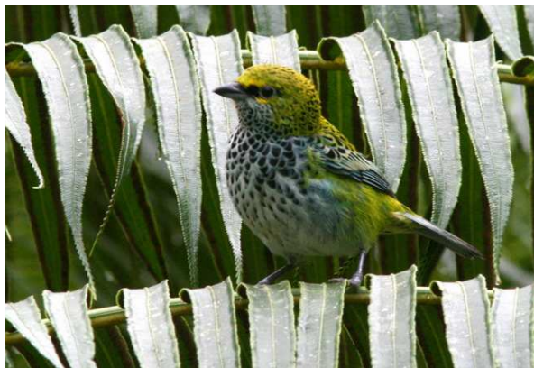
Speckled Tanager, Wilson Botanical Garden.