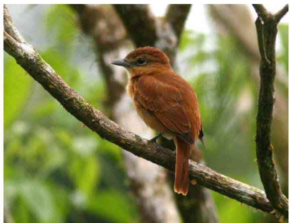
Black-striped Sparrow och Cinnamon Becard, La Selva.