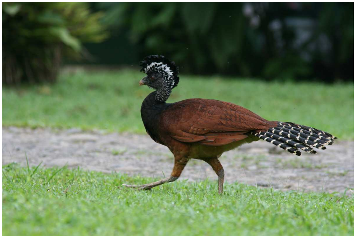
Hona av Great Curassow, La Selva.