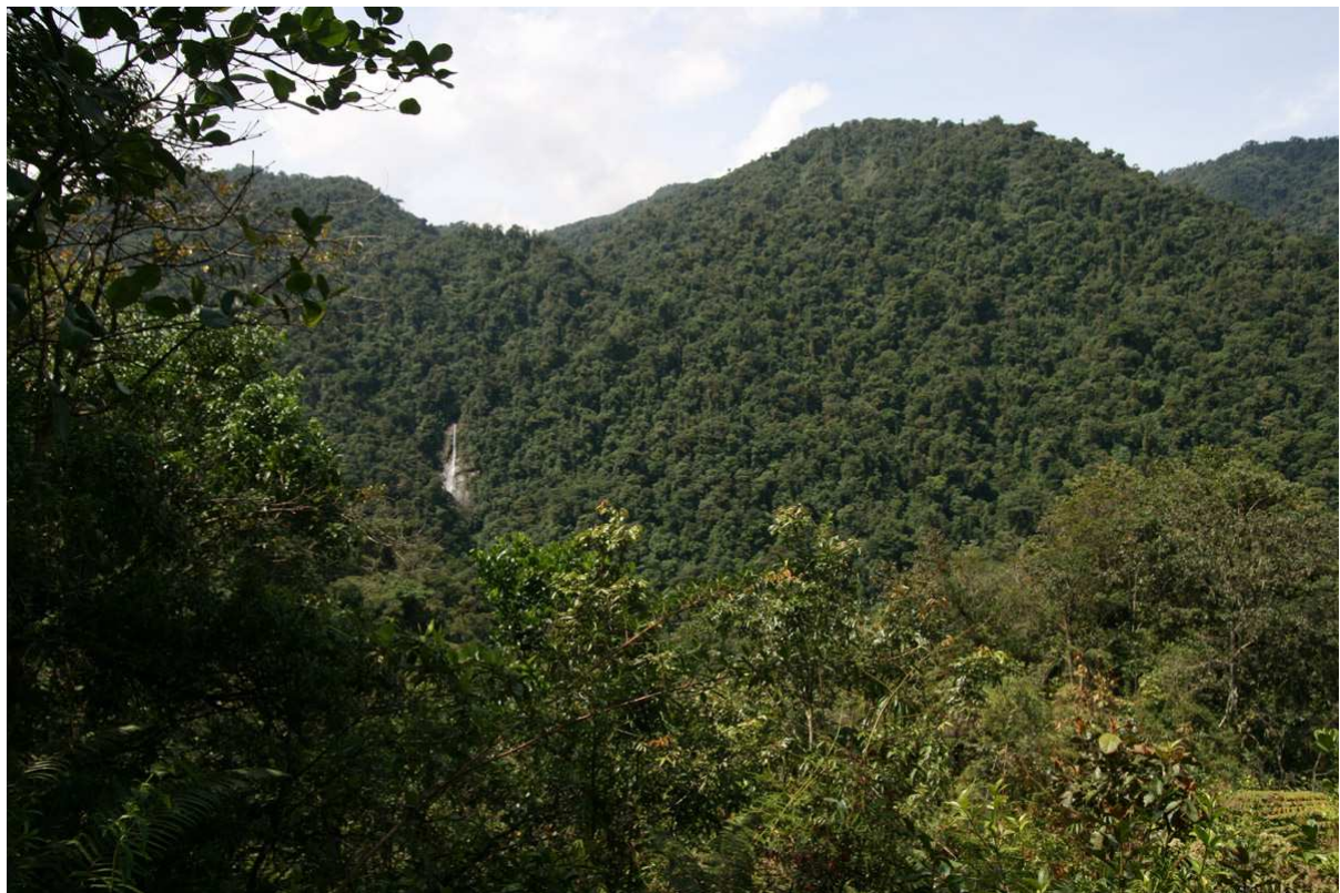
Vy från utsiktspunkten i Tapantí NP.