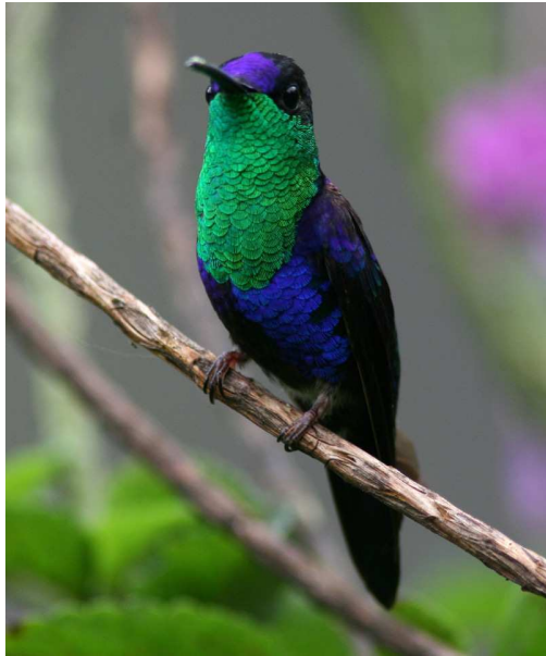
Purple-crowned Woodnymph, Braulio.