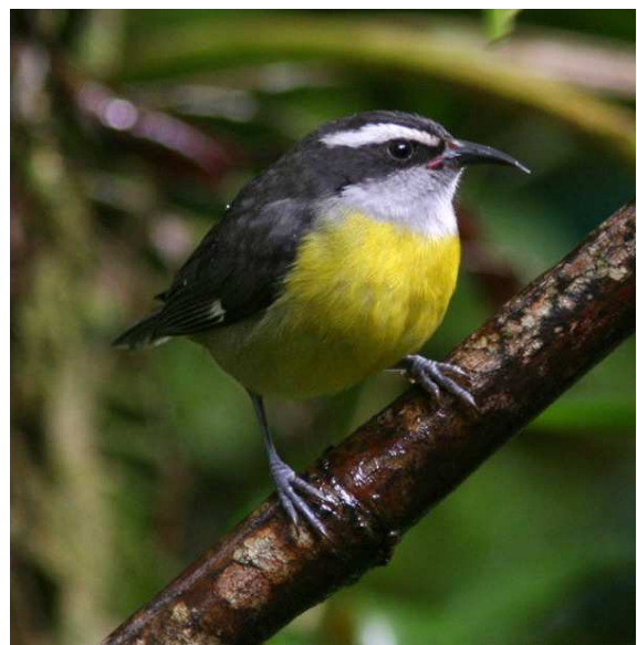
Variable Mountain-gem och Bananaquit.