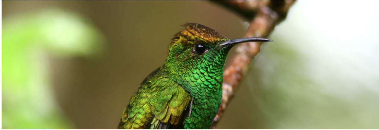
Coppery-headed Emerald, Monteverde. Nästan endemisk för Costa Rica.