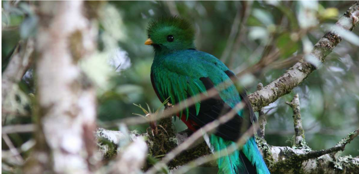
Centralamerikas mest eftertraktade fågel – Resplendent Quetzal.

Elaenia. ”Ska den finnas här?” Kommentaren framröstades snabbt till resans hittills bästa ”Fjällbo” (efter ett för reseledaren okänt ålderdomshem i Göteborg)! Vi hann slappa lite i våra mysiga små stugor innan det var dags för en god middag. En varmvattenflaska till sängen tackade vi inte nej till, och snart somnade vi till sången av flera Dusky Nightjars.