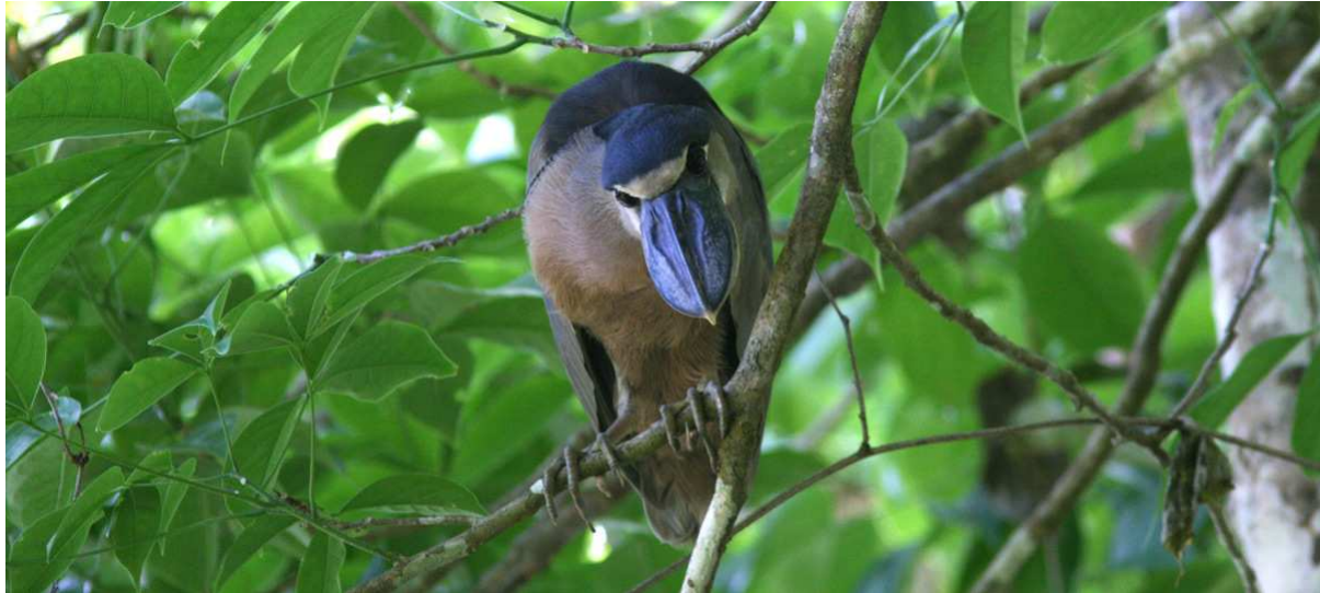
Boat-billed Heron vid Carara. Alltid en härlig syn!