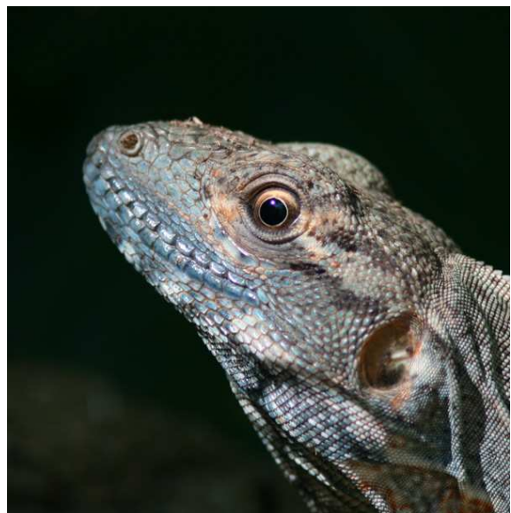
Brown-hooded Parrot och Ödla Grande, Carara.