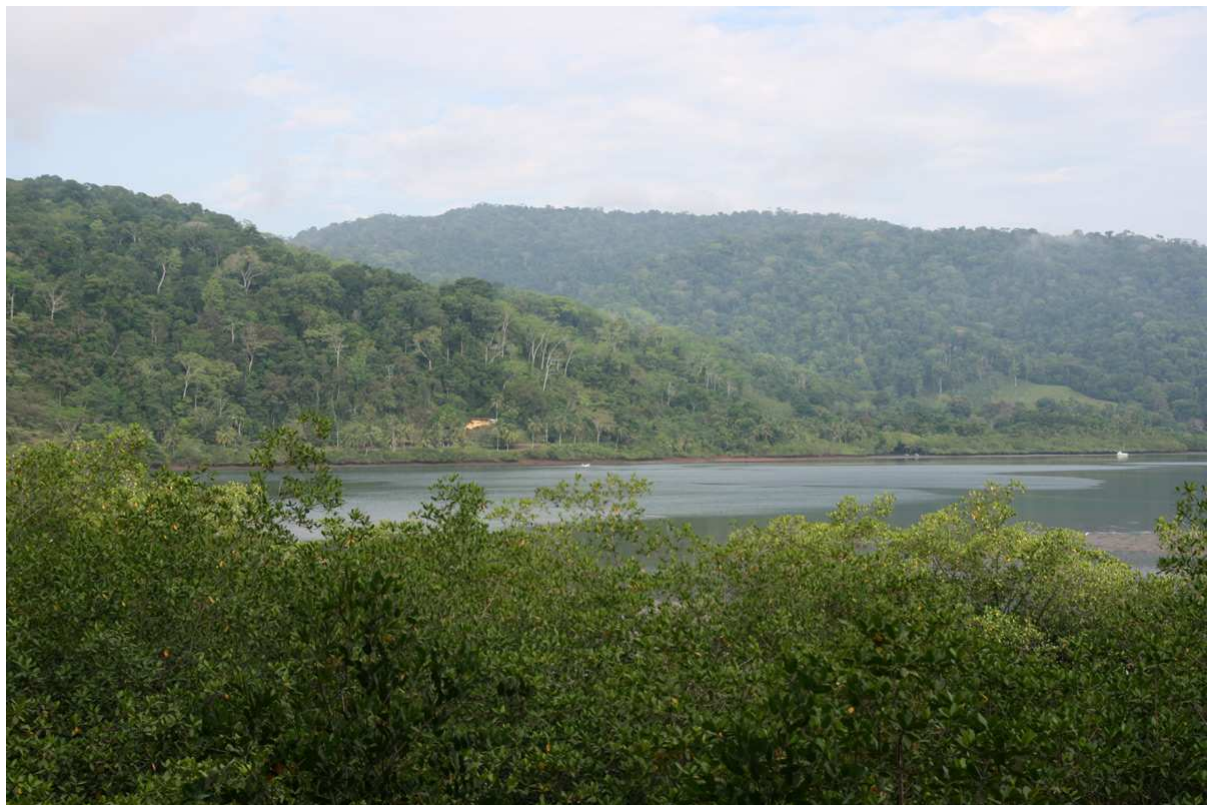
Golfo Dulce vid Rincón de Osa.