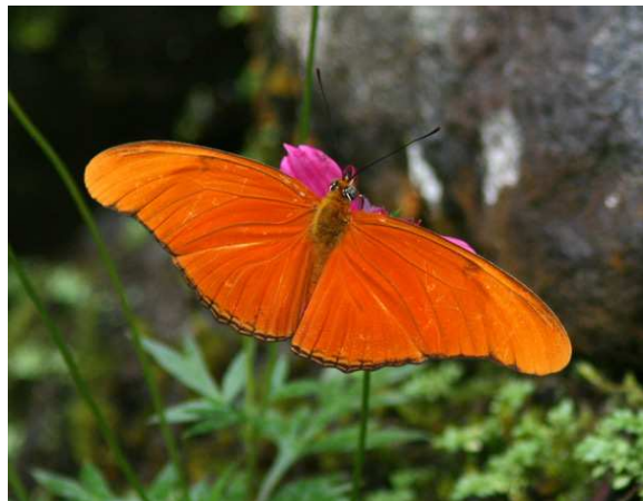
Julia Heliconian, Braulio Carrillo.