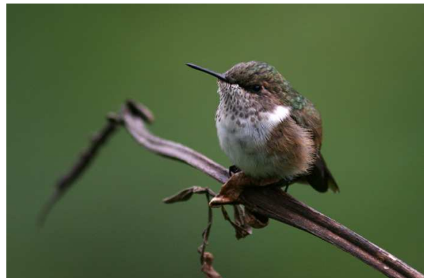
Slaty Flowerpiercer och Volcano Hummingbird.