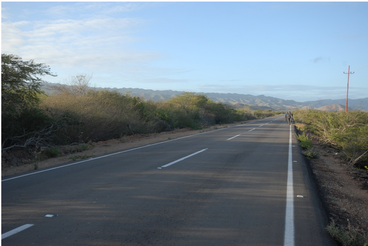
Biotop för Vermilion Cardinal på Pariahalvön.

Åter en tidig start kvart i fyra på morgonen, vilket åtminstone kompenseras av en hörd Tropical Screech-Owl, och avfärd mot den västra delen av Pariahalvön, en lång transport på två och en halv timme. Här i biotopen halvöken bevuxen med kaktusar och torra buskar var mållarten framför allt Vermilion Cardinal, en art jag själv missade på Guajira-halvön i östra Colombia något år innan. Kardinalen är sällsynt på fastlandet men tydligen mycket vanlig på ön Margarita som vi kunde skimta i diset långt ute på havet. Vi skådade längs med bilvägen när vi kommit in i rätt biotop och hoppades att få se en lysande röd fågel sitta i toppen på någon av kaktusarna.