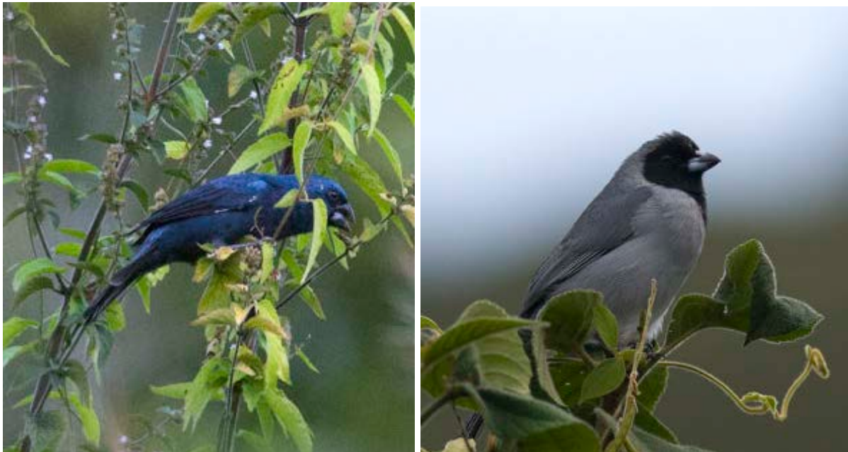
Ultramarine Grosbeak och Black-faced Tanager.

Sedan påbörjade vi transporten mot staden Maracay och skådade längs vägen som gick nedför bergen. Bland annat fick vi in Zone-tailed Hawk, Green-tailed Emerald, Black-faced Tanager, Orange-billed Nightingale-Thrush, Fawn-breasted Tanager, Bran-colored Flycatcher, Lesser Goldfinch, Yellow-bellied Seedeater, Dull-colored Grassquit och Ultramarine Grosbeak.