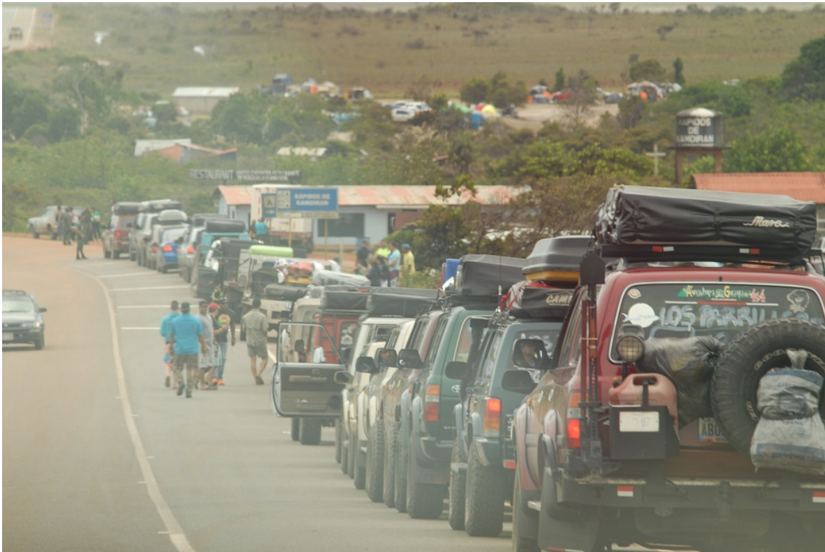
En liten del av kön till bensinmacken.