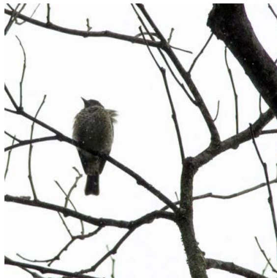
Velvet-browed Brilliant och Sharpbill, två bra arter från La Escalera.

På eftermiddagen avtog fågelaktiviteten betydligt och ersattes av en ökande ström extrautrustade SUVs som i karavaner rörde sig upp mot Gran Sabana under ett ivrigt tutande och mer eller mindre galna omkörningar av varandra. Tydligt är det rika venezuelaners nyårsnöje att med en oerhört extrautrustad, höjd, pimpad och allmänt vräkig terrängjeep, åka ner till Gran Sabana på något slags äventyrligt safari. Ute i "vildmarken" campar de alldeles intill vägen, ordnar grillfester, spelar hög musik och kör runt bilarna i ett lerhål så de blir lagom och coolt smutsiga.