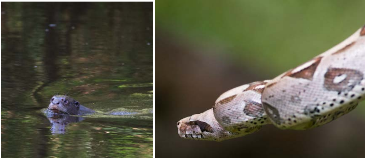
Giant Otter i badet och Boa Constrictor i trädet.

Sedan åkte vi ner till floden igen och där simmade en nyfiken Giant Otter runt. Vi hade också Plumbeous Kite vid bron, samt Black Caracara längs vägen hem.