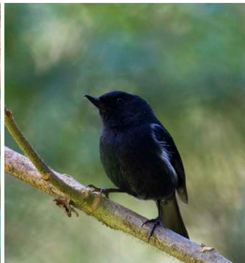
Black-throated Spinetail och White-sided Flowerpiercer , några av godbitarna i Coastal Cordillera.