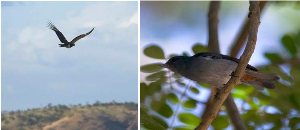
Horny Screamer och Chestnut-vented Conebill.

Horse Forest hette ett område som har en tät förekomst av jaguar och vi åkte dit med den gamla lastbilen. Givetvis var området svårskådat med mycket täta buskage, men vi fick dock fina obsar på Sunbittern, Iguaner, Crane Hawk, Horned Screamer, Gray-fronted Dove, Green Kingfisher, Streaked Flycatcher, Lance-tailed Manakin, Hooded Tanager, Yellow-hooded Blackbird mm.