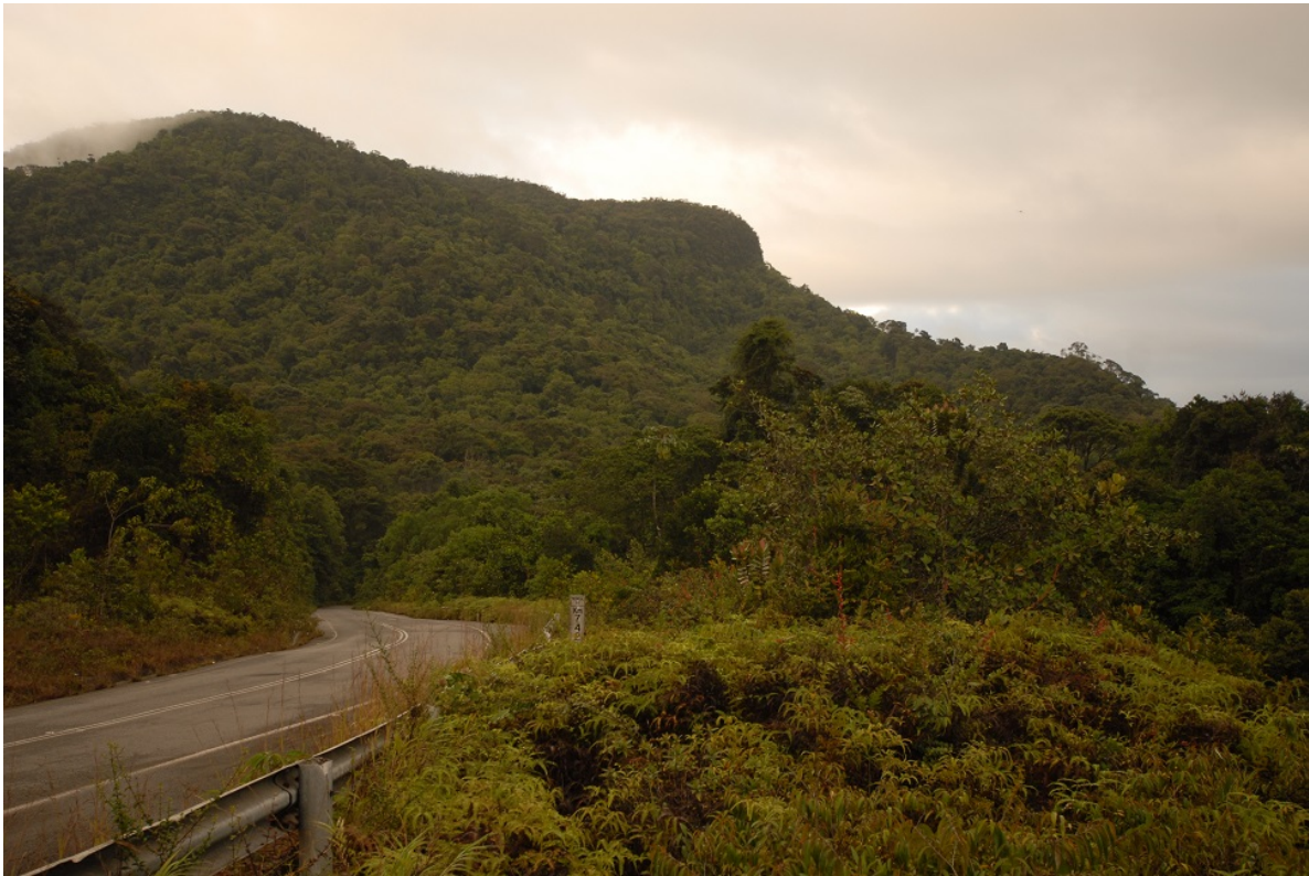
La Escalera, legendarisk skådarterräng.

Uppe vid skitstigen hade vi riktigt bra flyt med arterna, bl.a. Red-banded Fruiteater, Black-throated Antbird, McConnell's Flycatcher, Rose-collared Piha, Orange-bellied Manakin (fd Tepui) (hane), Black-hooded Thrush, Blue-fronted Lancebill, Black-headed Tanager, Tepui Brushfinch. Dessutom hörde vi Tepui Antpitta vissla intill.