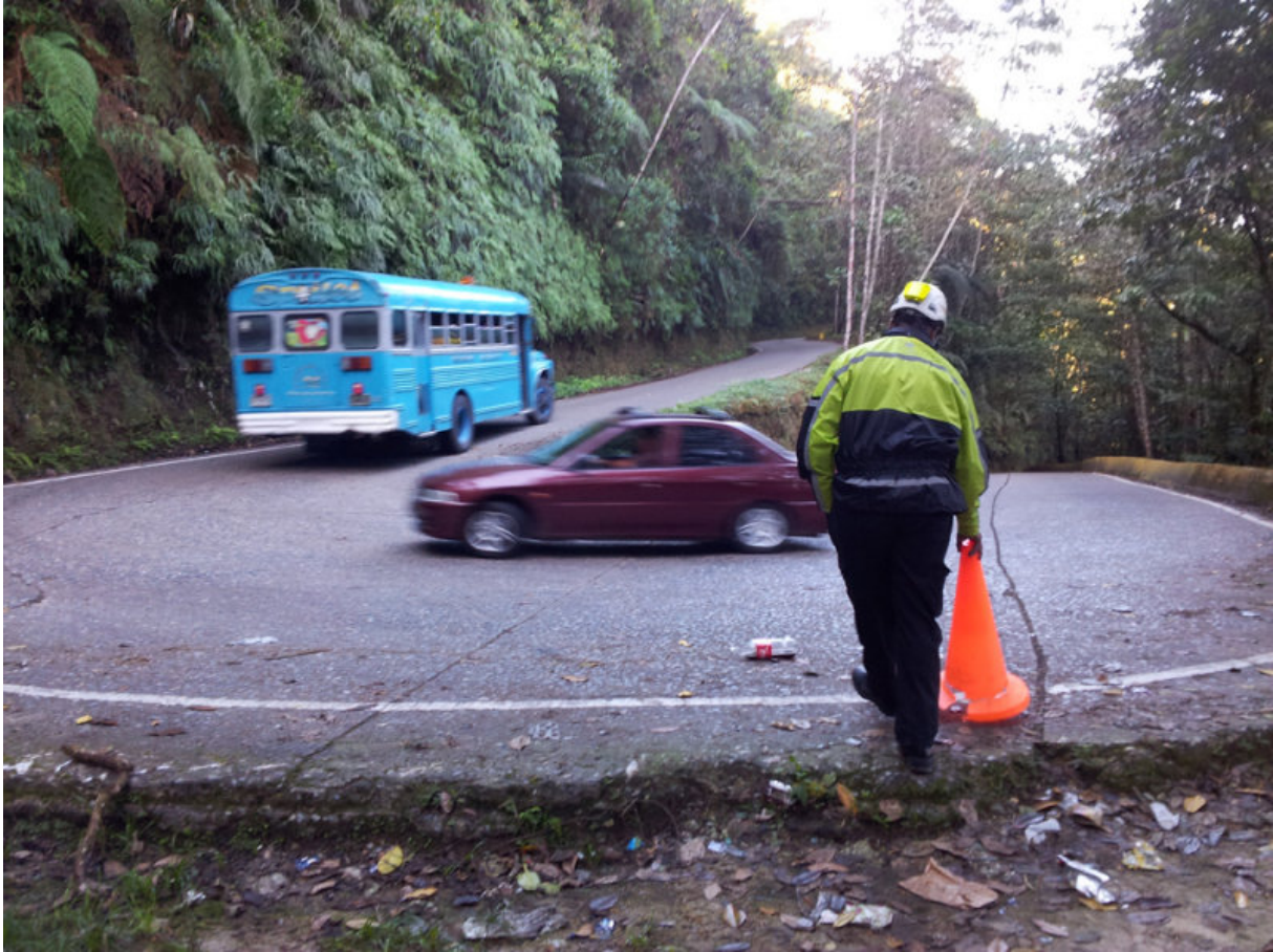
Trafiksäkerhetsmannen med varningskonen på de slingriga vägarna över Coastal Cordillera.