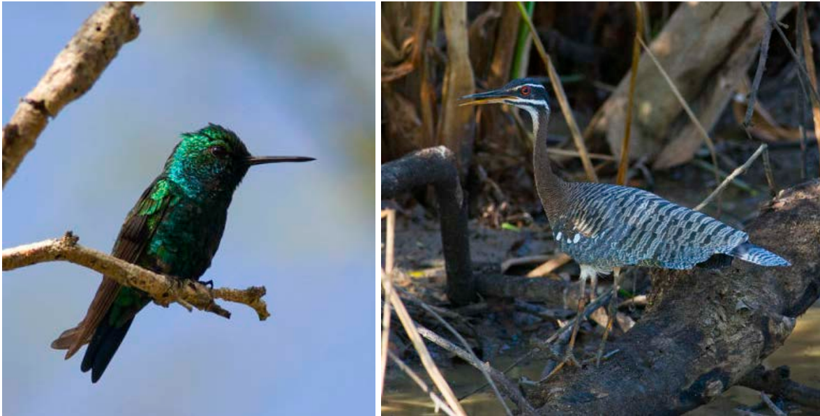
Blue-tailed Emerald och Sunbittern.

Därefter gick vi tillbaka till lastbilen och åt lite snacks innan vi tog en tur in på andra sidan av ån, där jaguaren varit. Jag gick före och försökte mest spana efter jaguaren som givetvis inte syntes till, men det var spännande att smyga runt i jaguarskogen! Vi såg istället bland annat Gray-headed Tanager innan vi åkte tillbaka med lastbilen för lunch och siesta på lodgen.