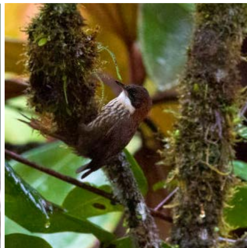
Tepui Brushfinch och Roraiman Barbtail ingick i någon av flockarna i Escaleran.