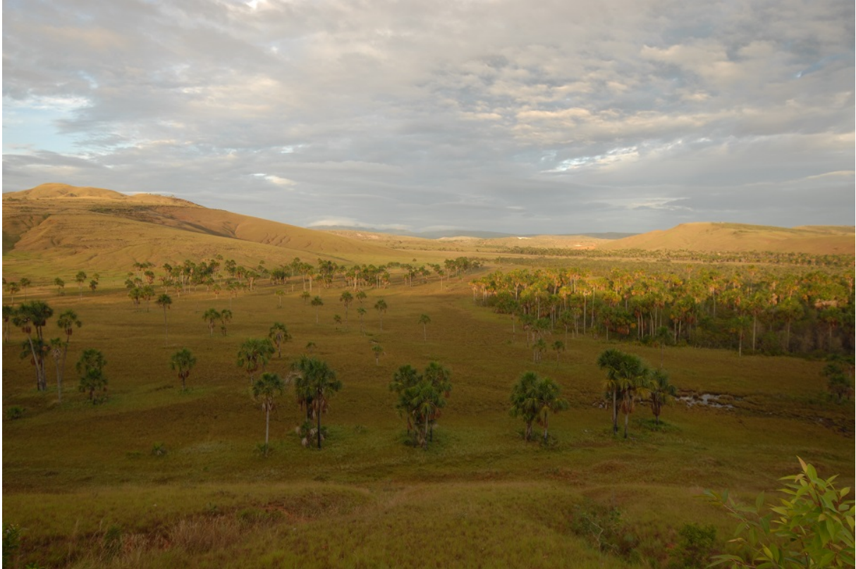
Området med Morichepalmer som drog till sig aror.

Vi åkte vidare längre ut på Gran Sabana och stannade för att leta Tepui Goldentthroat där vi såg att det fanns en viss sorts lila (?) blommor. Omgående såg vi flera arter kolibrier, och efter en stund hade vi säkrat bra obsar av en Tepui Goldentthroat, och dessutom stött en South American Snipe.