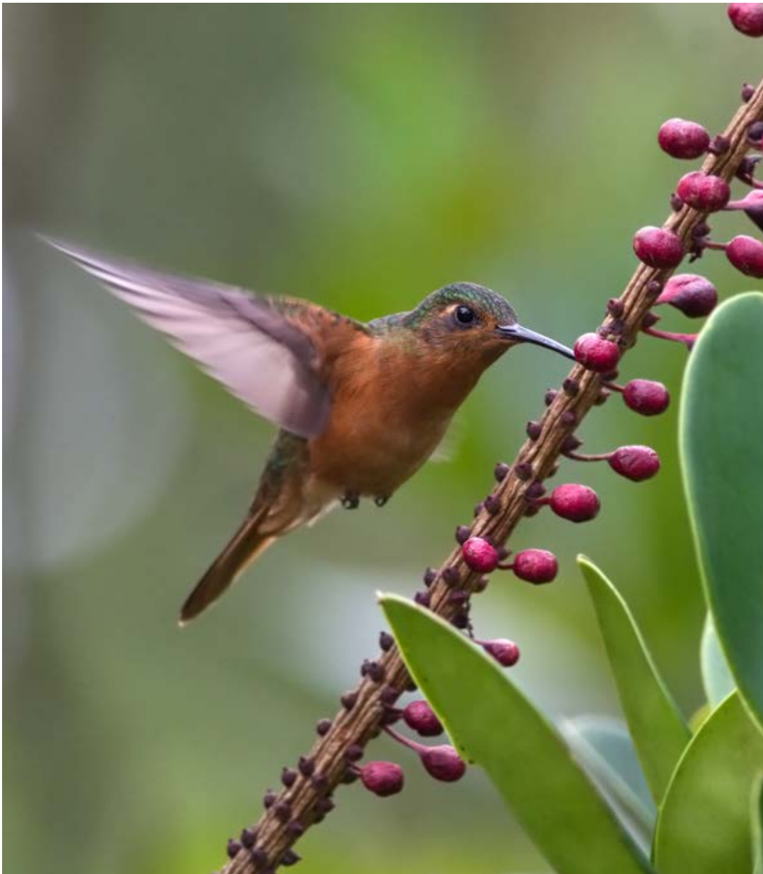
Rufous-breasted Sabrewing, La Escalera.

Vi såg 654 fågelarter i landet varav 17 anses vara endemiska (i summan ingår inte Chapman's Bristle-Tyrant eftersom den observationen gjordes på en helt annan höjd än var arten skall finnas och vi känner oss därför lite tveksamma).