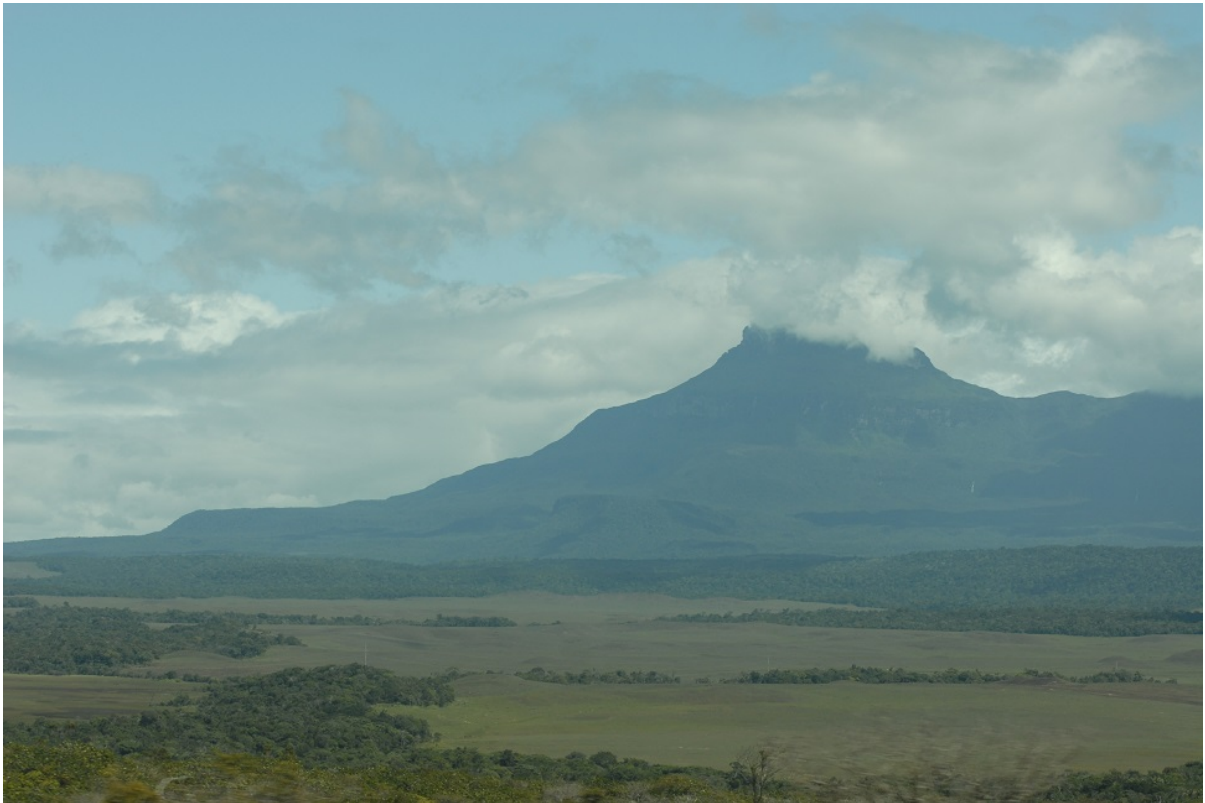
Utsikt över Gran Sabana mot Tepuierna och Guyana.