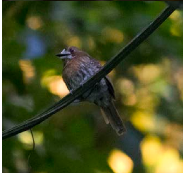
Rufous-cheeked Tanager, Gray-throated Leaf-tosser, Handsome Fruiteater och Moustached Puffbird, några av de svår fotade fåglarna i skogen.

Vi fortsatte att gå längs vägen men biltrafiken ökade tyvärr snabbt när det blev morgon. Förutom via vägarna som korsar nationalparken är parken svårtillgänglig, och mycket av skådningen sker från vägar som under helgtid är mycket trafikerade. Alla, ja faktiskt alla, passerande bilar och bussar tutade flera gånger när de såg oss och de som satt i bilarna hängde ut genom rutorna och skrek så skådningen blev minst sagt sämre. Det fanns några stigar in i skogen bakom en forskningsstation,