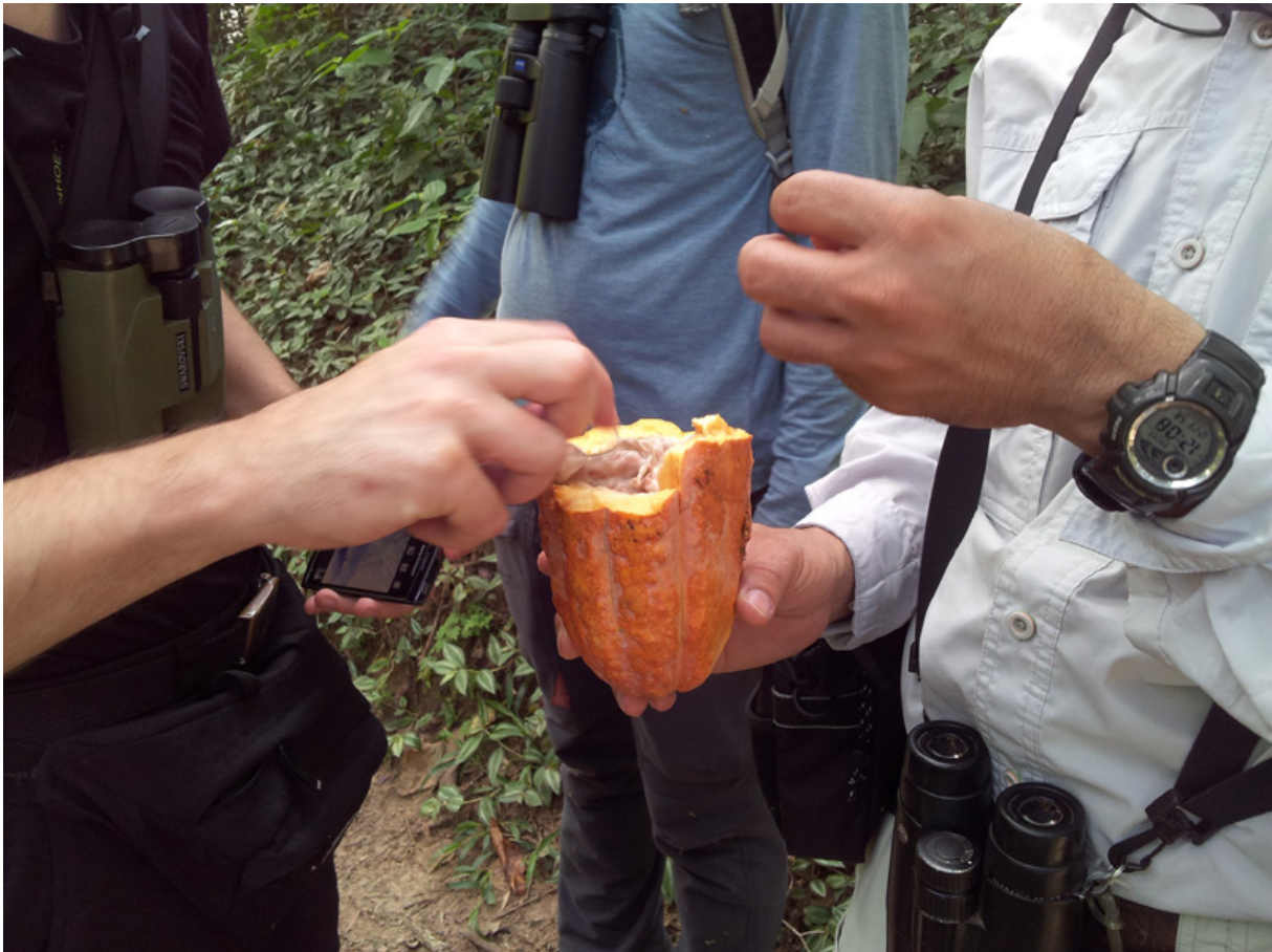
Världens bästa kakao!

Närmare havet skådade vi längs en grusväg i utkanten av Choroni i ett skräpigt område som såg ut som en övergiven kyrkogård. Värmen hade nu blivit olidlig, och minst lika olidlig var också stanken från en död och uppsvälld hund som låg intill. Nåja, bara att bita ihop och hänga in de arter som var nödvändiga, och vi hade här bl.a. Pale-eyed Pygmy-Tyrant, Tawny-crowned Pygmy-Tyrant, Trinidad Euphonia, Fulvous-headed Tanager, Black-faced Grassquit, Whiskered Wren, Sooty-capped Hermit, Blue-tailed Emerald och Buffy Hummingbird.