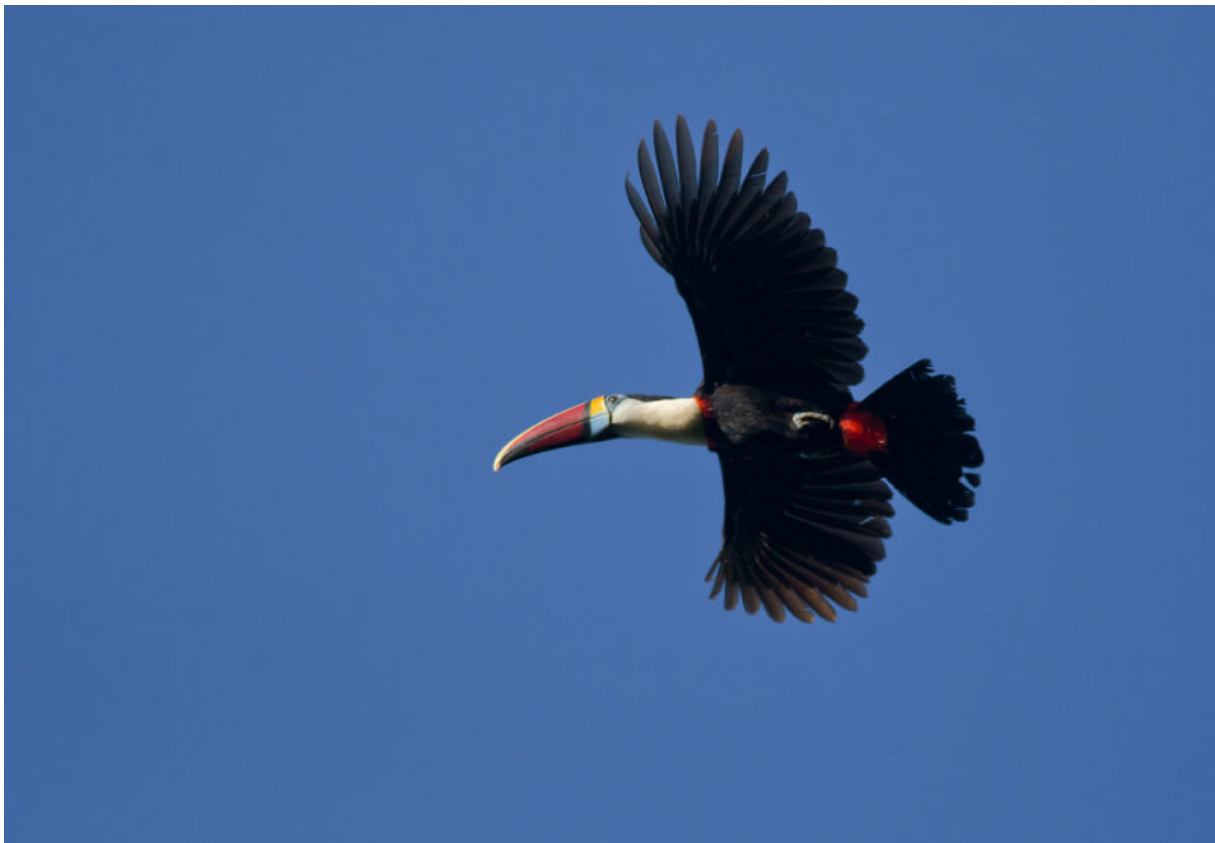
White-throated Toucan, Rio Grande.