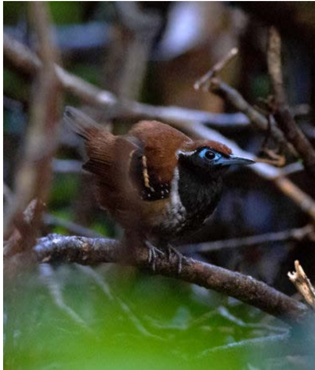
Black Nunbird och Ferruginous-backed Antbird i Imataca.