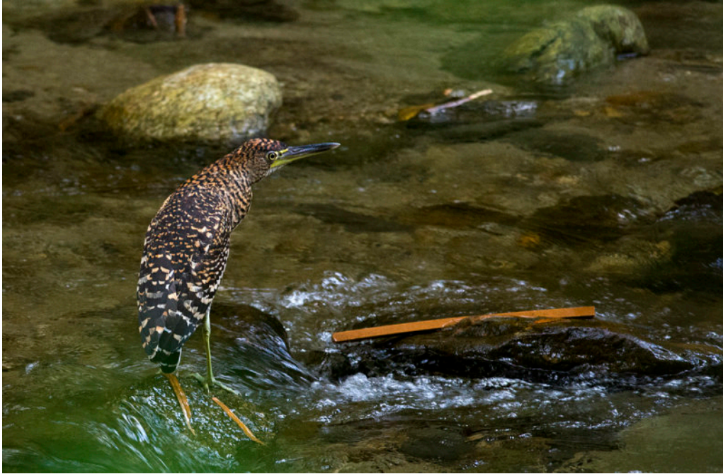
Fasciated Tiger-Heron som gungade ikapp med musiken från strandpartyt intill.

Tillbaka i Maracay och rusningstrafiken slängde vi in grejorna på hotellet och gav oss ut för att försöka hitta kvällsmat. Eftersom det var söndag var många ställen stängda, men till slut hittade vi en restaurang som var öppen men tyvärr mycket skrånig och med dålig service. Mat fick vi till slut i alla fall och det var skönt för vi var både mycket trötta och hungriga av den långa dagen. Utanför vårt hotell pågick ett party hela natten vilket var lite störande då hotellets fönster inte gick att stänga.