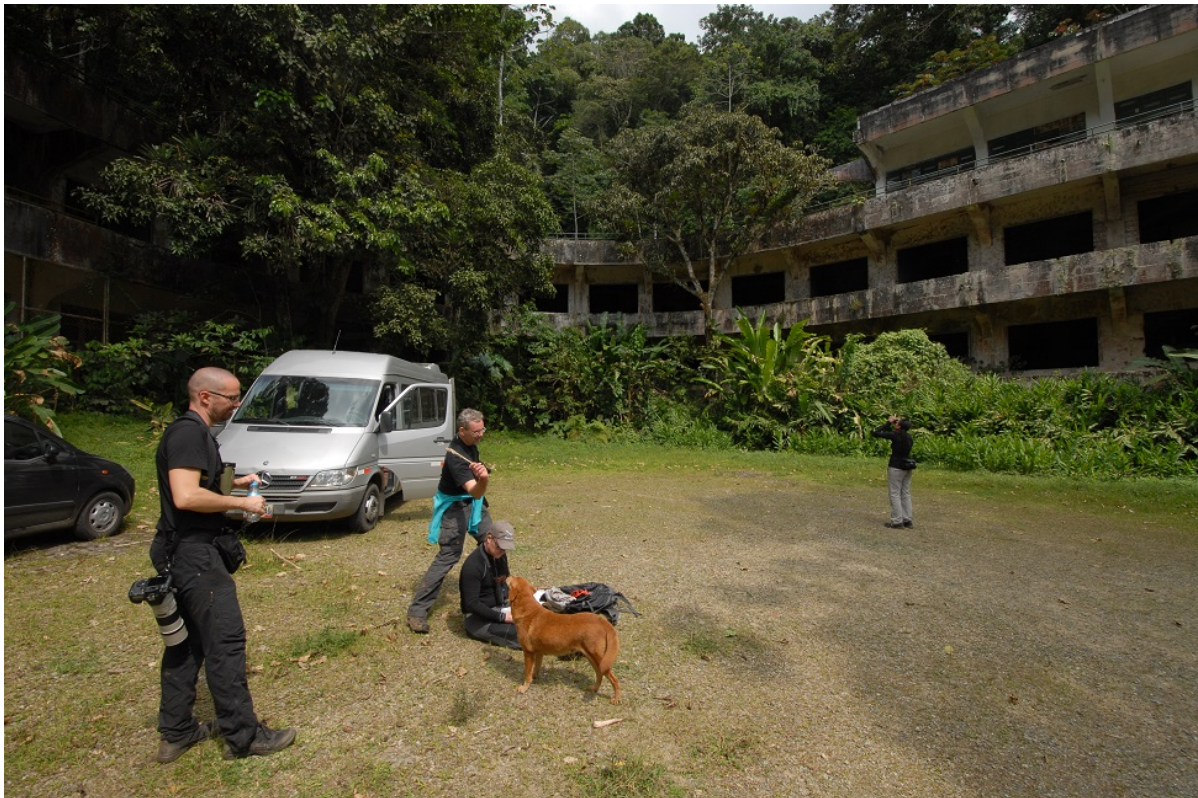
Lunch framför det spöklika gamla hotellet.

Forskningsstationen vi skådade kring var en spöklik byggnad som från början hade varit ett exklusivt hotell uppe i de svalkande kustbergen. Tiderna förändras och nu hade huset förfallit till stor del och var stället övertaget av djungeln, herrelösa hundar, fladdermöss och fåglar.