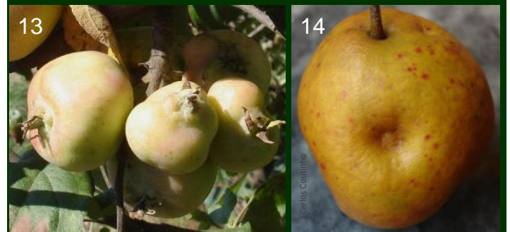
Frutos deformados por picadas de 13 afídeos e de 14 antocórídeos no cedo