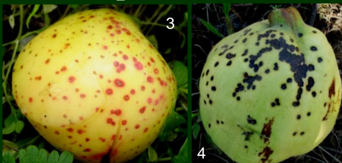
Pedrado lenticular em maçã 3 fruto destruído 4 Entomosporiose em marmelo (fruto desvalorizado)