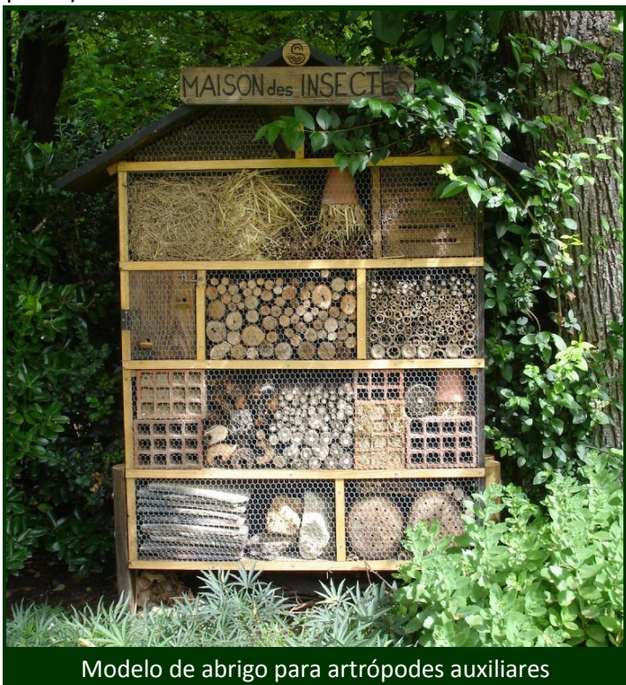
Modelo de abrigo para artrópodes auxiliares

Construa e instale abrigos para insetos e outros artrópodes úteis. São de fácil construção e podem ser realizados com materiais reaproveitados existentes na exploração agrícola (madeira, telhas, redes de galinheiro, tijolos de barro, cacos, lenha, palha).