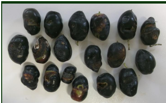
Azeitonas em tamanho natural, com sintomas de ataque de mosca-da-zeitona

descerem e aumentar a humidade relativa do ar e sobretudo quando houver queda de chuva (chuvas do Equinócio).