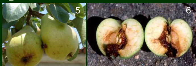
Bichado 5 e 6 frutos destruídos