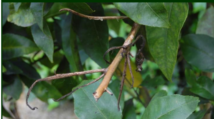
Rebentos destruídos pelo míldio