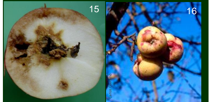
Mosca do Mediterrâneo 15 fruto destruído Cochonilha de S. José 16 fruto muito desvalorizado