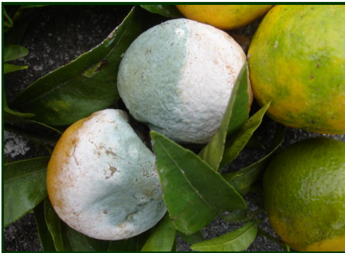
Tangerinas atacadas pelo míldio e de seguida invadidas por fungos do género Penicillium (branco-azulado)

• Recomendam-se tratamentos, antes ou pelo menos no início das chuvas do outono, com carácter preventivo , à base de cobre (calda bordalesa) ou de fosetil-alumínio , atingindo e molhando muito bem as pernas e o tronco das árvores até à zona do colo.