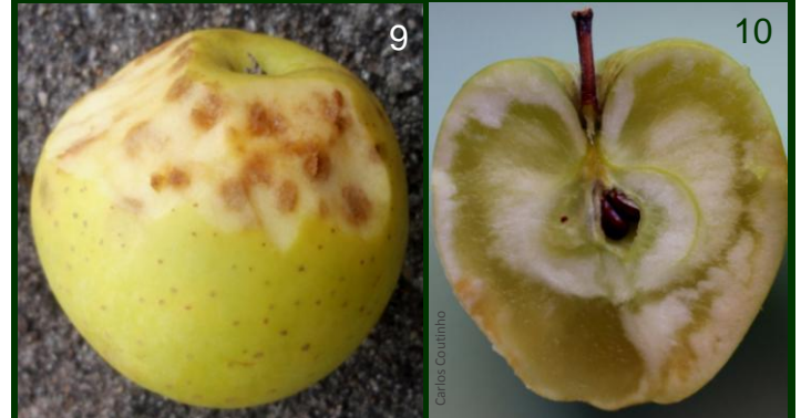
Deficiência de cálcio 9 Bitter pit 10 vidrado