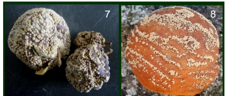
Moniliose 7 e 8 frutos destruídos