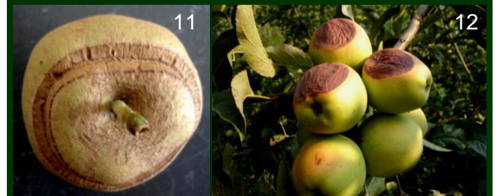
11 Efeito da geada na primavera 12 escaldão