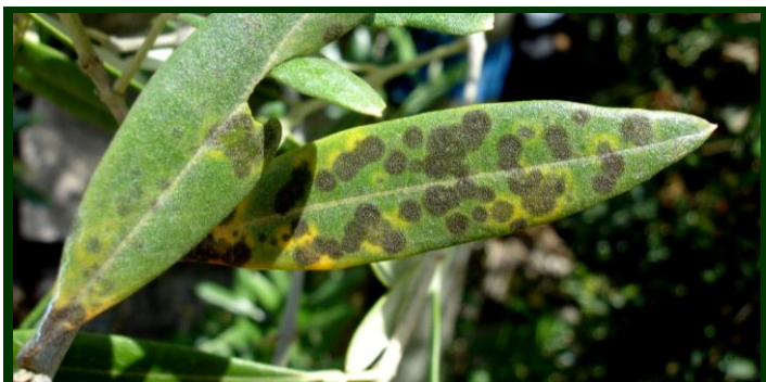
Manchas de olho-de-pavão nas folhas

O olho-de-pavão afeta a espécie cultivada ( Olea europaea e subespécie oleaster e a sua variedade sylvestris ou zambujeiro, utilizada como porta-enxerto da Olea europaea e por vezes como árvore decorativa.