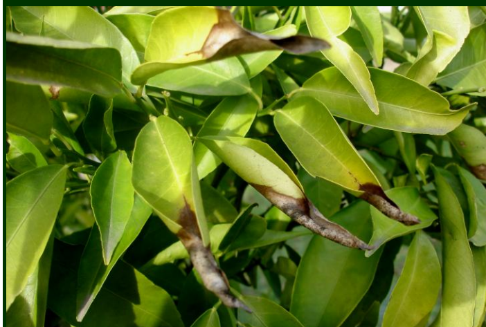
Sintomas de míldio nas folhas