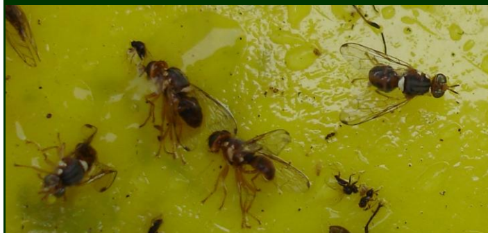
Adultos de mosca da azeitona capturados em armadilha cromotrópica (imagem muito ampliada)

Proceda à estimativa do risco desta praga → Observe 100 azeitonas (5 frutos/árvore X 20 árvores) → Tratar se for atingido o nível económico de ataque (8 a 12% de azeitonas com larvas) e respeitar com o maior rigor o intervalo de segurança do inseticida utilizado.