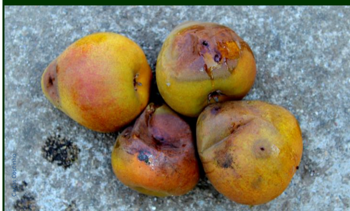
Peras destruídas pelas larvas de mosca do Mediterrâneo - aspeto exterior ↑ aspeto interior ↓