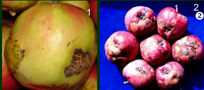
Manchas de pedrado 1 frutos desvalorizados 2 frutos destruídos