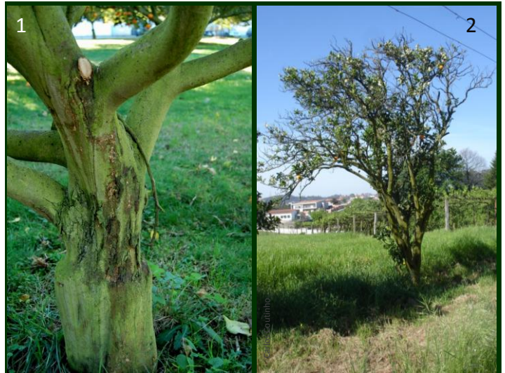
1 Lesões no tronco, acima da área de enxertia

• As árvores muito enfraquecidas devem ser arrancadas e queimadas. Se mais de metade da copa estiver ainda sã, podem ser adotadas algumas medidas paliativas para adiar a morte da árvore ↓