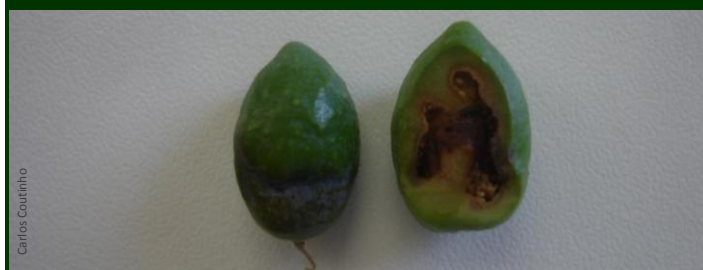
↖ Aspetto exterior ↗ azeitona cortada, mostrando a galeria da larva no interior, em volta do caroço