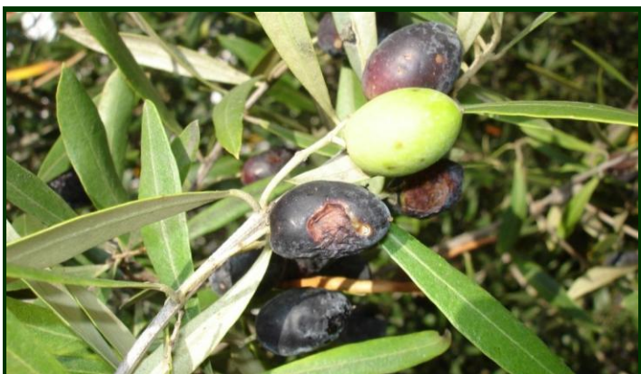
Sintomas de gafa em azeitonas

À aproximação de chuvas continuadas, recomenda-se a aplicação de um tratamento à base de cobre .