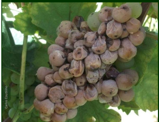
Podridão ácida (bagos castanhos, alguns deles já apodrecidos, com a polpa liquefeita e esvaziados)

A podridão ácida faz aumentar a acidez volátil dos mostos , contribuindo para a perda de qualidade dos vinhos . Pode des-