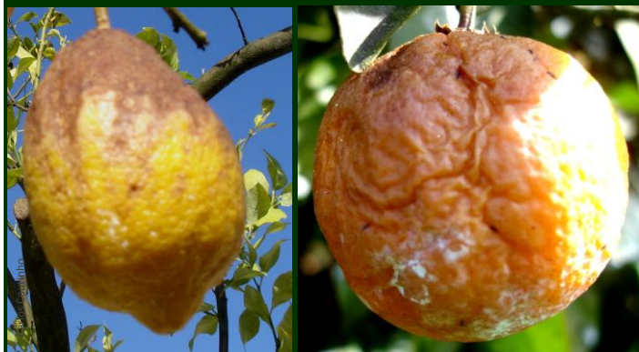
Sintomas de míldio em frutos