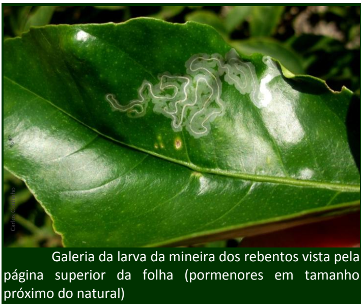
Galeria da larva da mineira dos rebentos vista pela página superior da folha (pormenores em tamanho próximo do natural)

O segundo período de rebentação mais importante dos citrinos, sobretudo de laranjeiras e tangerineiras, é o do final do verão (agosto-setembro). Algumas variedades têm uma rebentação tardia, que pode ir até fim de outubro. A partir desta rebentação surge a da primavera seguinte, que é a base da futura colheita. Um ataque grave de P. citrella à rebentação de fim de verão pode comprometer a produção.