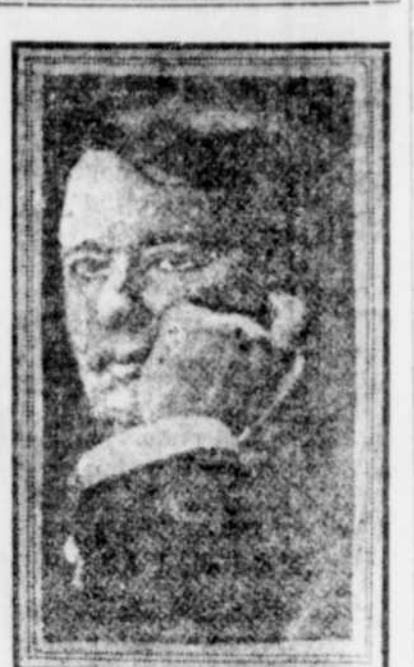
Le puissant journaliste et capitaliste anglais dont on attend la mort d'un moment à l'autre