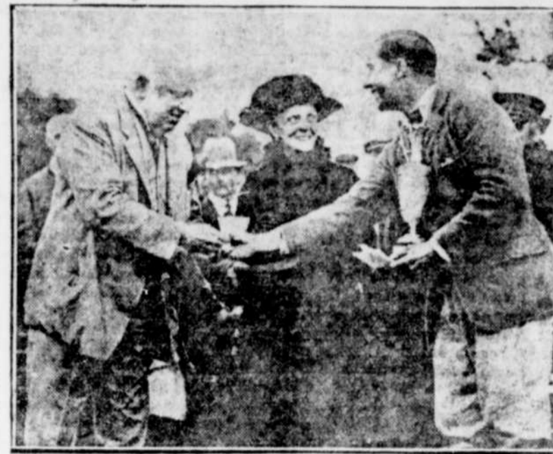
WALTER HAGEN, le joueur de golf américain, recevant de lord Northborne, le trophée-emblème du championnat anglais qu'il a gagné au récent tournoi de Sandwich.