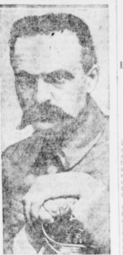
Le président de la Pologne, qui aidera le premier ministre Korfanty dans la formation d'un ministère nouveau.