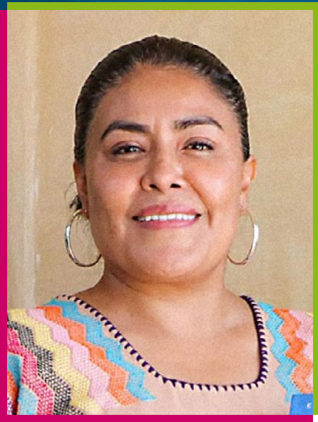
Dip. Eufrosina Cruz Mendoza

Háblame, ¡oh Musa!, de aquella niña zapoteca de Oaxaca, hija de la cultura del esfuerzo extraordinario, quien desde los doce años se rebeló y desafió la fatalidad de un destino que sigue encadenando a niñas al matrimonio infantil y a la explotación.