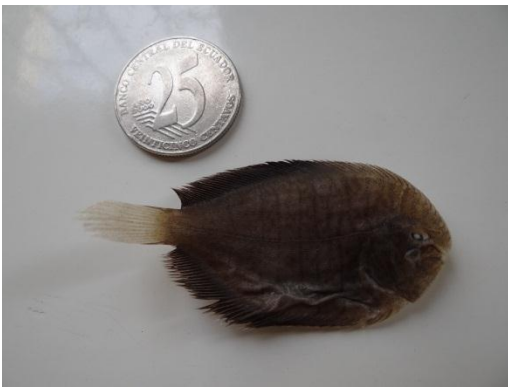
Figura 2. Especimen de Trinectes xanthurus (lenguado) capturado en el río Guayas