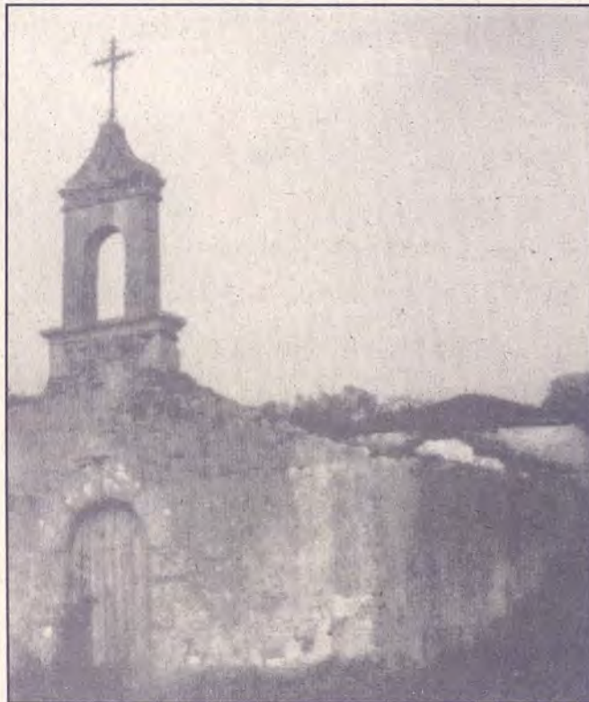
Actual estado da ermida de Santa Isabel

caso e púxose a afiar a fouciña. Cando rematou de afiala, dous merlos voaron sobor da súa testa e díxéronlle: «Hoxe é día de festa e está mandado descansar. Deixa a seitura pra mañá». O home non acreditou naquela mensaxe e coidou que un veciño lle quería gastar unha broma pois sempre hai xentiña pra todo. Por fin cando botou mau as