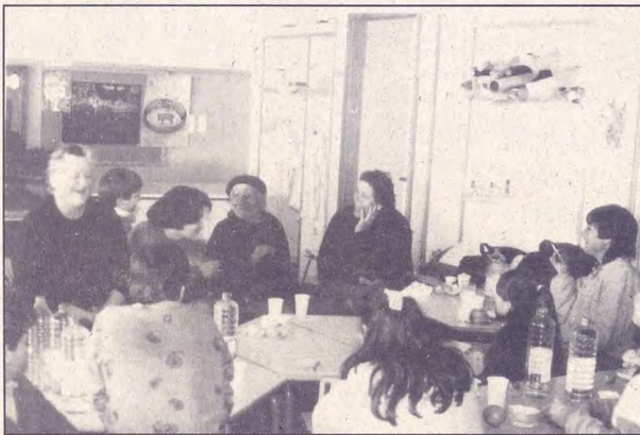
Nenos e vellos teñen moito que intercambiar

As horas pasábanse arredor da lareira -e non gastando moita leña, por ser un ben escaso-. Meus avós contaban que sendo eles nenos na casa nunca podía falta-lo rosario diario, pero logo