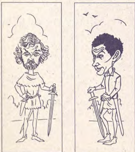
Uníuse a esquerda nacionalista, por fin; velai o froito á vista.

"Dorme, non morre" –volveron cantando– "nós durmiremos, se somos coma el limpos e xustos, brillantes, audaces. Nunca pra nós será triste o solpor".