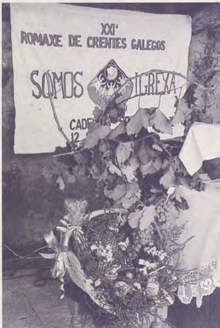
O ramo do relevo. Esperámosvos en Porto do Son

A gracia está en vivir instalados nesa saudade, cos pés –e as mans– no presente, viva a memoria subversiva e o corazón ancorado no futuro.