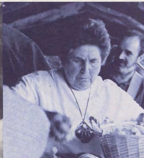
Todos comulgamos con "SOMOS IGREXA"