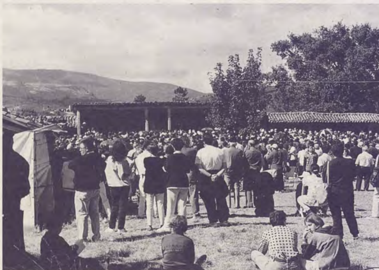
Hai quen di que imos de cu con isto de "SOMOS IGREXA". ¿E non será que están quedando atrás?