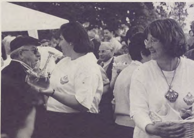
Unha moi boa acollida