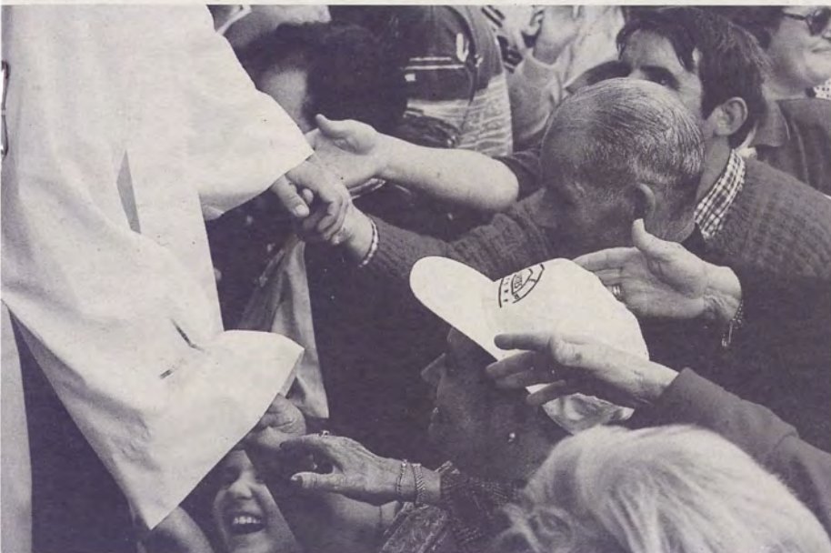
Insistimos: SOMOS IGREXA