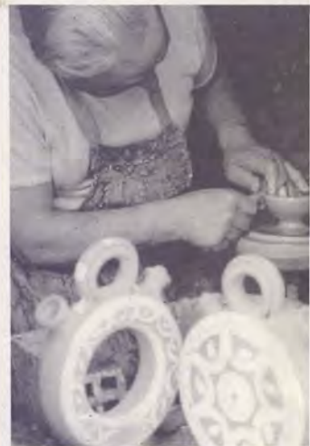
Se viches traballar a un dos nosos oleiros, coidarás que dificilmente se pode atopar un exemplo máis axeitado para suxerir-lo que é unha creación