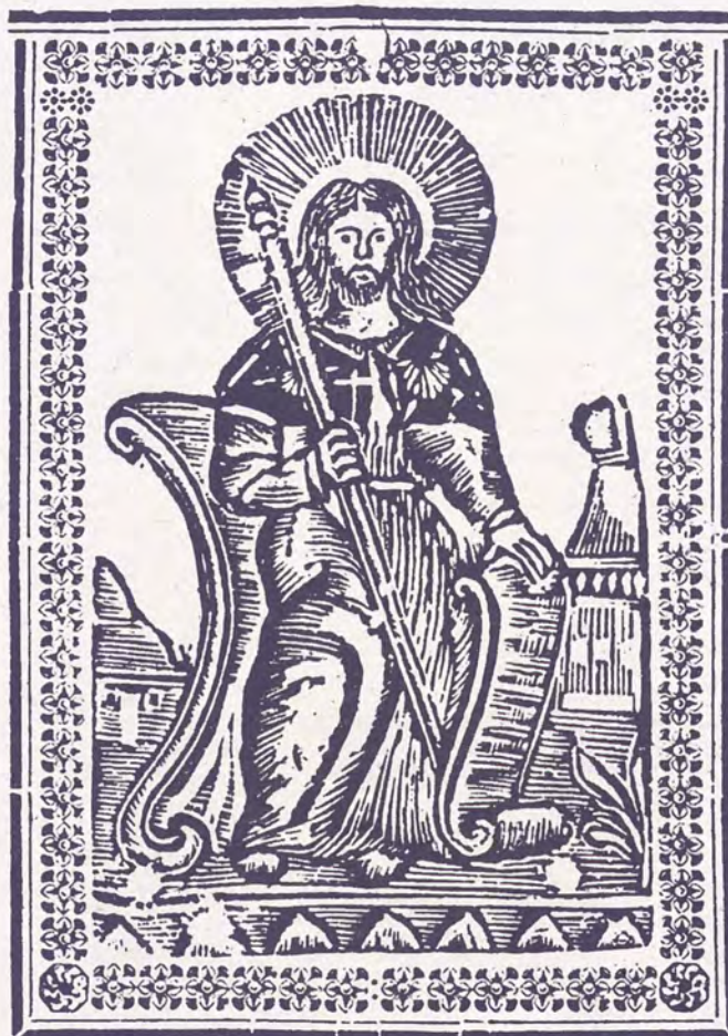
SANTIAGO APÓSTOLO, Grabado antigo (Colec, Bouza-Brey, Museo do Pobo Galego).

¡Ay, Santiago, padrón provado, vós mh' adugades o meu amado! Sobre mar vén quen frores d' amor ten, myrarey, madre, as torres de Geén'.