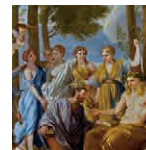
3 aretoa POUSSIN Parnaso