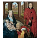
58A aretoa HANS MEMLING Errege Magoen adorazioa triptikoa