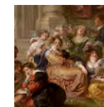
29 aretoa RUBENS Maitasunaren lorategia