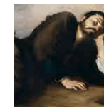
9 aretoa RIBERA Jacoben ametsa