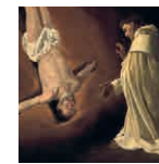
10A aretoa ZURBARÁN San Pedro agerpena San Pedro Nolascori