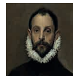
8B aretoa GREKOA Zalduna eskua bular gainean duela