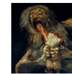
67 aretoa GOYA Saturno