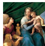
49 aretoa RAFAEL Arrainaren birjina