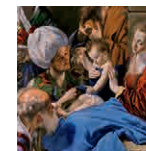
7A aretoa MAÍNO Hiru Erregeen adorazioa