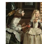
12 aretoa VELÁZQUEZ Meninak