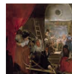
15A aretoa VELÁZQUEZ Iruleak edo Arakneren elezaharra