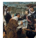
9A aretoa VELÁZQUEZ Lantzak edo Bredaren errendizioa