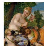
26 aretoa VERONESE Venus eta Adonis