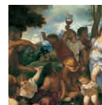
42 aretoa TIZIANO Andriarren bakanala