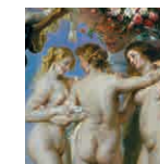
29 aretoa RUBENS Hiru Graziak