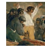
64-65 aretoa GOYA 1808ko maiatzaren 3ko fusilatzeak