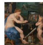
83 aretoa JAN BRUEGHEL ETA RUBENS Zentzumenak: Ikusmena