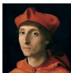
49 aretoa RAFAEL Kardinala