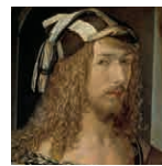
55B aretoa DÜRER Autorretratua