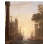
2 aretoa LORENA Erromako Santa Paularen ontziratzeara