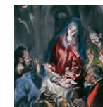
10B aretoa GREKOA Artzainen adorazioa