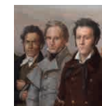
61A aretoa GISBERT Torrijosen eta haren adiskideen fusilamendua