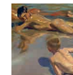
60A aretoa SOROLLA Haurrak hondartzan