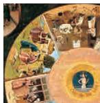
56A aretoa BOSCH Bekatu nagusien mahaia