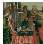
56B aretoa MANTEGNA Ama Birjinaren heriotza