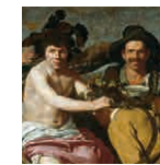
11 aretoa VELÁZQUEZ Mozkortiak