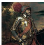
27 aretoa TIZIANO Carlos V. zaldi gainean, Mühlbergen