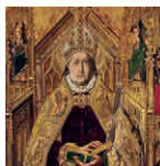
51A aretoa BERMEJO Santo Domingo de Silos apezpiku gisa tronuratuta