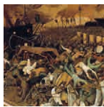
55A aretoa BRUEGEL Heriotzaren garaipena