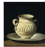
10A aretoa ZURBARÁN Natura hila trasteekin