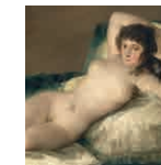
36 aretoa GOYA Maja biluzia