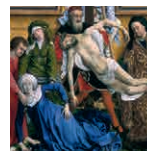
58 aretoa VAN DER WEYDEN Jaitziera gurutzetik