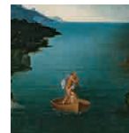
55A aretoa PATINIR Estigia aintzira