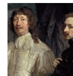
16B aretoa VAN DYCK Sir Endymion Porter eta Anton van Dyck