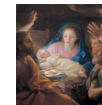
89 aretoa MENGS Artzainen adorazioa