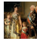
32 aretoa GOYA Karlos IV.aren familia