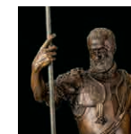
1 aretoa LEONE ETA POMPEO LEONI Carlos V.a eta Furor