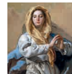
19 aretoa TIEPOLO Sortzez Garbia