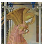
56B aretoa FRA ANGELICO Adierazpena