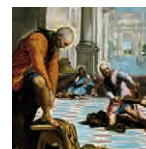
25 aretoa TINTORETTO Oin garbiketa