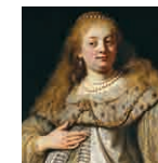
76 aretoa REMBRANDT Judith Holofneshen oturuntzan