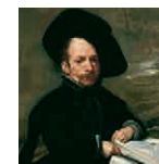
Mailegúan VELÁZQUEZ Buofoa liburuak