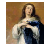
16 aretoa MURILLO Andre Maria Sortzez Garbia