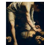
6 aretoa CARAVAGGIO David Goliaten buruarekin