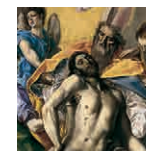
8B aretoa GREKOA Hirutasun santua