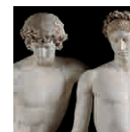
71 aretoa ANONIMOA Orestes eta Pilades edo San Ildefonsoko multzoa