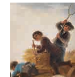
85 aretoa GOYA Larraina edo Uda