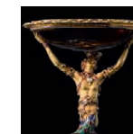
79B aretoa ANONIMOA Kopa urrezko uhandrearekin

Fra Angelico, Granadañaren Ama Birjina (behetasuna), 1426 in.