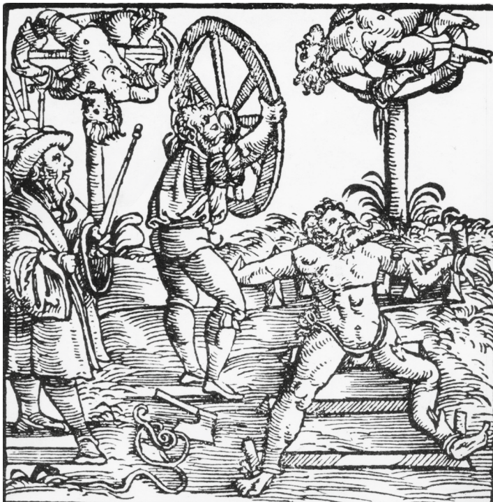
Johann Stumpf „Schweizer Chronik des Johann Stumpf“ (Rädern)