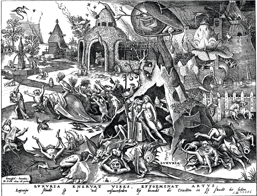
Peter Brueghel d. Ä. „Die sieben Laster – Luxuria“