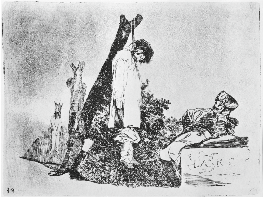
Francisco de Goya „Los desastres de la guerra“ (36: „Tampoco“)