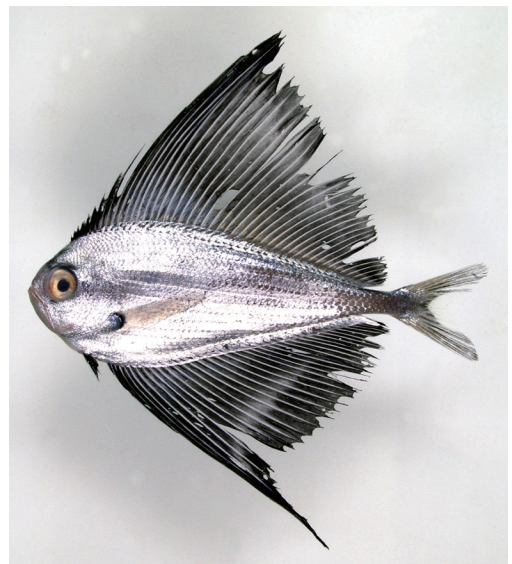
Fig. 7. Fresh specimen of Pterycombus petersii . KAUM-I. 30506, 132.1 mm SL, Minami-satsuma, Kagoshima Prefecture, Japan.

れた体長約 20 cm の本種 1 個体を報告した。魚津水族博物館 (1997) は定置網で得られた全長 23 cm のリュウグウノヒメ 1 個体を富山県滑川市吉浦沖から報告し、瀬能ほか (1997) は沖縄県慶良間諸島渡嘉敷島の水深 5 m 付近から本種を水中写真に基づき報告した。谷津 (1997c) はリュウグウノヒメを九州 — パラオ海嶺から報告し、鈴木ほか (2000) は本種 1 個体 (OMNH-P 12734) を兵庫県浜坂町から報告した。前田・筒井 (2003) はリュウグウノヒメを北海道日本海側から報告し、Shinohara et al. (2011) は本種 1 個体 (OMNH-P 93916) を兵庫県日本海沿岸から報告した。河野ほか (2011) はリュウグウノヒメが山口県下関市日本海沿岸および萩市鱒島東方沖から得られたことを報告した。また、波戸岡・甲斐 (2013) は兵庫県美方郡香美町香住から本種 1 個体 (FAKU 130213) を報告した。富山 (2013) は全長約 30 cm のリュウグウノヒメ 1 個体 (MSM-12-49) を静岡県静岡市興津沖から報告すると同時に、本種の飼育下における遊泳の様子を報告した。したがって、記載標本は鹿児島県沿岸における本種の標本に基づく初めての記録である。