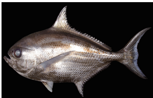
Fig. 5. Fresh specimen of Eumegistus illustris . KAUM-I. 68443, 549.0 mm SL, Kikai-jima island, Kagoshima Prefecture, Japan.

島から報告し、Shinohara et al. (2014) は本種を沖縄諸島北方沖から報告した。池田・中坊 (2015) は本種 1 個体 [WMNH-PIS-WW 15506 (1), 体長 343 mm] を和歌山県紀伊水道から報告した。調査標本のうち、KAUM-I. 68443 は喜界島におけるチカメエチオピアの標本に基づく初めての記録である。