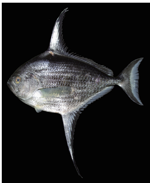
Fig. 9. Fresh specimen of Taractichthys steindachneri . KAUM-I-62427, 207.5 mm SL, Ibusuki, Kagoshima Prefecture, Japan.

なお、現在マンザイウオとエボシダイの名称はそれぞれ Taractes asper Lowe, 1843 (シマガツオ科) と Nomeus gronovii (Gmelin, 1789) (エボシダイ科) の標準和名として使用されている (波戸岡・甲斐, 2013 ; 中坊・土居内, 2013)。