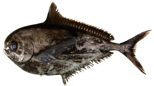
Fig. 2. Fresh specimen of Brama japonica . KAUM-I. 68642, 391.0 mm SL, Tanega-shima island, Kagoshima Prefecture, Japan.

本調査標本は鹿児島県沿岸ならびに大隅諸島における本種の標本に基づく初めての記録である。