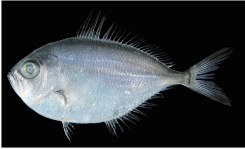
Fig. 4. Fresh specimen of Brama pauciradiata . KAUM-I. 9916, 49.3 mm SL, Minami-satsuma, Kagoshima Prefecture, Japan.