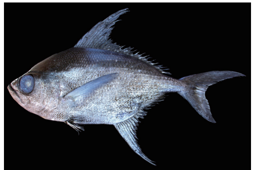
Fig. 8. Fresh specimen of Taractes asper . KAUM-I. 10567, 549.0 mm SL, Kagoshima Prefecture, Japan.

(Döderlein, 1883) に対して用いられた和名であり、望月 (1984e) がマンザイウオの名称を Taractes asper の和名にあてた理由は不明であるが、波戸岡 (2000) も T. asper の標準和名をマンザイウオとした。前田・筒井 (2003) はマンザイウオを北海道太平洋沿岸と日本海沿岸から報告し、瀬能・北村 (2003) は本種の幼魚がユウレイクラゲ Cyanea nozakii Kishinouye, 1891 に付随し遊泳する姿を伊豆大島秋の浜の水深6 mから水中写真に基づき報告した。記載標本は詳細な産地が不明であるが、鹿児島県におけるマンザイウオの標本に基づく初めての記録である。