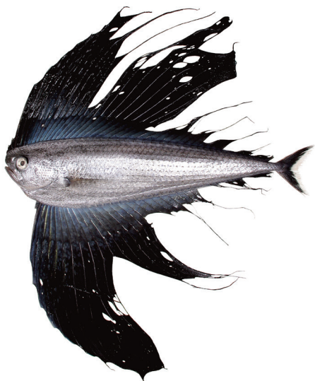
Fig. 6. Fresh specimen of Pteraclis aesticola . KAUM-I. 55739, 518.0 mm SL, Yoron-jima island, Kagoshima Prefecture, Japan.

たベンテンウオ 1 個体 [WMNH-PIS-WW 15508 (1), 体長 114 mm] を報告した。