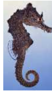
Slika 20. Hippocampus camelopardalis ( http://www.seahorse.org/ )