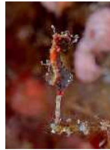
Slika 35. Hippocampus severnsi ( http://www.daveharasti.com/ )