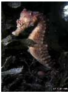
Slika 25. Hippocampus hippocampus ( http://web.ukonline.co.uk/ )