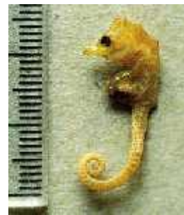
Slika 30. Hippocampus minotaur ( http://www.ifg.biotech.org/ )