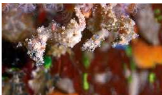
Slika 34. Hippocampus satomiae