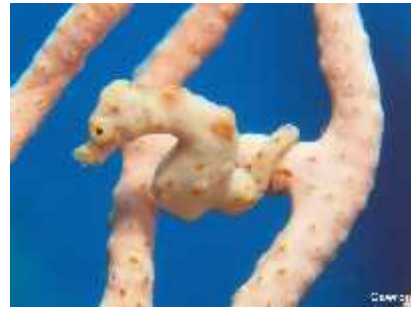
Slika 22. Hippocampus denise ( http://www.starfish.ch/photos/ )