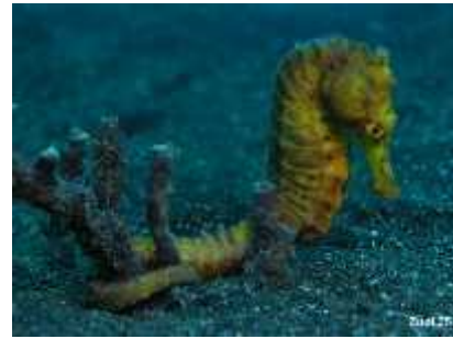
Slika 29. Hippocampus kuda ( http://www.starfish.ch/photos/ )