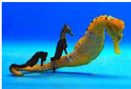
Slika 33. Hippocampus reidi