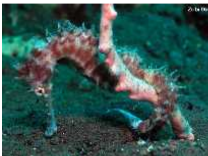
Slika 26. Hippocampus histrix