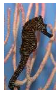
Slika 38. Hippocampus zebra