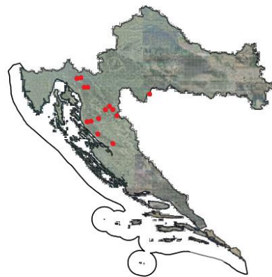
Slika 3. Talus vrste Buxbaumia viridis Slika 4. Rasprostranjenost u Republici Hrvatskoj (Nikolić, Flora Croatica Database, 2019)