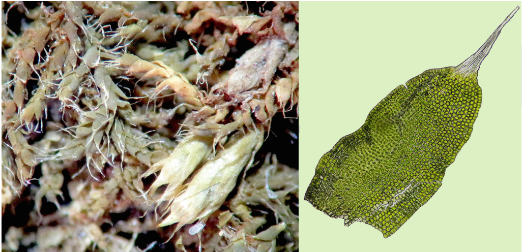
Figura 1. Tricherpodium becarii : A. gametofito con esporofito. B. filidio

densamente espiculosos; opérculo cónico-apiculado a cónico-rostrado. Caliptra largamente campanulada o mitrada, raramente cuculada.