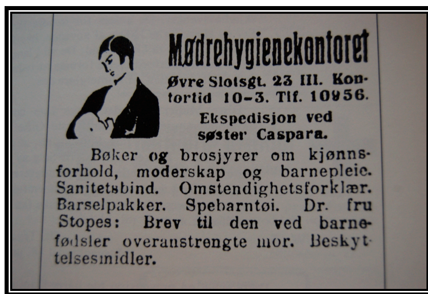
En av de første annonsene til Mødrehygienekontoret i Oslo

Helst vil vi få lov til å få vårt gamle avertisement igjen, for de viser best hva vårt arbeide tar sikte på: å hjelpe den ved barnefødsler utslitte mor og å hjelpe henne på en forebyggende måte. 184