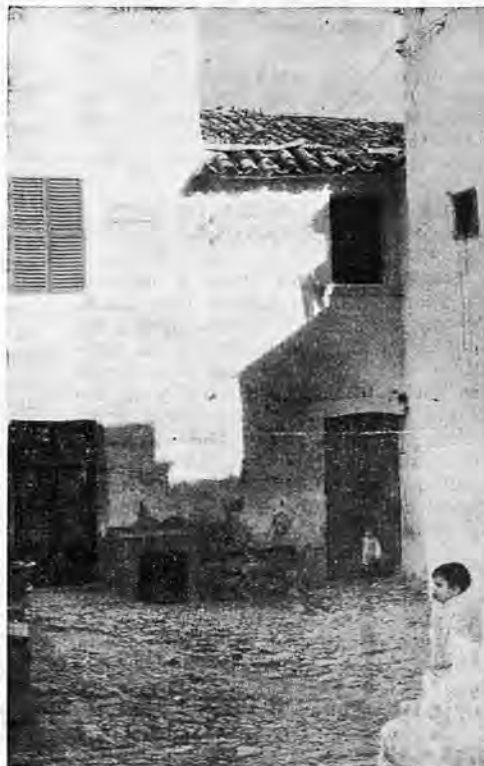
Casa donde han vivido varias generaciones de los llamados "cristianos nuevos", que supieron luchar por sus derechos en el siglo XVIII.

"El conjunto de aquella antigua población —según Don Juan Bautista los apellidos que en ella moraban, cristianos colonizadores, de judíos comerciantes y de esclavos moros". Anteriores a estos grupos, existía una población que podemos llamar autóctona, pues desde la cultura talayótica a la dominación musulmana, habían transcurrido millares de años y las islas Baleares, siempre estuvieron habitadas, razón por la cual los arqueólogos, con su vocación y utilizando los medios eficaces de investigación que la técnica moderna les ofrece, continuamente anuncian nuevos descubrimientos de restos de civilizaciones pasadas y aun remotas. Los cristianos colonizadores que llegaron con motivo de la Conquista,