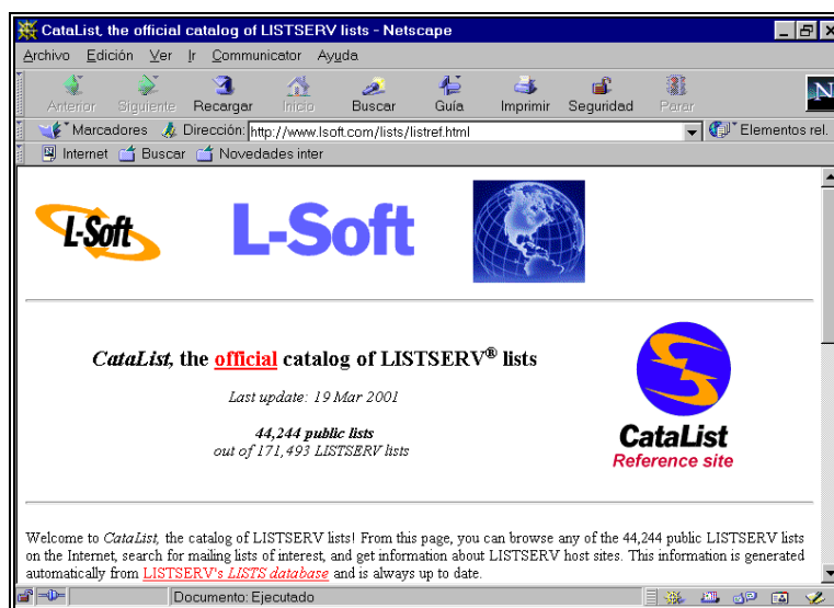
Figura 3. CataList

Tile-net/list es un directorio que reúne las listas de distribución gestionadas por distintos gestores existentes en Internet (LISTSERV, MAJORDOMO, LISTPROC, etc). En su base de datos se pueden seleccionar listas haciendo uso de un índice por nombres, dominios o descripción. También es posible agregar nuevas listas.