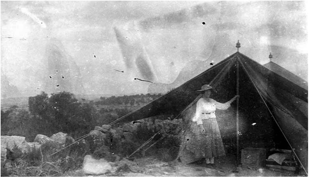
Fig. 2. c. 1917. Josefina García, esposa de Bosch Gimpera, en las excavaciones de San Antonio el Pobre (Calaceite).