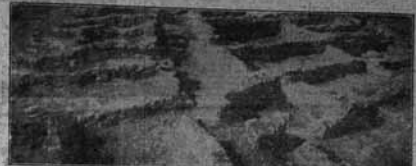
Photia thèria del Mont de Sant Antoni — Detall del sector de la part baixa