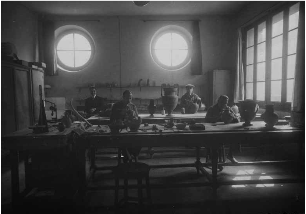
Fig. 9. . Taller de restauración en los locales del SIA.

con las gentes del pueblo terminado el horario de trabajo: «aquests dies s'ha corregut a totes les nenes cursis del poble, s'ha ballat, s'ha discutit la guerra amb els savis locals francòfils, etc.». 76