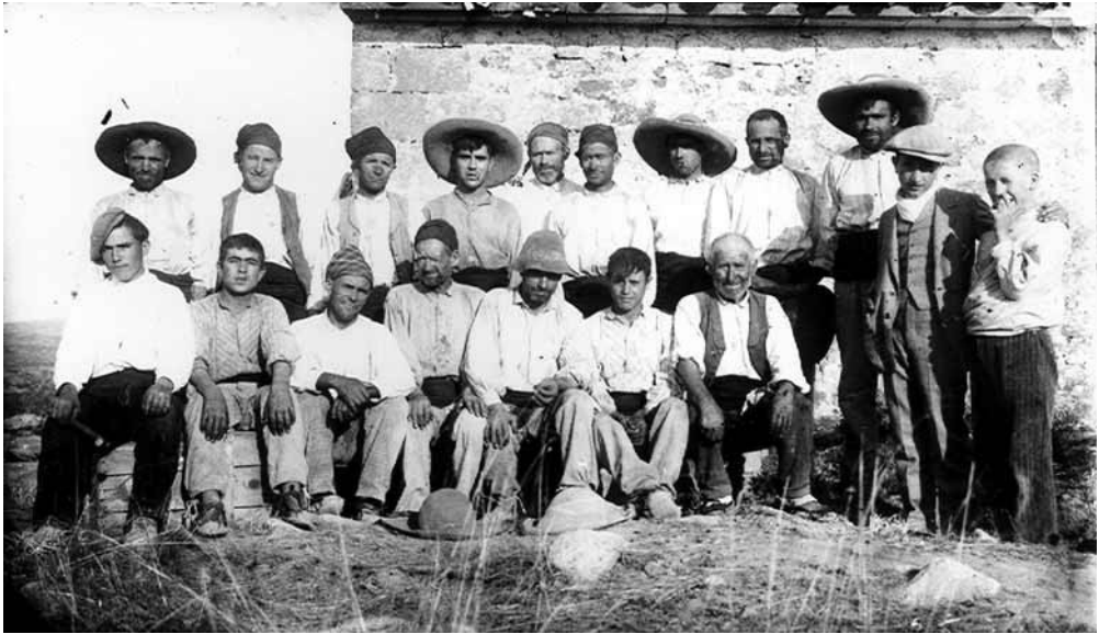
Fig. 5. c.1917-1918. Fotografía de grupo de los obreros contratados por Bosch Gimpera para la realización de las intervenciones en el poblado de San Antonio el Pobre (Calaceite).