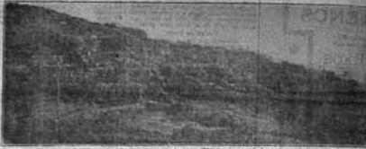
Photia thèria del Mont de Sant Antoni — Vista general de la part baixa