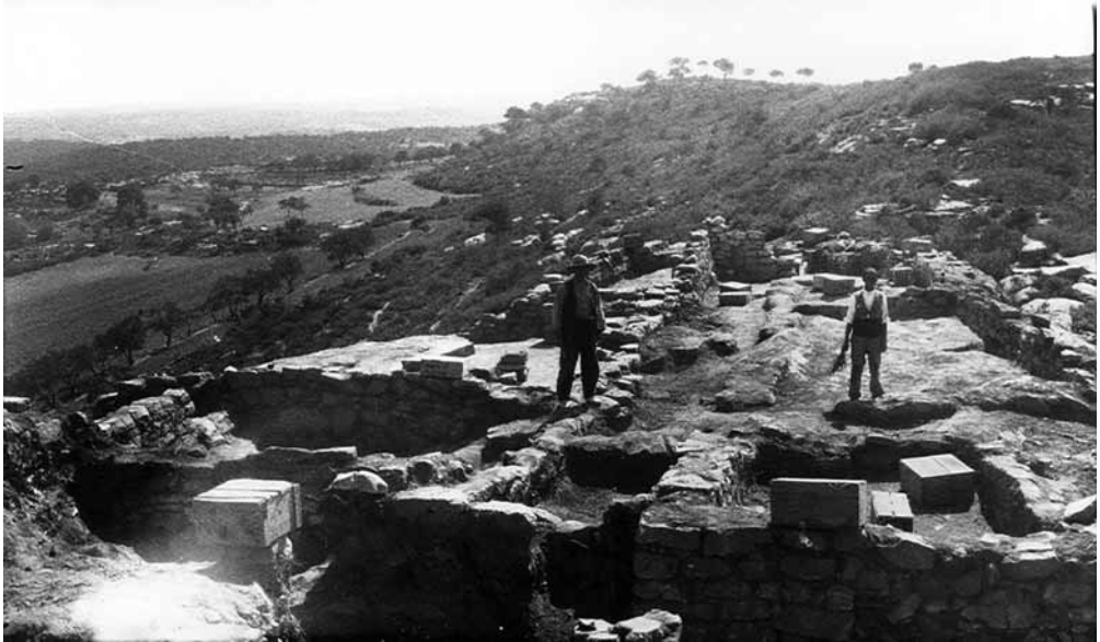
Fig. 4. c.1917-1918. Excavaciones del poblado de San Antonio el Pobre (Calaceite).