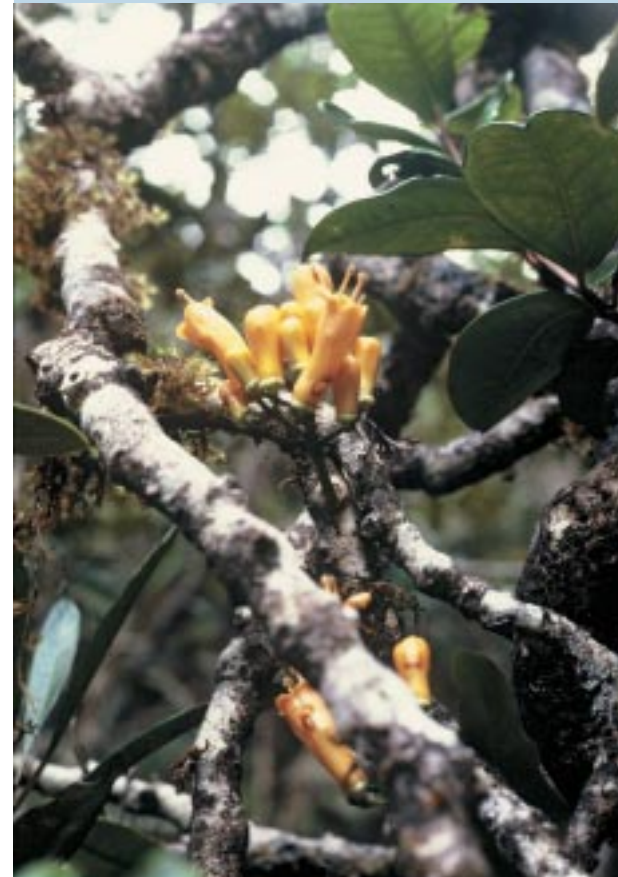
Oxera sp., plante parasite dans la forêt sommitale de la montagne des Sources, à 1 000 m d'altitude.

Plusieurs espèces de la famille des Cyatheaceae (fougères arborescentes) sont représentées dans les forêts de montagne mais une seule, Cyathea cicatricosa , serait cantonnée à ces formations orophiles. Les plus