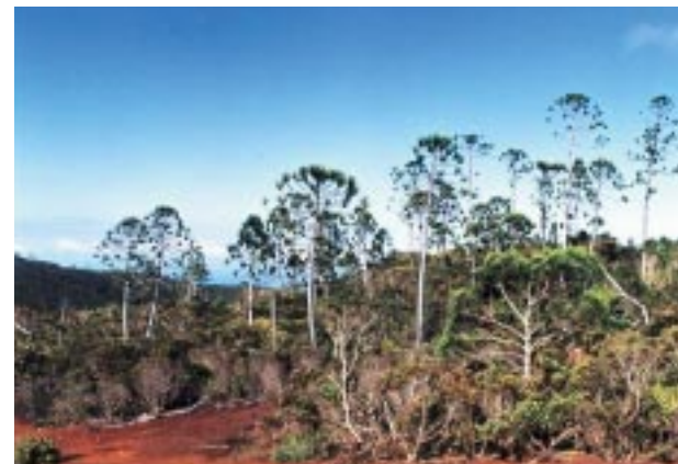
Vue du mont Krape. View of Mont Krape.

L'exploitation forestière de bois d'œuvre n'est pas une menace directe, sauf peut-être pour quelques sites particuliers (peuplements d' Agathis lanceolata du massif de Ni-Kouakoué, en limite supérieure de son aire de distribution). L'agriculture