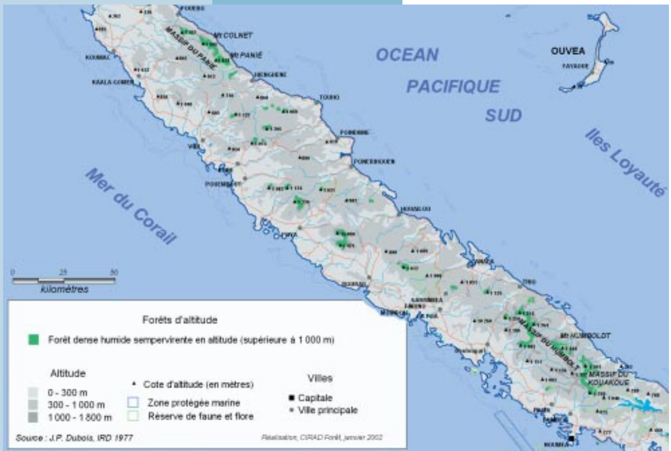
Carte 1. Forêts d'altitude en Nouvelle-Calédonie. Montane forest in New Caledonia.

En Nouvelle-Calédonie, dont les plus hauts sommets avoisinent 1 600 m, les formations végétales montagnardes se développent généralement au-dessus de 900-1 000 m mais se trouvent aussi à partir de 700-800 m d'altitude, notamment sur les façades orientales les plus arrosées. Dans certains cas particuliers, on observe même des formations de transition (enrichies en orophiles vraies) dès 500 m (VIROT, 1956). L'existence de formations végétales de type montagnard au-dessous de 1 200 m est liée à l'effet de « Massenerhebung » (GRUBB, 1971 ; BRUIJNZEEL et al. , 1993), à savoir l'apparition sur les massifs, ou les pics isolés, de formations montagnardes à des altitudes nettement inférieures à celles rencontrées dans les grands massifs montagneux. Cet effet initialement décrit dans les Alpes au début du siècle est