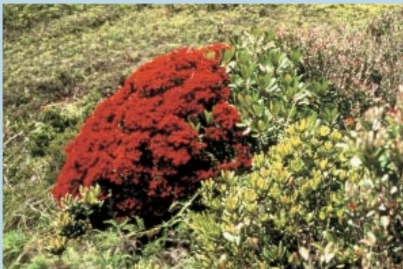
Metrosideros humboldtiana . Metrosideros humboldtiana .

Sur la base d'expérimentations en phytotron (BRUIJNZEEL, VENEKLAAS, 1998), ces conditions hyperhumides et globalement peu ensoleillées devraient conduire à l'existence de plantes « étiolées », hautes avec de longs entre-nœuds et de grandes feuilles fines et pâles. Or l'observation montre le contraire, la