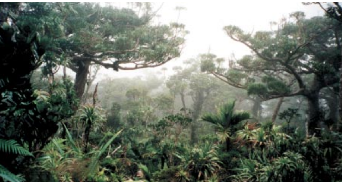
Forêt du mont Panié. Forest on Mont Panié.

Palabras clave: bosque de montaña, biodiversidad, ecología, Nueva Caledonia.