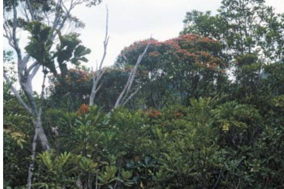
Metrosideros nitida dans la forêt des monts Dzumac, à 1 000 m d'altitude. Metrosideros nitida in the forests of the Dzumac range, at 1 000 m above sea level.

Les massifs montagneux néocalédoniens sont nettement plus arrosés que les parties basses. Cela se vérifie pour les massifs miniers de la côte ouest, sous le vent, qui reçoivent des quantités annuelles de pluie dépassant probablement 3,5 m dans la plupart des cas. Ce phénomène est exacerbé au nord-est du territoire, dans le massif du Panié (où le pluviomètre totalisateur a déjà enregistré