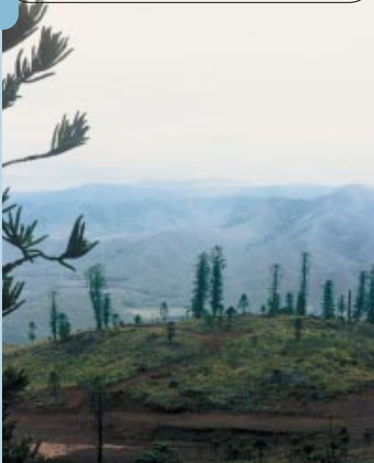
Araucaria laubenfelsii dans le maquis dégradé du mont Do, à 900 m d'altitude.

Araucaria laubenfelsii growing in degraded maquis on Mont Do, at 900 m above sea level.