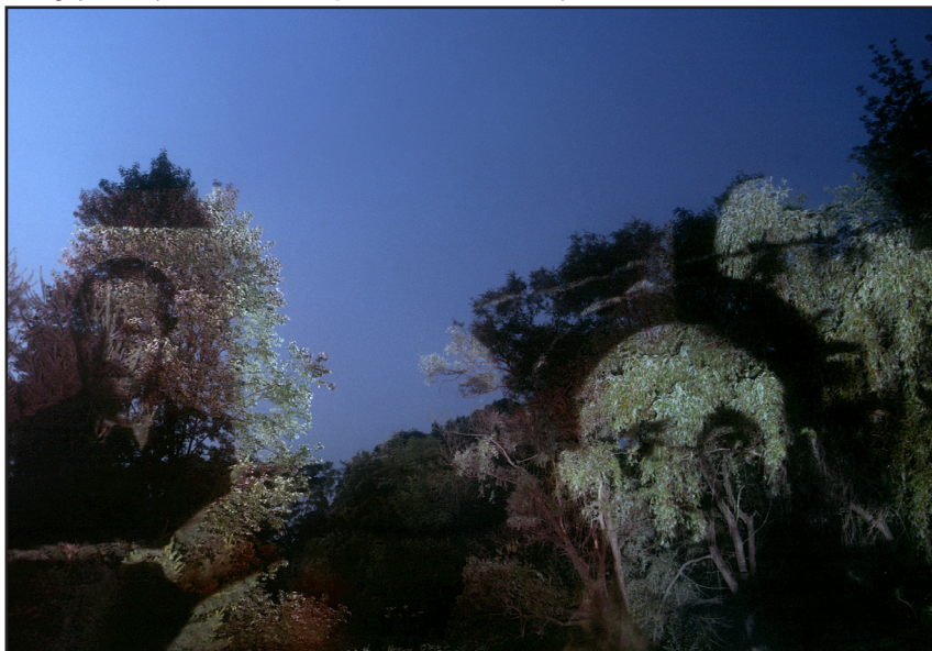
7. Sötétség és köd , ©Lorie Novak, 1990. A művész engedélyével.

rajzaiban, mind a Maus CD-s kiadásában többször merít. A CD-változat olvasói, ha rákattintanak egy képre, több archív felvételt is látnak; ez is azt hivatott bemutatni, mennyi láthatatlan kép létezik egyébként az ismerteken és gyakran látottakon túl is. A CD technológiája tökéletes választás ennek a feltárásához (lásd 6. ábra). Spiegelman azokra az elképesztő képekre hívja fel a figyelmet, amelyeket az auschwitzi ellenállás tagjai készítettek titokban. Ezek sokszorosításával azt a tendenciát korrigálja, amely a kevés számú kép kanonizálásának irányába mutat.