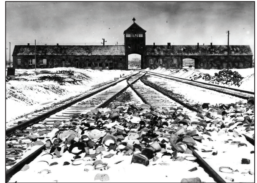
2. Auschwitz-Birkenau fő vasúti bejárata a tábor felszabadulása után.

A két kapuszárny a dehumanizálás és kiirtás narratíváira nyíló, nehezen átléphető küszöböt szimbolizálja. Debórah Dwork és Robert Jan van Pelt szerint „az Auschwitz utáni generációnak a kapu” – Auschwitz I. kapuja – „azt a küszöböt szimbolizálja, amely az oikomenét (az emberiséget) az Auschwitz-bolygótól elválasztja. Ez egy fix pont a kollektív emlékezetünkben, ennek megfelelően pedig a tábort bejáró körutak kanonizált kezdőpontja... Valójában az említett kapuboltozatnak soha nem volt központi szerepe Auschwitz történetében.” A legtöbb zsidó rab, írják, soha nem haladt át a kapun, mivel teherautón egyenesen Birkenaubra vitték őket elgázósítani. A tábor kibővítése során, 1942-ben ráadásul a kapu a táboron belülre került, nem pedig annak küszöbére. 27