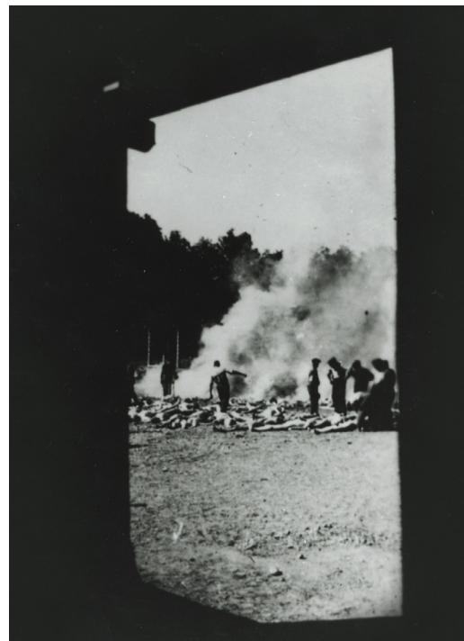
6. Titokban készült felvétel a holttestek elégetésére kényszerített Sonderkommandórol.

A holokauszt állandóan ismétlődő fényképei a fotográfiai kép „jelenvoltságán” keresztül kötik össze a múltat és a jelent. Egy rettenetes korszak hírvivői, amely még nem elég távoli. Az utóemlékező nézők, akik újra meg újra kiteszik magukat ugyanazon képek látványának, maguknak teremtik meg a traumatikus ismétlődésnek azt az érzését, amely a trauma áldozatait is megbénítja. Még az is, ahogy a képek a nézés traumáját megisméttlik, önmagában véve lehetetlenné tesznek mindenféle helyreállító törekvést. Csak új szövegekben és új kontextusokban felmerülve lesznek képesek