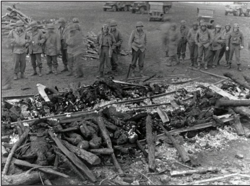
4. Amerikai csapatok az obrádrüfi koncentrációs táborban.

helyi és véletlenszerű, kölcsönös és visszafordítható, a vágy irányítja, de a hiány határozza meg. Amíg a nézést viszonzni is lehet, addig a tekintet az alanyát látványossággá alakítja. „A látómezőben – mondja Lacan – a tekintet rajtam kívül esik, engem néz, magyarul szólva, én egy kép vagyok. (...) A legalapvetőbb szinten, láthatatlanul mégis ez a kívül eső tekintet fog meghatározni engem.” Nézni és nézve lenni ezzel szemben összefüggő folyamatok: ha nézel, téged is látnak, ha valaki téged néz, visszanézhet rád, de legalábbis visszaverheted a fényt a forrásába. „A dolgok rám néznek, és én mégis látom őket” – mondja Lacan. A kölcsönös egymásra nézés közvetítő médiuma a szűrő ( screen ), amely különféle kulturális közmegegyezések és kódok segítségével a nézett tárgyakat láthatóvá teszi. A tekintetet is a szűrő közvetíti, azonban a nézés versenyre hívja és megpróbálja megszakítani. A látás összetett, a hatalma tehát megoszlik. Azt gondolom, hogy a fényképeket fel lehet használni ezeknek a komplex vizuális viszonyoknak a tanulmányozására. A fényképész hívó szavára a nézők a nézések képen belüli és a képen túlmutató kusza hálózatának részeivé válnak. A néző tehát egyszerre résztvevője és megfigyelője annak, ahogy a tekintetek bevésődnek a fényképbe, és ahogy mindez a nézéseken keresztül a képet strukturálja.