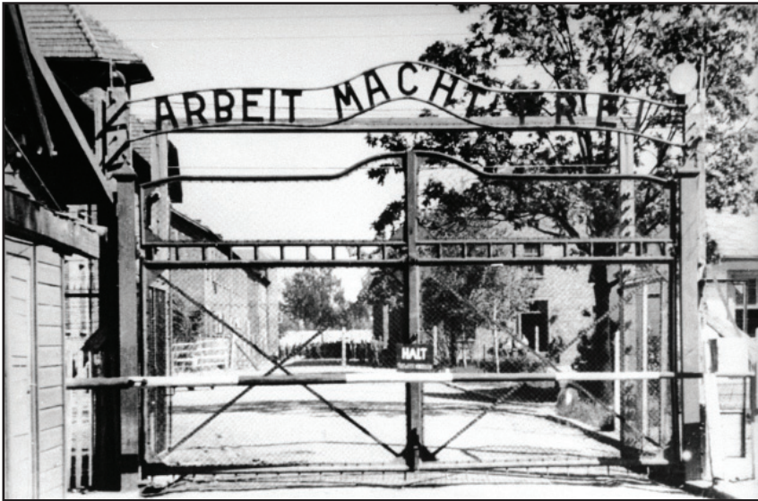
1. Auschwitz I. kapuja.

Ezeknek a képeknek a specifikus kontextusa már teljesen elveszett a folyamatos újra- meg újratermelésük során. Auschwitz I. kapujának vagy a toronynak a képei elkövetőhöz és felszabadítóhoz egyaránt kötődhetnek. A birkenai kapu előtt álló tárgyakon azonban már rajta van a felszabadító keze nyoma, a bulldózeres kép esetében pedig egyértelműen meghatározható, hogy a felszabadulás pillanatában készült, még ha bergen-belseni eredete nem is mindig egyértelmű mindazon esetekben, amikor felhasználásra kerül. Azt gondolom, bár teljesen nem vagyok benne biztos, hogy ezek a képek túl azon, hogy a „pusztulás ikonjaivá” váltak, a holokausztról való emlékezés toposzaiként is elkezdtek működni, illetve magának a fényképezésnek a toposzaiként, amennyiben a nézés aktusára hivatkoznak. Épp ilyen toposzokként épülnek bele – a holokausztra vonatkozó akár denotatív, akár konnotatív információs értékük mellett – ennyire szervesen az utóemlékezet vizuális diskurzusába. Ezzel egyidejűleg az ismétlődésük metaforikus szerepüket is megerősíti. 26