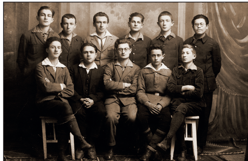
3. Hashomer Hatzair ifjúsági csoport, Csernyivci (Czernowitz/Cernauti), Románia, 1920-as évek.

kapuk, mind a ragyogó fények jól ábrázolhatók a fényképeken, még ha frusztráló egysíkúságuk, arra való képtelenségük, hogy átlépjék a keret alkotta határt, részleges és felszínes látásmódjuk, megvilágító hatásuk hiánya folytán a nézőben azt az érzést keltik is, hogy egy olyan küszöbön áll, ahol meg van tőle tagadva a belépés.