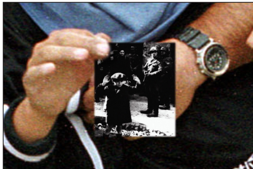
Alan Schechner, A bántalmazott gyerekek öröksége: Lengyelországtól Palesztináig. (2003) A művész és a szerző engedélyével.