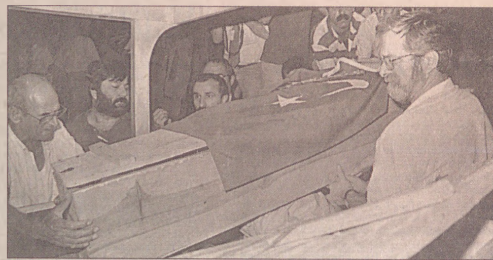
Aziz Nesin'in, üzerine Türk bayrağı örtülü tabutu Atatürk Havaalanı'nda oğlu Ahmet Nesin, yazarlar ve yurttaşlar tarafından alkışlarla karşılandı.