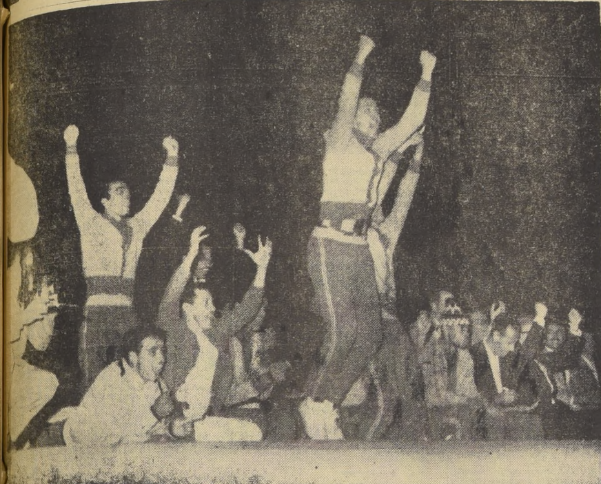
TERMINA EL PARTIDO y los hombres de Brasil que están en la banca, demuestran su alegría con gritos y expresiones muy espontáneas. Partido de juego magno, solvente, a ratos rudo, fue el de Brasil y Bulgaria, definido en el segundo tiempo en favor del elenco sudamericano. Último que los árbitros pusieron una nota de anomalía. Pero el triunfo de Brasil fue merecido y lo ubica en una posición expectable, con vistas al título.

Muy precario el triunfo del equipo campeón