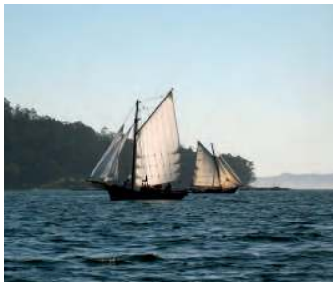
2009: navegando coas velas enchidas / Mjo Meneau