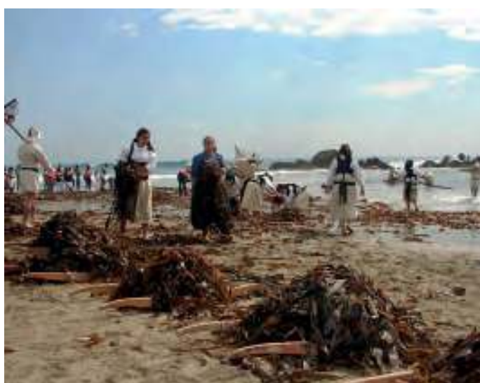
Recreação da mareada do ano 2009

sargaço, tempestades que acontecem durante um período sazonal e que arrancam as algas á pedra atirando-as ás praias. A comunidade de lavradores sarga-ceiros chegou no passado a armar barco e tripulação experiente, com elementos rurais misturados com alguns elementos mais experientes provenientes do universo piscatório vizinho. Frequentemente através de uma aprendizagem de experimentação e erro, a literalmente “imitar” as tripulações de pescadores (aquí ditas “companhas”) e chegaram a imitar mesmo o seu barco, exemplo do barco fundo de prato que imita as linhas de construção do caíco poveiro ou do canote de Fão. O fundo de prato é um pequeno barco de molde, pouco robusto, a imitar o possante barco de esqueleto, muito mais robusto e apto ao atlântico.