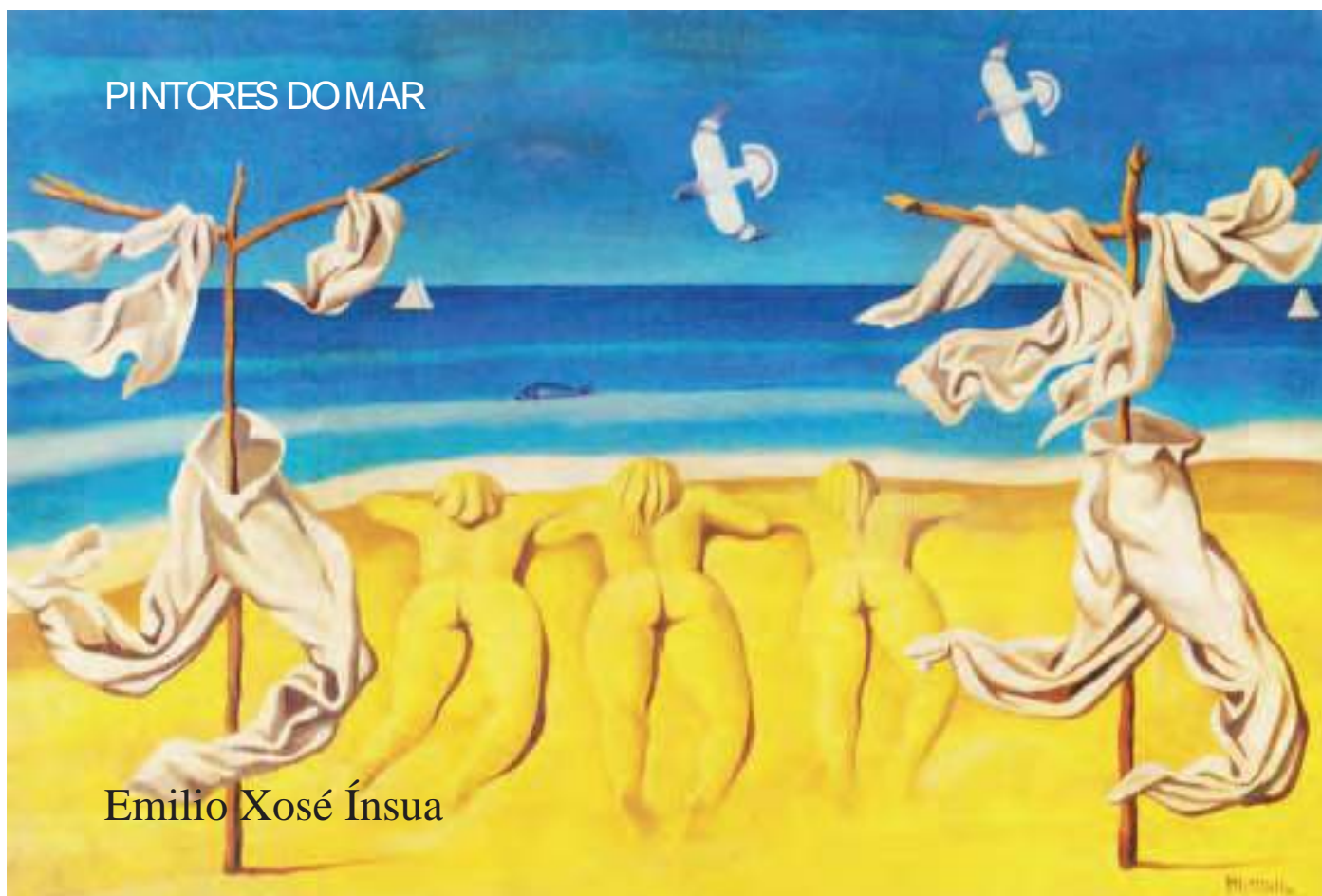
Emilio Xosé Ínsua