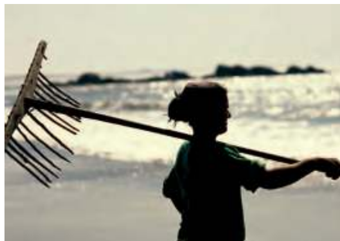
Padiola e graveta adoitavam ser cousa de mulheres

O norte Atlântico torna-se desde 1980 destino turístico, inicialmente de sol e praia das populações do interior do país que fazem o turismo balnear local, mas entretanto e fruto das políticas administrativas que transformam todo o país num território de acolhimento vinculado ao Turismo Cultural, com grande sucesso em produtos e destinos, como o Porto e Norte de Portugal e principalmente o Douro Vinhateiro (Douro Património da Humanidade), as paisagens agrícolas de outrora, mesmo quando os campos já não produzem, tornam-se motivo de interesse para o Turismo Natureza, valorizando-se o cadastro agrícola do passado, com os seus esteios graníticos (postes) demarcadores de propriedade, os caminhos entre muros altos das Quintas agrícolas (caças rurais) e as manchas de pinhal e floresta primitiva, que outrora eram plantadas para impedirem o avanço das areias e sal do mar que o vento transportava das praias para as terras do interior danificando os cultivos. A paisagem singular, ou enquadrada num território de visita, passa a ser produto e destino turístico.