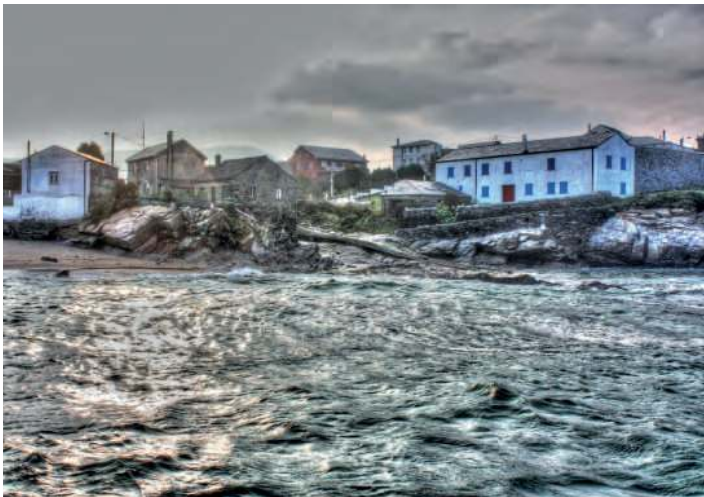
Porto de Nois