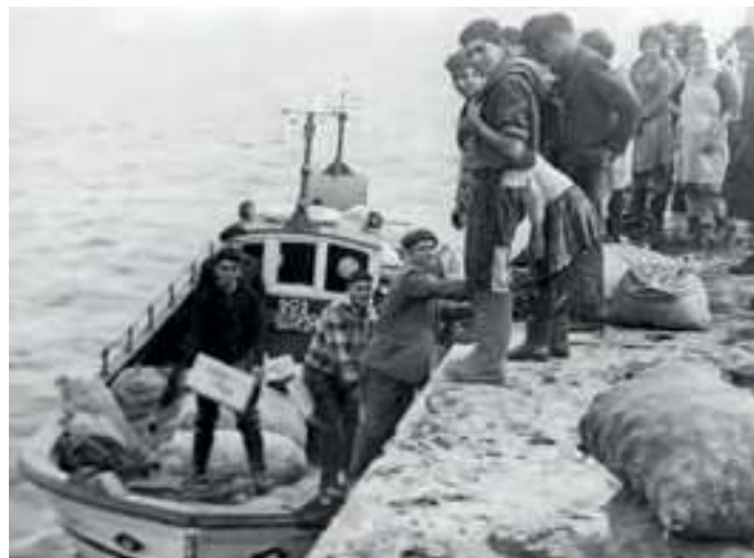
Descargando o peixe no porto, 1963

E xa che digho, antes todo eran dornas, na Illa todo eran dornas. Na Illa e en todo Castiñeiras. Dende Aghiño hasta Ribeira todo eran dornas. Elí é onde era a madre delas. E nós ibamos alá a comprar e a faser-e. Eu alí fixen dúas novas por dúas veses. E as