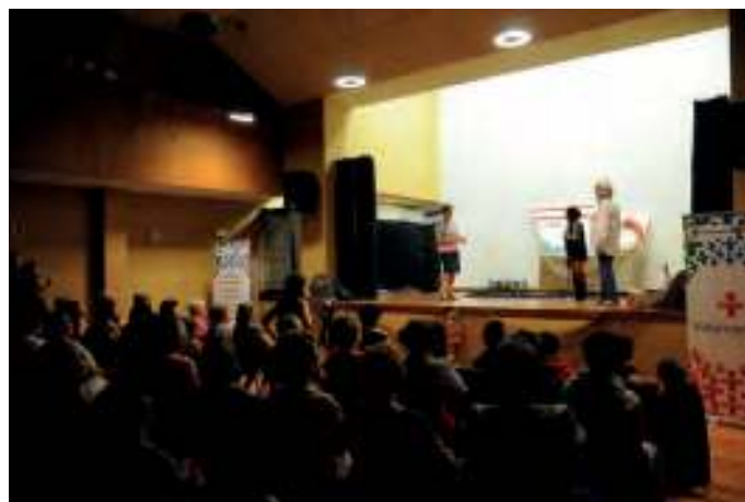
Unha actuación teatral realizada durante o Encontro

A primeira decisión foi orientar a programación ao mesmo rumbo que as embarcacións tradicionais teñen: a conservación e posta en valor do patrimonio cultural