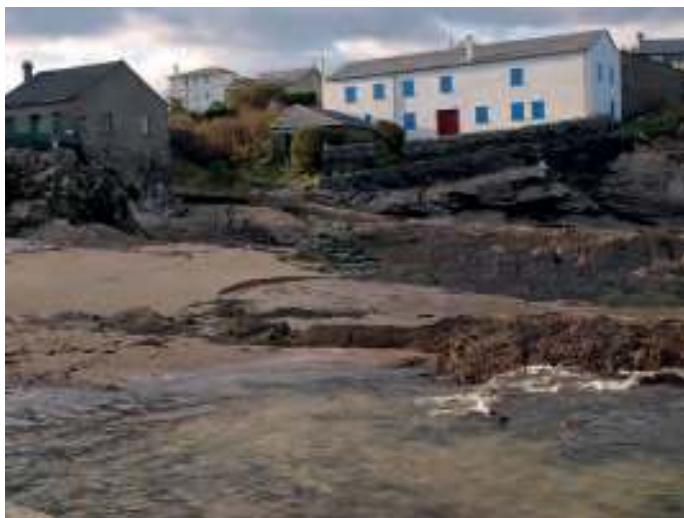
A fábrica nova, restaurada

O bicigueiro era unha arte para pícaros que achicabamos nas pozas para espetar as bícigas cun pequeno arpón na punta dunha vara... Así era a vida... E íase á olga con cestos, con burros, con carros... Polos có-