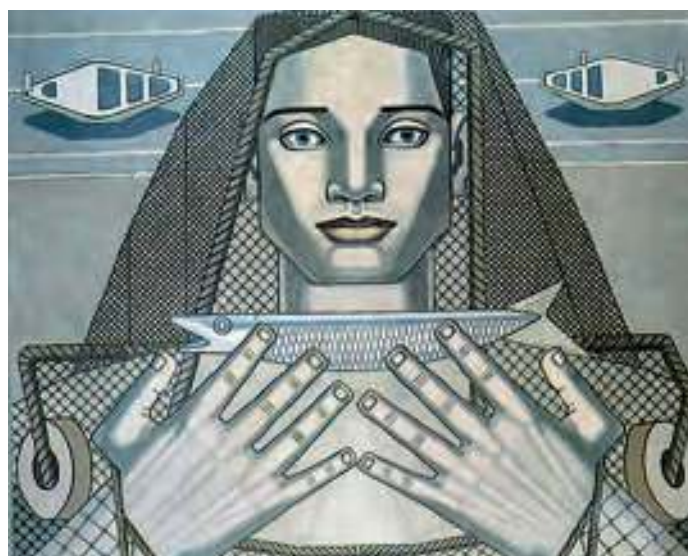
Arquitectura humana . 1937. Óleo sobre lenzo