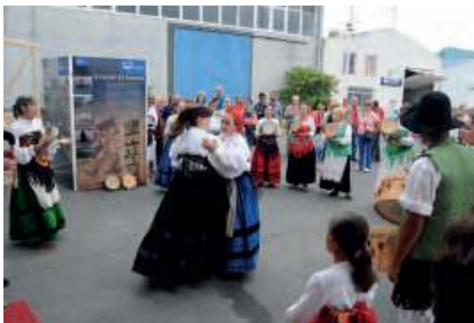
Música e baile tiveron un gran protagonismo durante a celebración