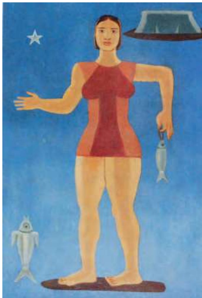
Muller con peixe e estrela de mar. Óleo sobre cartón. 38,5x28,5 cm.

os grandes popes do Surrealismo, expoñer na célebre Galería Pierre e coñecer ao uruguaio Joaquín Torres García, quen será decisivo coa súa proposta de “arte construtiva” na evolución de Maruja como artista no inmediato futuro, como poñen de manifesto as series “Arquitecturas minerales”, “Arquitecturas vegetales”, “Construcciones rurales”, os debuxos para as capas da Revista de Occidente e os deseños de platos decorativos de 1935 para a escola de cerámica dos irmáns Alcántara, onde non falta algún baseado en figuras de peixes.