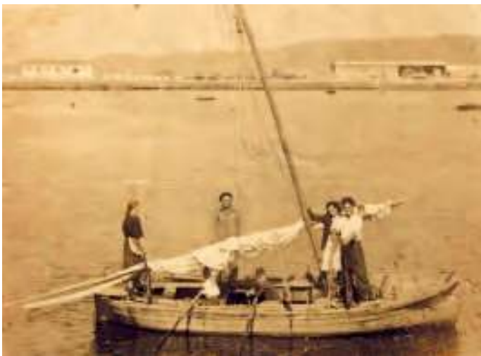
A traíneira 4 Hermanos , un dos últimos barcos a vela de Combarro (1950)