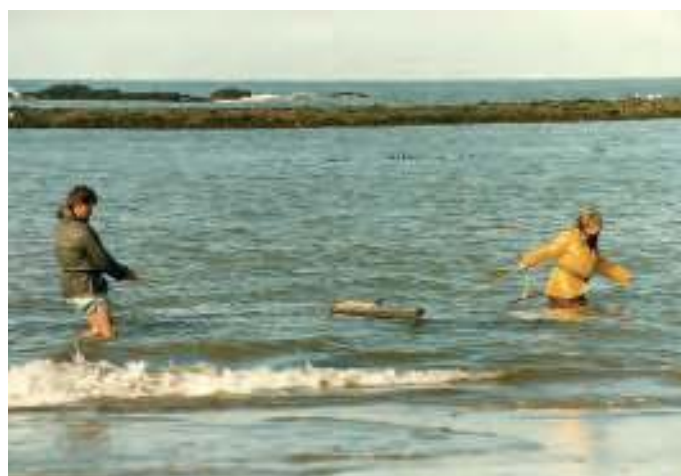
Trabalhando na recollida das algas