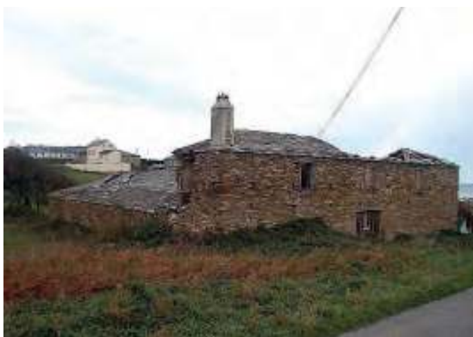
A fábrica vella