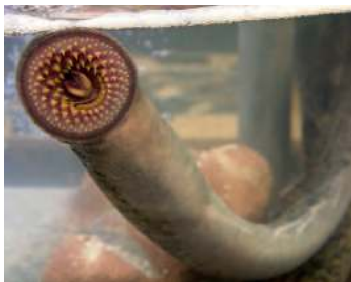
Unha lamprea dentro dun acuario