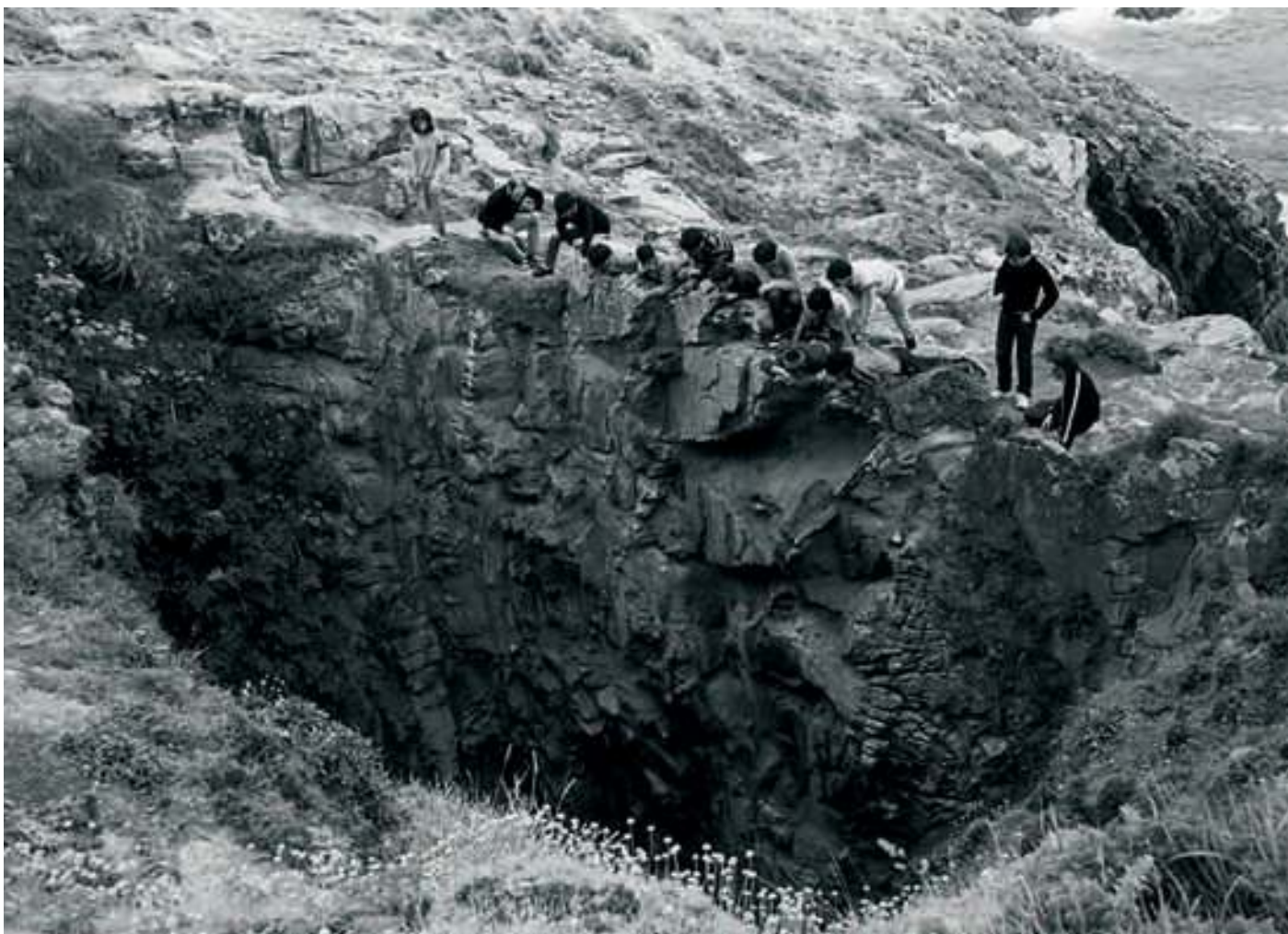
O Buraco do Inferno, nunha imaxe tomada no ano 1984

De outra ves, máis ó norte do Sentulo, en Cova de Vella. Eí tamén apareseu. Apareseu un que non había quen lle botara a man. E tuven que botarlla eu porque