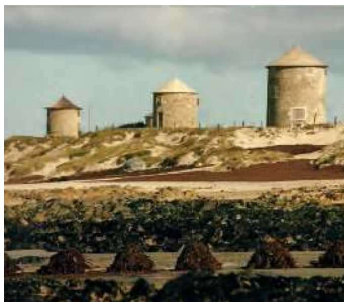
Sargaço amoreado sobre a area dunha praia do norte de Portugal

A atividade sargaceira regia-se por um conjunto de ferramentas e tecnologias de caráter artesanal e pré-industrial, ainda que envolvesse milhares de pessoas durante a época do sargaço (meses de Maio a Setembro) e resultasse em produto económico muito valioso. A fama do sargaço seco ao sol para “adubar” convenientemente as terras da batata e do milho justificava a sua valorização económica.