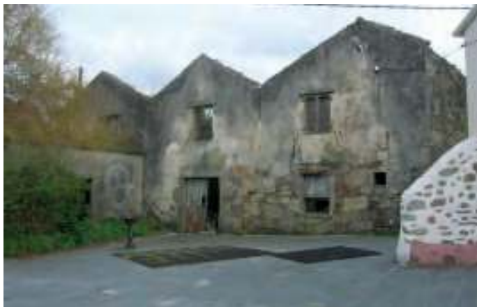
Estado actual da antiga salgadura de Beiro