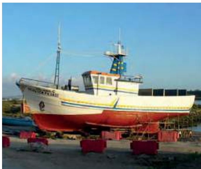
Sobre esta linha, dous barcos do extinto Estaleiro Isolino

Em resumo, na altura existem em actividade, reconvertidos para a manutenção em madeira, aço ou alumínio seis estaleiros navais cujo futuro é serem cada vez menos, com menos pessoal efectivo e em actividade dita sazonal durante as paragens das embarcações nas fainas, duas vezes por ano.