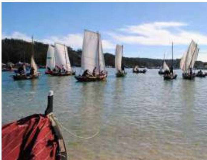
Despregando as velas no Porto de Meloxo / S. Rei

Tarde piache! Do encontro com as caniveiras, a visão dos parrulos a fugir, espantados por tão repentina invasão, chegada de embarcações estranhas. Não têm memória delas. Nem o rio. Não são coma nós, que contamos com versos e velhas fotografias. Olham com assombro os palmípedes, surpreendidos dos nossos risos, chegados sem a advertência que sempre lhes faz o bruar dos motores.