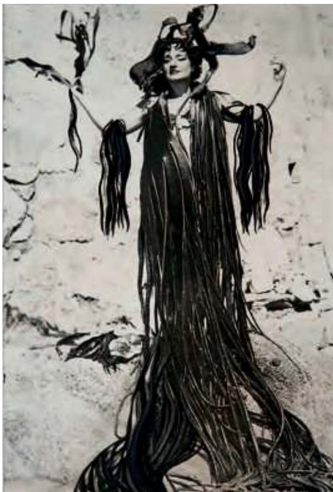
Maruja Mallo retratada cuberta de algas en Chile no 1945