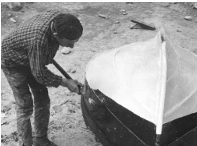
O mariñeiro Cachote pintando a dorna

Ai, eu teño pasado moitas nesta vida. Son moitos anos, rapás. Eu nasín en abril, o desaoito de abril do ano quince, na Illa; porque eu nasín na Illa. Pero estou equí no untamiento de Bueu anotado o seis de maio; e no carné de identidá teño o oito de junio! Acordo de pequenos, que íbamos ó monte co ghando pero, como eramos rapases, deixábamolo e puñámonos a xoghar-e. Xoghabamos ó rabuxiño, esí, agharrabámonos sete ou oito das mans e corriamos arredor ata caír-e. Ou á fucha, fasendo un buraco no chan, coma unha cova, había que contar cantos pasos foran para tirar á fucha e lansabamos pedras planas coma as patelas da chave a mirar quen as metía