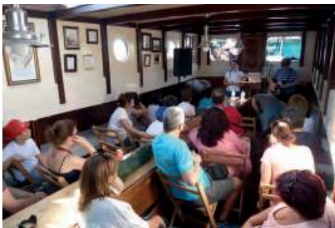
As actividades en terra e mar sucedéronse ao longo das xornadas

Como as mulleres vellas, teatralizando os labores do mar, moitos deles tan feminizados como olvidados.