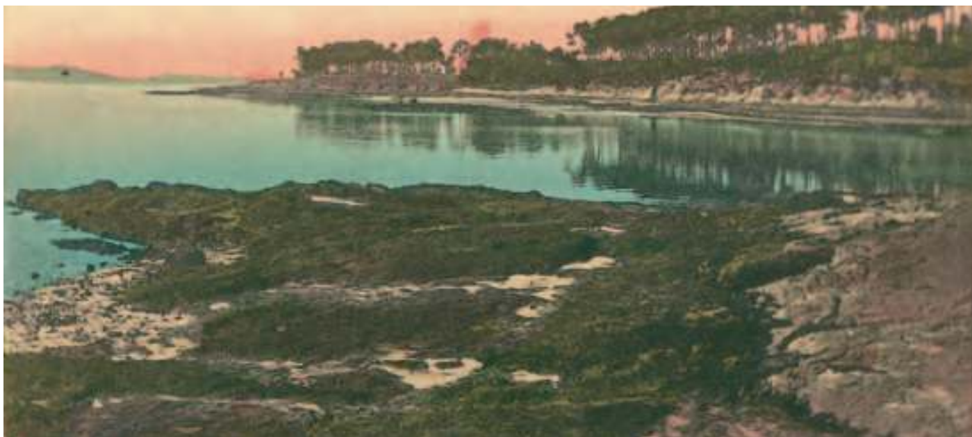
Antiga imaxe do pinar de Tragrove, en Cambados