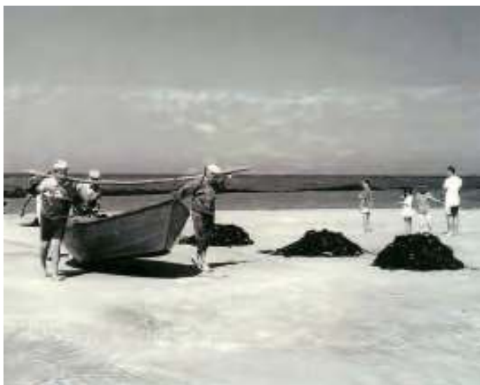
O sargaço debí secar ao sol

No final do séc. XIX vários inquéritos nacionais sobre o estado das pescas, das indústrias e da agricultura, registam a crescente importância de uma zona em particular na região norte, zona de contacto e intercâmbio de influências tecnológicas, fortemente marcadas pela proximidade, caso de Canidelo, Angeiras, Mindelo, Vila do Conde, Caxinas, Póvoa de Varzim, Aguçadoura, Apúlia, Fão, Marinhas, Castelo do Neiva, Cais Velho Darque, Praia Norte, Amorosa, Carreço, Afife, Vila Praia de Âncora e Moledo.