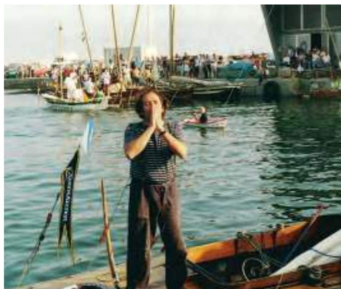
Unha instantánea no peirao de Poio / Mjo Meneau