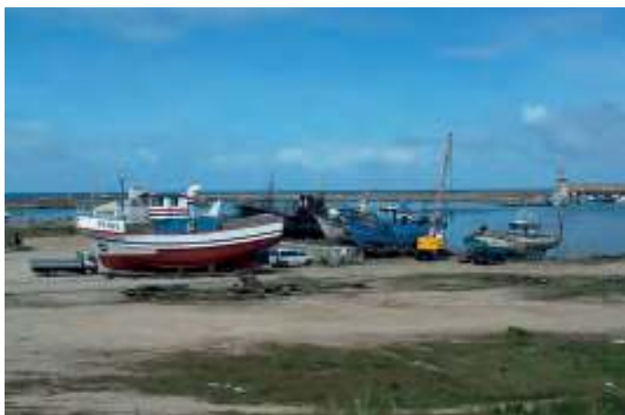
Estaleiro em Póvoa de Varzim