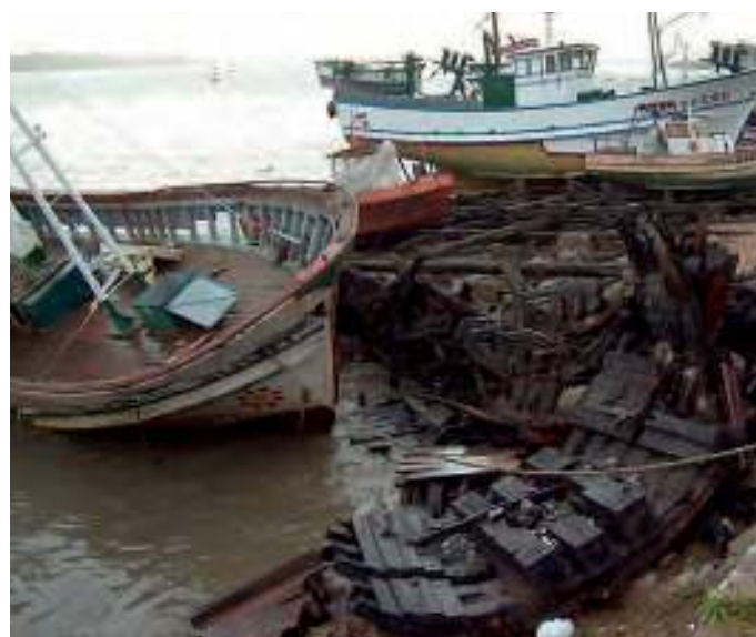
Duas imagens tomadas do Estaleiro do Ouro, situado em Foz do Douro