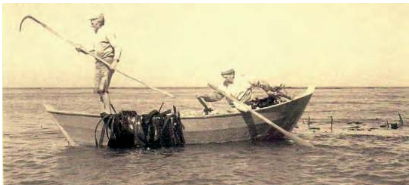
A comunidade de lavradores sargaceiros chegou a armar barco e tripulação experiente

Das comunidades agrícolas sargaceiras tradicionais, importa destacar duas comunidades “gémeas”, porque desde 1910 separadas administrativamente: a Vila