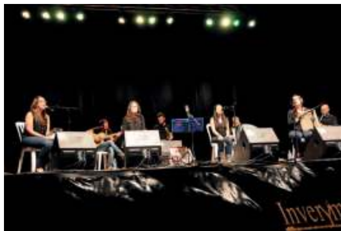
Un dos concertos incluídos no programa de Cabo de Cruz 2015

Foi fermoso participar no Encontro de Embarcacións Tradicionais de Galicia, e dende logo non perderei neste 2017 o Encontro que se desenvolverá en Combarro, porque dende que participei activamente neste evento, dende que me mergulleri na cultura marítima, dende que coñecín de preto os barcos de madeira e todo o que representan, gravouseme para sempre que só hai tres clases de persoas: as vivas, as mortas e as que navegan.