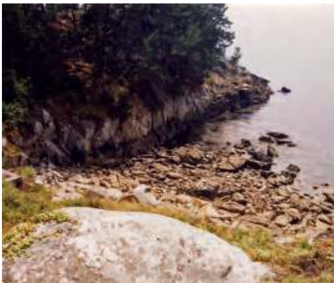
Abribo onde as embarcacións recalaban para facer augada

to en outra parte...” (endemismos). “Habas bravías; herbas de becerra; perexil do mar; espíela de caba-leiro; cebola do mar; toxos de meigas (máis pequenos e rastreiros que os de terra); cardos; borrajas bravías; fúncho bravo; trobisco; codeso; carnabazas; chicoria” . En canto á barrilla de Murcia, Sarmiento apunta “que es famosa y exquisita para todo... no hay mejor terreno para sembrar muchísima y con cosecha que la isla de Tambo. Higueras; parras; malvas; cálce-mos... de todo hay en la isla (remata o sabio) y sien-do tan fácil de andarse...” Contade que daquela non había eucaliptos e que os campos eran traballados ou polo menos atendidos polos veciños de Combarro.