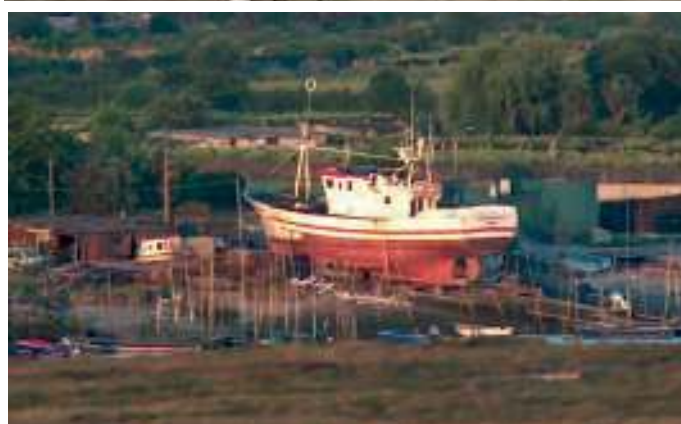
Tres imagens de estaleiros de Viana do Castelo