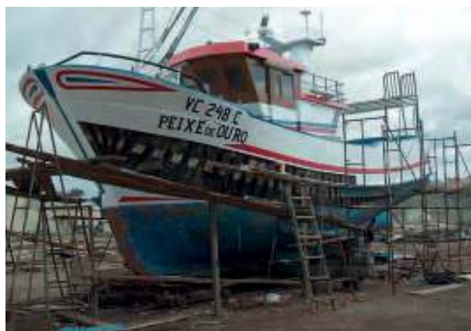
Cinco imagens tomadas entre 2003 e 2004 em estaleiros navais de Vila do Conde, Azurara