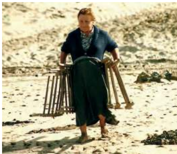
Unha muller ocupada nas faenas de recollida de algas

A apanha e utilização do sargaço no norte de Portugal está registada documentalmente desde o século XIV, com o Foral de D. Dinis em 1308 para a Póvoa de