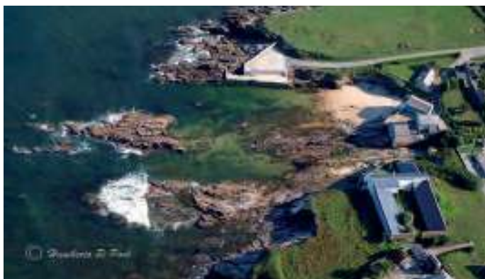
Dúas vistas aéreas do porto de Nois