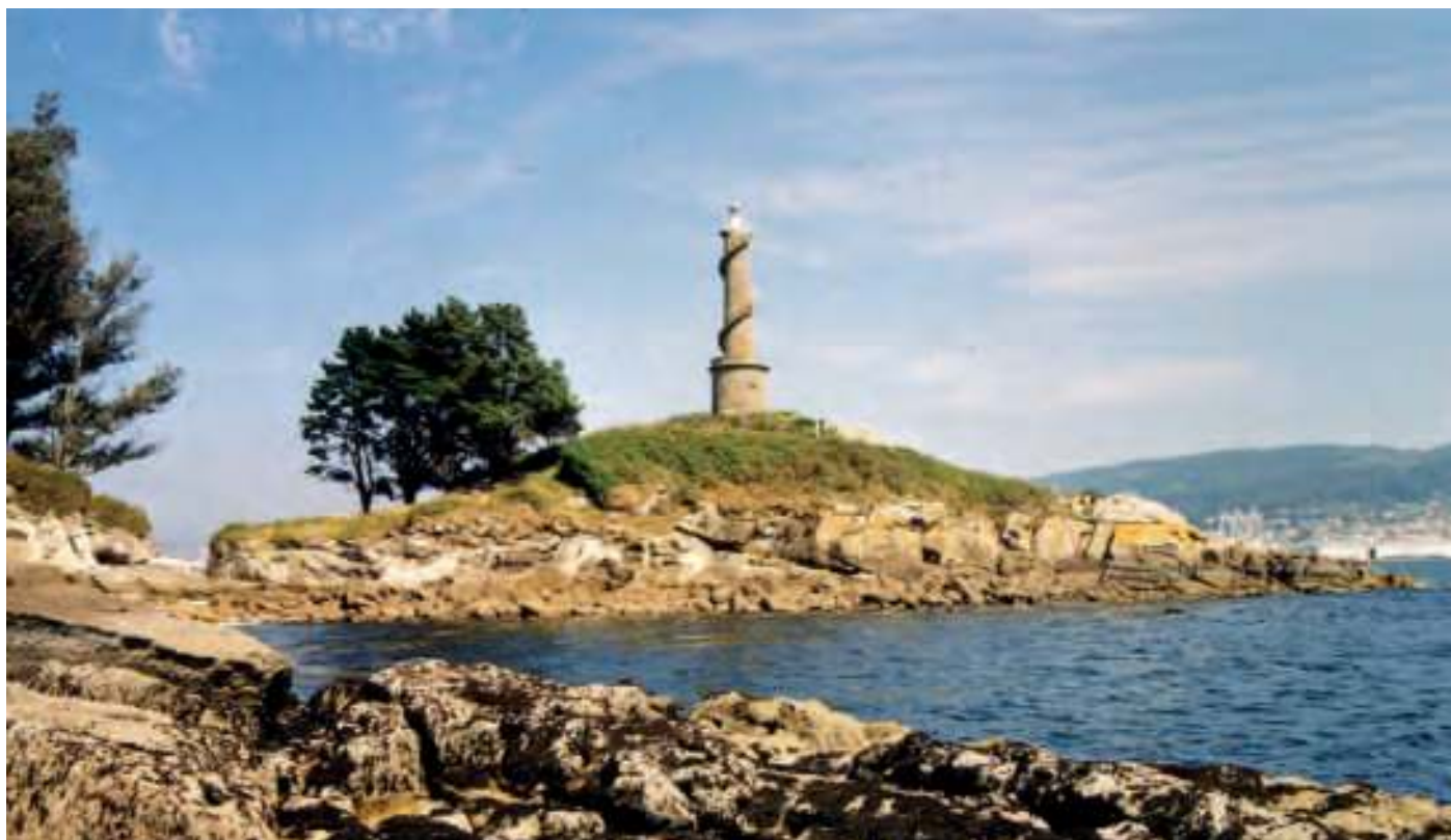
O faro que se alza en Punta Tenlo