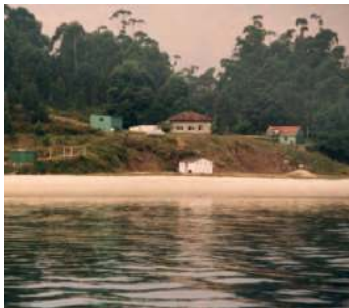
Edificacións en Tambo