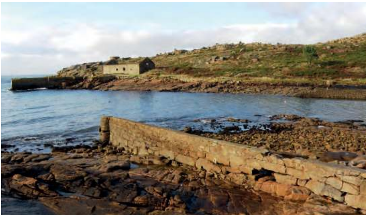
Caneliñas, protección da rampa de 1924

As colas e alas adoitaban reservarse para os mosteiros, que nalgúns casos destinaban a súa resistente pel