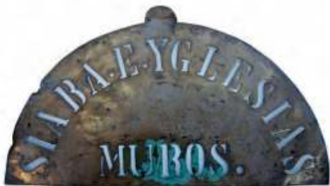
Peza de latón utilizada para marcar os tabais co logo de Siaba e Iglesias

“... que se obligan con sus personas y bienes que tienen y tuvieren, así muebles como raíces, de pagar a la Hacienda Nacional y en su nombre al señor Administrador Recaudador de Rentas de esta nominada villa el importe de la sal que en la presente cosecha, y más sucesivas, saquen y les sean entregadas en los alfolís de esta referida villa para salazón