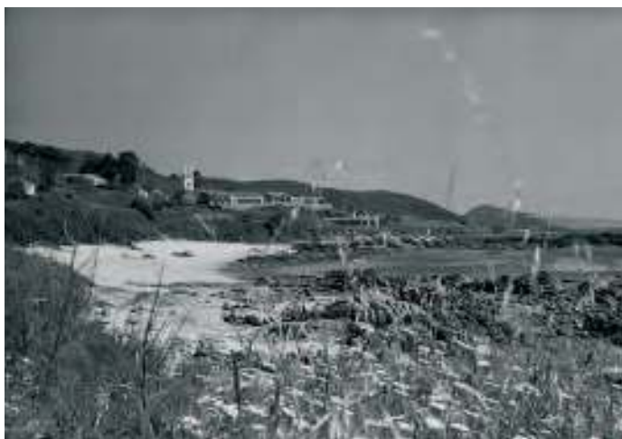
A Area dos Cans no 1984

Na Illa teñen feito moitos partes de afogados. Tiña que vir o médico de fóra a equí. Houbo un, que collín eu do mar, que veu a familia a chorar á Illa porque non lle querían fase-lo parte. E vai o médico, ábrelle a camisa e tiña un taghaso dunha puñalada. Daquela para un parte de defunción había que ter moita confianza. Se é de morte natural, xa o médico neghosia.