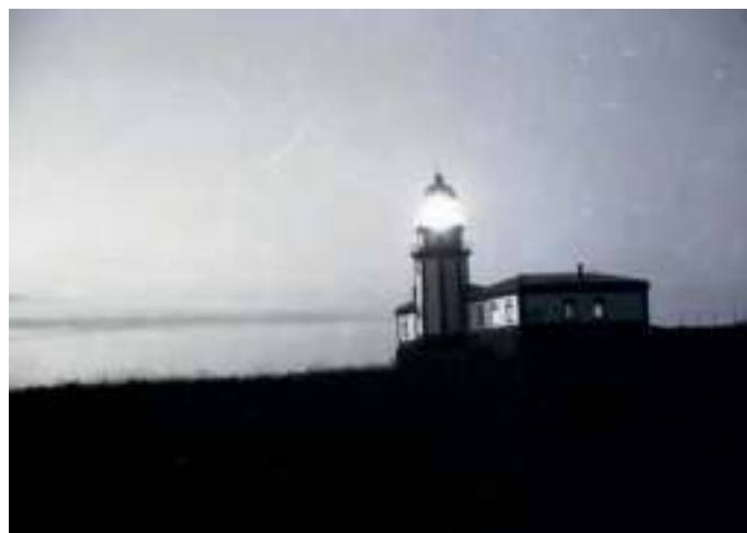
Faro da illa de Ons, 1989

porto, pero se hai unha nortada xa non defende. É un porto que entras polo norte, polo sur todo é pedra, levántase un pouco mar e hai que escapar-e. Ai! Eu teño escapado á unha da mañán e ás dose da noite da Illa no barco, eh, e non ser capás de saltar a bordo do barco co temporal! Moitos non deno saltado e quedano en terra. Pero había que vir pa Bueu con un ou dous que se apañen ben. E por iso a xente veu pa terra, porque non se paraba elí, escachaba os barcos, rompía todo. E o porto é malo e houbo que escapar da Illa, todo o mundo. Moito temporal tense aghan-tado, bah!