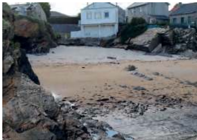
Areal do porto

O cazón pescábase coa arte do rasco. Rede dun pano só, de malla grande, rectangular, armada entre relingas de boias e chumbos. A pesca do cazón era un acto colectivo no que cada casa participaba. Cada familia