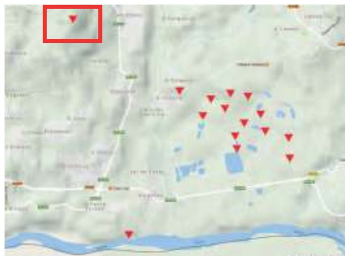
Situación do xacemento respecto dos lugares con achados coetáneos próximos

Xunto coas covas (Eirós, Valdavara...) e os asentamentos ao aire libre (Porto Maior, As Gándaras de Budiño...), os abrigos naturais como este do Penedo dos Ladróns ou o recentemente descuberto en Santa Lucía (Astariz, Castrelo de Miño) son hábitats prototípicos dos neanderthais arcaicos ao longo do Paleolítico Inferior, un período da prehistoria datable entre o 200.000 e os 300.000 anos antes do presente no que as únicas ferramentas dispoñibles eran as que lle proporcionaba a natureza, neste caso os cantos rodados das terrazas fluviais do Miño, un río que vertebra unha boa parte da vida humana do que hoxe é Galicia ao longo de toda prehistoria.