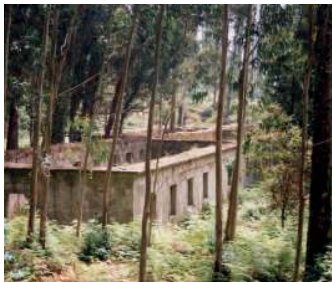
Os restos do mosteiro xorden entre a vexetación

Durante este ataque xorden dúas accións que pasarán á historia popular: unha, a aparición da imaxe da Virxe de Gracia (a ermida xa estaba baixo a súa advocación) que sería recollida polos mariñeiros de Combarro, que a entronizarían na capela da Renda e que aínda hoxe existe (unha reprodución da orixinal), e a conversión da auga da fonte de San Miguel en milagrosa por ter limpadado a súa espada o propio Drake (considerado como arquipirata polos veciños) des-