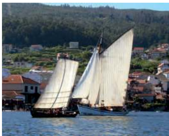
Barcos no mar de Poio, 2009 / Mjo Meneau