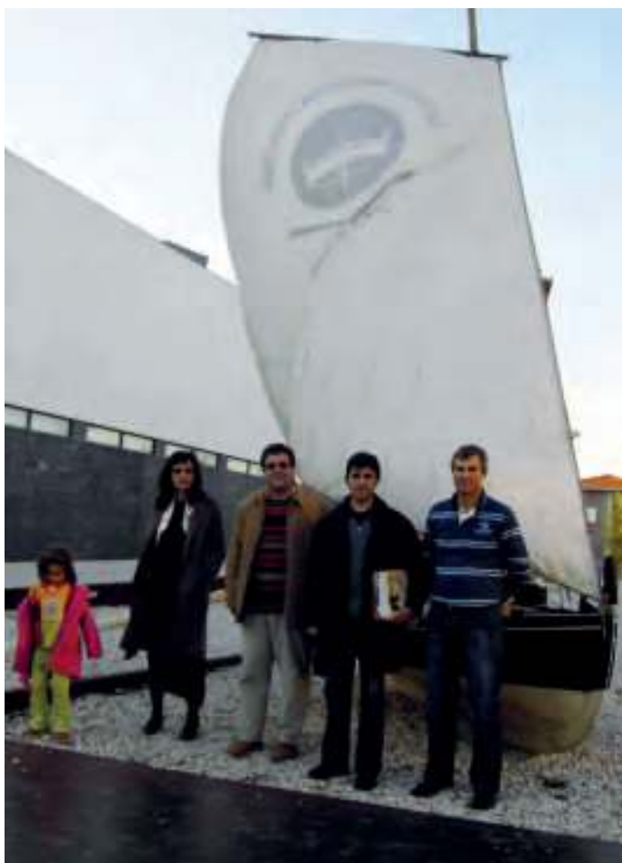
Presentando Ardentía no Museo de Ílhavo / Isabel G. Avión

O Encontro de Rianxo en 1999, organizado contra toda esperanza, serviu para reflatar a nave da Federación: clarificáronse obxectivos, ampliáronse progresivamente os efectivos humanos e corporativos (suman hoxe varias ducias as asociacións federadas, aínda que de peso e implantación moi variado), incorporouse a faceta fluvial, abriuse de xeito modélico amplo campo colaborativo con persoas e entidades do Norte de Portugal... Este rexurdir tamén acabaría tendo consecuencias no ámbito publicístico, pois logo