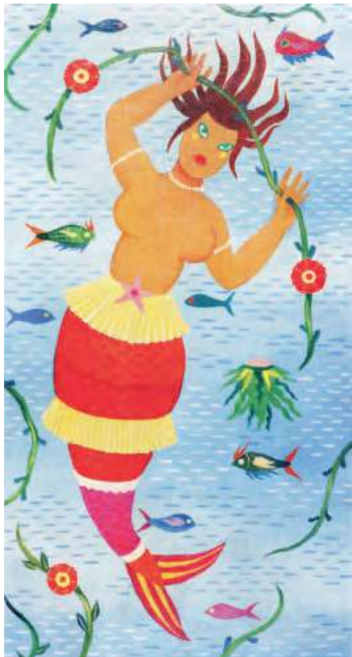
Serea rubia . Óleo sobre cartón. 1945. 50x25 cms.