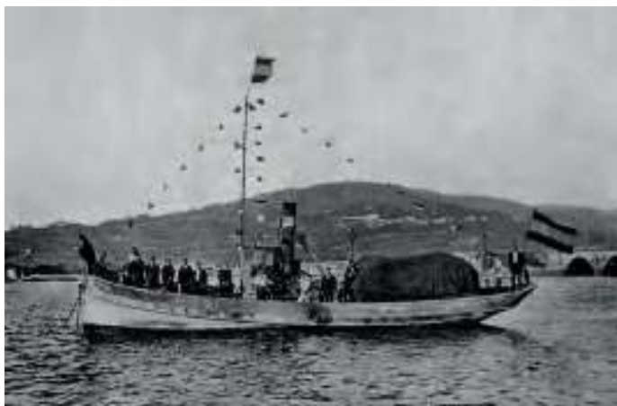
Tarrafa eumesa, 1920 / R. Santamaría, Diccionario de pesca

bía ser regulada polo ben de todos. E como magnífica proba disto pode citarse a clara conciencia dos mugardeses contra a utilización das artes de arrastre. Seguindo ao pé da letra as regulamentacións seculares de impedir o arrastre dentro das rías, solicitaron a extensión da prohibición aos caladoiros que eles visitaban. No 1889 un armador vigués armou a primeira parella de arrastre a vapor de Galiza. Tras ser expulsado das rías Baixas, probou fortuna no golfo Ártabro, encontrando unha rexa oposición nos pescadores. No arquivo municipal de Ferrol consérvase a correspondencia que os armadores dos faluchos e a veciñanza de Mugardos dirixiu ao ministro de Mariña, utilizando de correo ao capitán xeral do Departamento, solicitando a prohibición desas prácticas extractivas.