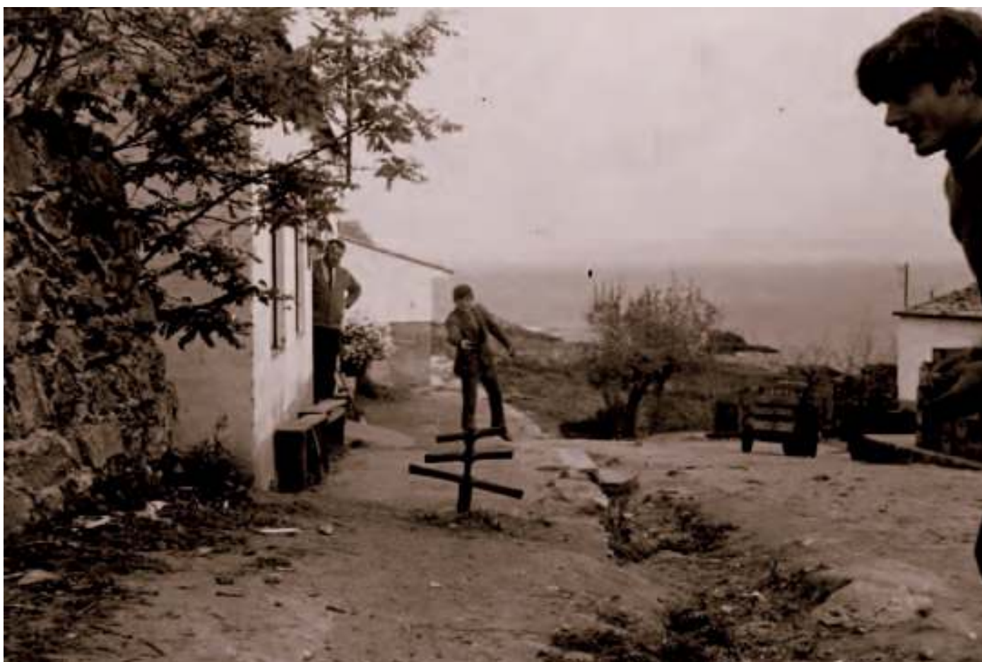
Xogando á chave en Curro, 1961

non miras. Pero se botas unha pedra cae no mar-e. Eu eí xa teño ido ca dorna, cando o mar está máis manso. Pero inda esí traballa moito a corrente. Porque é coma un brazo de mar que entra na terra e dás entrado adentro, non moito adentro pero algo inda si. Acordo unha ves que un alumno da Escola Naval de Marín caeu. Tanto se quixo meter que caeu abaixo e non apareseu. Non sei se o pañano despois, non sei, pero era difísil.