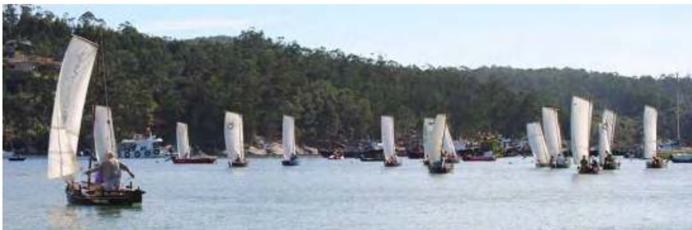
Um mar de velas / S. Rei

Feliz día da Lamprea! Mil festas da lamprea e mil primaveras máis para o Cesures mariñeiro! E abramos-la fiestra para ve-lo Ulla, para ve-las dornas, os mecos e os galeóns. Abrámos-la fiestra para ve-lo mar.