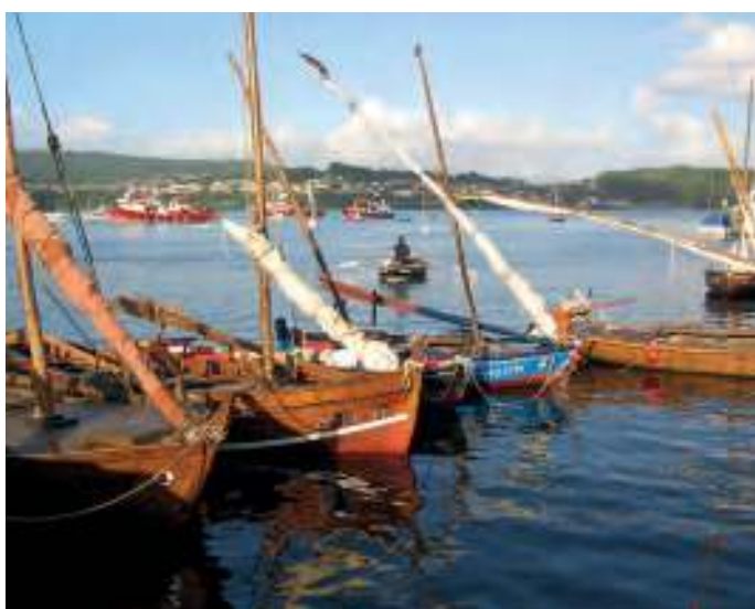
Naves amarradas, nunha imaxe de 2004