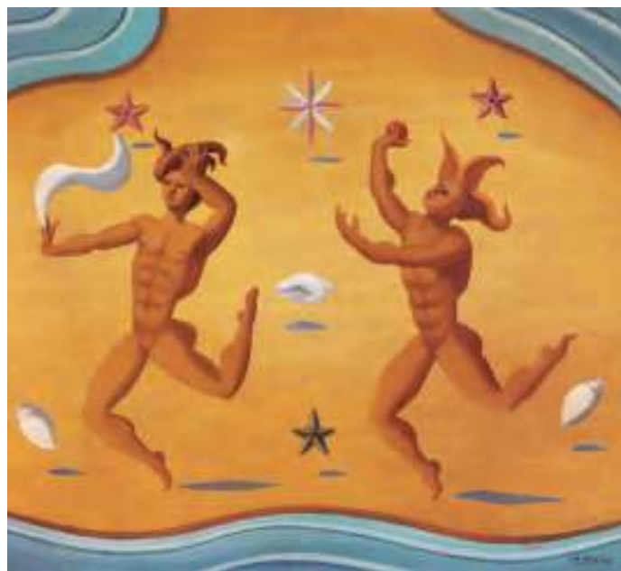
Atletas na praia. Óleo sobre cartón. 40x50 cm. 1959

En paralelo van nacendo outras series, como “Retratos bidimensionais” ou “Cabezas de mujer”, entre 1941 e 1951, “Gatos” e “Gallos”, entre 1943-44, e “Máscaras”, que comezou en 1943. Os murais que deseña e pinta en 1945 para o vestíbulo do cinema Los Ángeles, dos arquitectos López Chas e Zemorain, levan