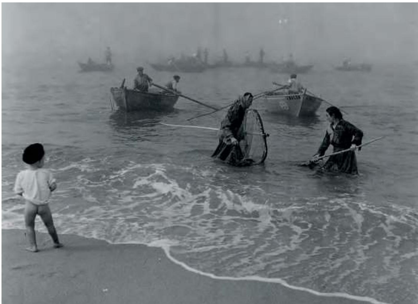
Imagem antiga de recolhida de sargaço desde mar e terra

As gerações atuais participam neste processo, como protagonistas ou como testemunhas dessa atividade. Mas a construção do discurso identitário para o qual os campos agrícolas e as “paisagens” são também objetos a valorizar, tanto ou mais do que os artefactos, com destaque para as paisagens do sargaço, que sendo palco dos protagonistas do passado, está ainda suficientemente próximo das pessoas que as usaram recentemente (avós e bisavós), motivo para ser espaço de partilha de memórias e de referências. É neste equilíbrio que se constrói o alicerce da identidade cultural das Paisagens do Sargaço no Norte de Portugal.