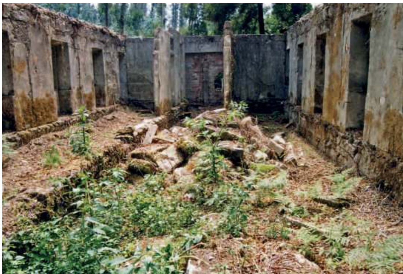
O interior do antigo edificio do lazareto

dos seus cidadáns, remitía un curioso escrito a “Su Majestad la Reina Doña María Cristina” no que expoñía os seus puntos de vista sobre a próxima instalación dun lazareto en augas do sur de Galicia, argumentando as dificultades de San Simón e San Xulián: “ pues bien Señora; la naturaleza próvida ha provisto ya la