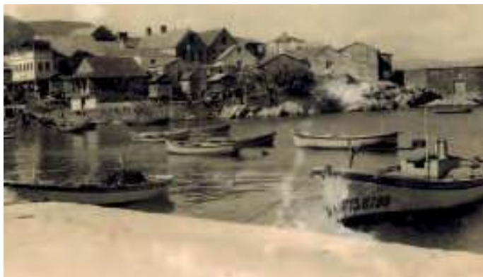
Barcos en Combarro, entre a vela e o motor, 1955