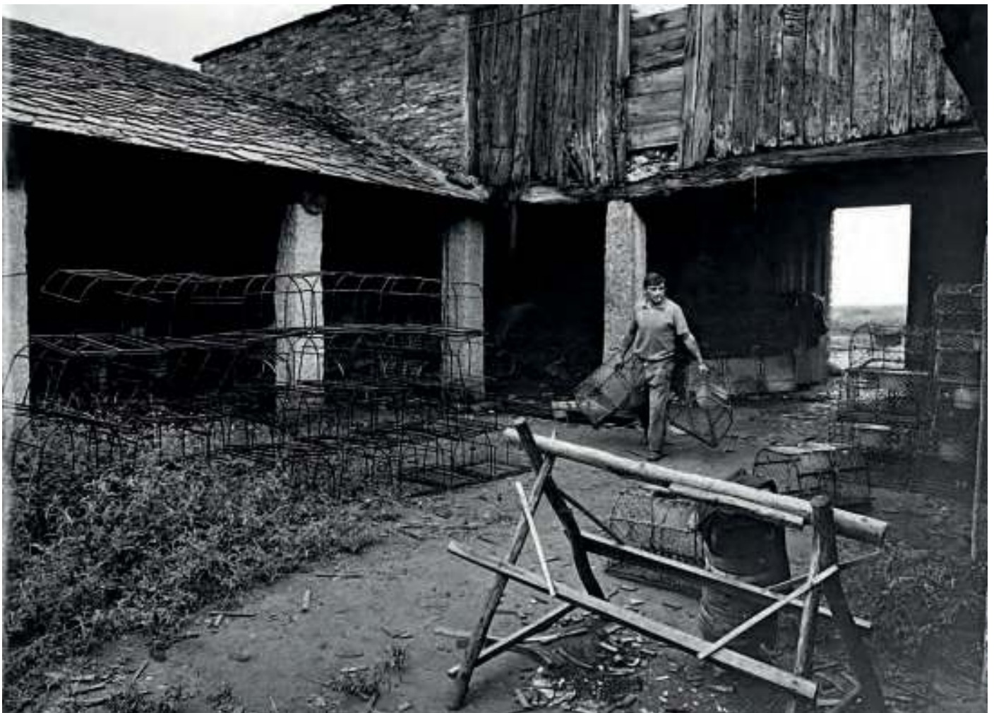
Interior da fábrica vella / Arquivo Manolo da Barrosa

Auxía s. f. Máis frecuente no seu uso en plural. As auxías son unha especie de carreiros que se forman polo