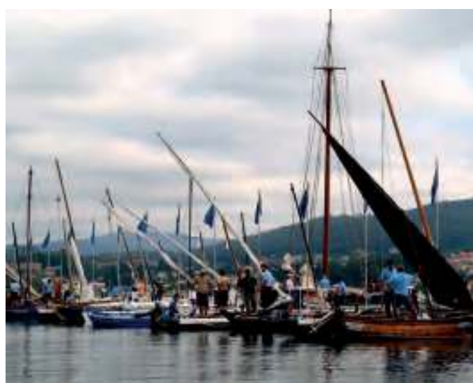
O peirao, ategado de embarcacións