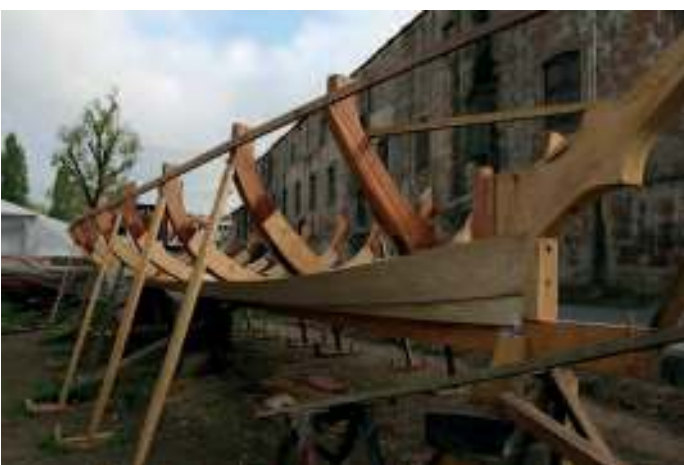
Duas imagens do estaleiro Socrenaval Ltda.

As embarcações de pesca longínqua seguiram o mesmo rumo ficando inativas. Extintas em quase todos os grandes portos.