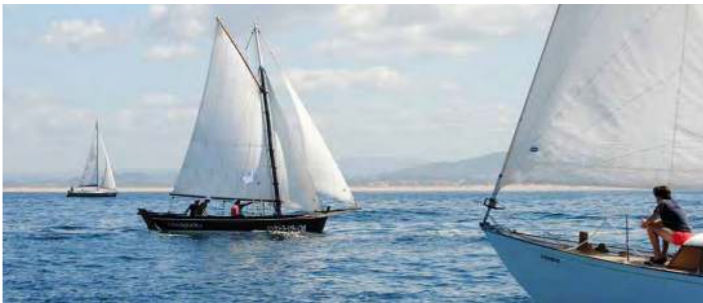
Navegando coa praia da Lanzada ao fondo / S. Rei