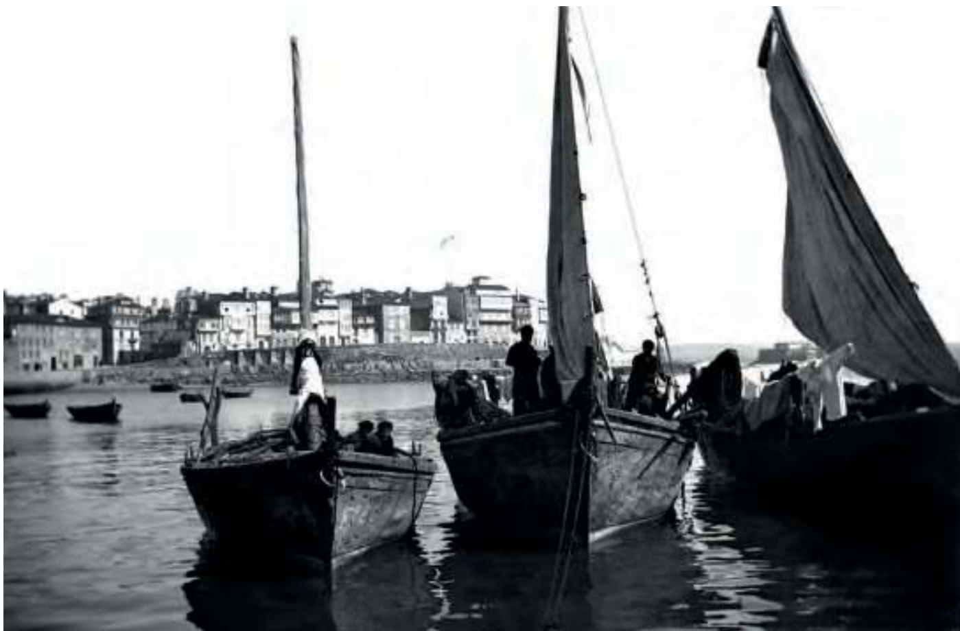
Galeóns e lanchas do xeito, nunha imaxe de 1890, aproximadamente

No 1898, tras da derrota militar e a repatriación dos superviventes, os pescadores tradicionais encontráronse con que os conserveiros e salgadeiros preferían seguir fornecéndose das novas unidades, polo que quedaron sen os mellores clientes. Comezaron as protestas e a 2ª guerra pola sardiña, que nas rías Baixas foi extraordinariamente dura e no golfo Ártabro estivo mediatizada polo posicionamento inequívoco dos políticos monárquicos da quenda, a prol do método industrial. Tanto o marqués de Figueroa, do partido conservador, como Juan Fernández Latorre, do partido liberal e os xornais afíns, respectivamente El Noroeste e La Voz de Galicia , deron as costas ás reivindicacións maioritarias e facilitaron a imposición dunha lexislación que violaba os principios seculares da cultura mariñeira tradicional. Na baixura e na altura, tanto nas rías como nos caladoiros da plataforma. Pode dicirse que unhas poucas persoas alleas ao sector decidiron apostar e impoñer unha nova relación