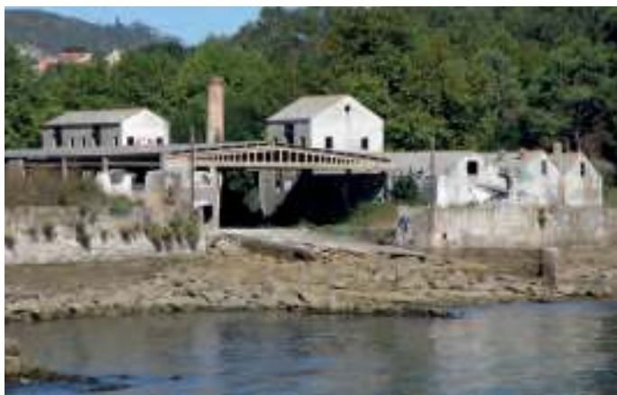
Instalacións no concello de Cangas

Uns meses antes, en xuño, a compañía tamén norueguesa “A/S Corona” fondeaba na enseada de Barra, ao norte da ría de Vigo, un buque factoría, bautizado como Rey Alfonso mentres operou en España, e constituía o 4