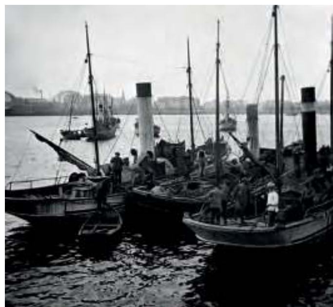
Vaporinos, 1908, aproximadamente/ Arquivo do Reino de Galicia

Cen anos despois, a salvación das rías pasa por salvagardalas da contaminación e decláralas santuarios onde reintroducir paseniñamente a pesca artesanal. Hoxe pode ser útil lembrar que ese proceso de destrución non era inevitable, senón que foi consciente e intencionado, que a imposición dunha lexislación que violaba os principios da cultura mariñeira tradicional foi posíbel pola cobertura dunha ideoloxía que, tras da bandeira de civilización e progreso, animaba á explotación descontrolada dos recursos, e que houbo persoas e poderes que miraron só por uns beneficios particulares e ignoraron o tremendo custe social e natural que provocaban. E, sobre todo, que só foi posíbel polo silenciamento e marxinação dos que sabían que era o camiño equivocado.