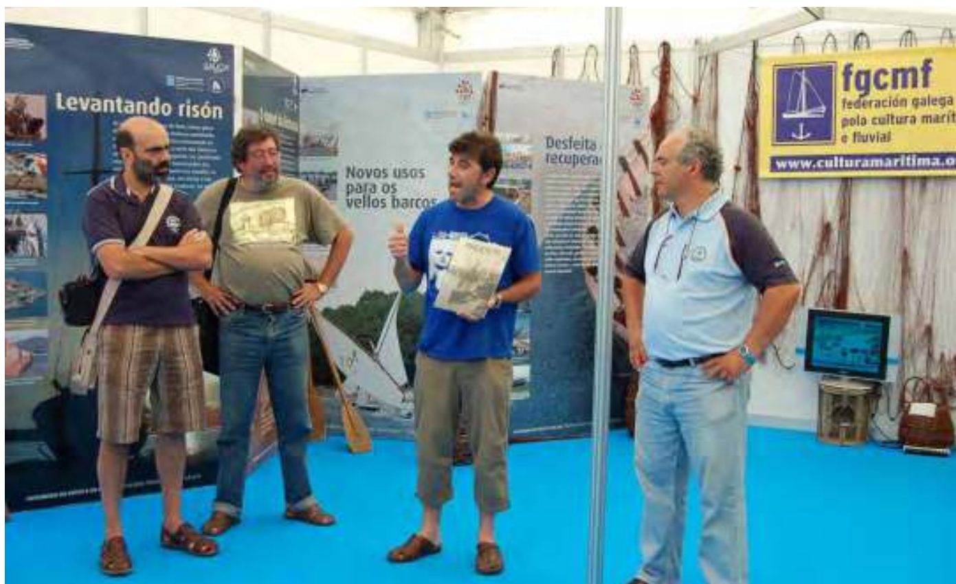
Un momento da presentación de Ardentía realizada durante o Encontro de Embarcacións Tradicionais de Muros