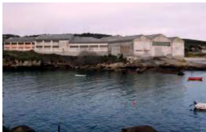
Instalacións de Morás

Na reunión anual da Comisión Baleeira Internacional de 1982 en Brighton (Reino Unido), acordábase o establecemento dende o 1 de xaneiro de 1986 dunha moratoria que suporía o final da actividade baleeira en Galicia, e por ende, das últimas factorías baleeiras europeas, tralo peche da de Skjelnan (Noruega)