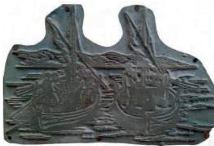
Troquel co logo de Muradana para marcar os tabais da familia Portals