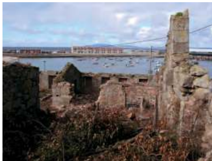
Restos da salgadura de Artaza