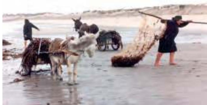
Trabalhos do sargaço na Apúlia, 1990

de, particularmente a zona de Apúlia, a sul, encostada à vizinha Aguçadora (Póvoa de Varzim) desenvolveu uma intensa e bem organizada agricultura do sargaço, influenciando as terras vizinhas, quer litorais quer interiores, mobilizando Fão, Fonte Boa e Rio Tinto, na margem sul do Cávado, e Marinhas, S. Bartolomeu, Belinho, Antas e Forjães na margem norte. O interesse pelo sargaço como fertilizante agrícola para a grande região de Barcelos, principal consumidora deste produto para o concelho de Esposende, prende-se com a agricultura do milho, da batata e da cebola, modelo que manteve até os anos de 1960 a tradição da venda dos excedentes, pois depois de seco e bem arejado, o excedente do sargaço em cada casa agrícola era destinado a ser vendido, pelo melhor preço, assumido o preço ao volume em “carradas” (uma carga em carro de bois munido de uma antepara em vime, formando um cesto ao tamanho do leito do carro, também dito “canada”).