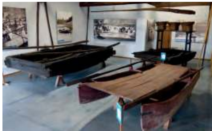
Fondos expostos no Ecomuseo de Arxeriz

Nesta sala hai un importante espazo adicado a recuperar a memoria dos 32 lugares mergullados polos encoros de Os Peares e Belesar, entre eles unha vila con moita historia como Portomarín, algúns como Sernande, Porto, Seixón ou Ferreiroá, grandes aldeas moi dinámicas socioeconomicamente, e, a meirande parte, pequenos lugares de un a seis veciños que bulían arredor das actividades xeradas na contorna do río. As súas xentes, vidas e facendas quedaron truncadas pola subida das augas que puxeron fin a un modo de vida. As fotografías de lugares, a súa localización e nomes axudan a lembrar o noso pasado recente e a fonda pegada que o progreso deixa na historia.