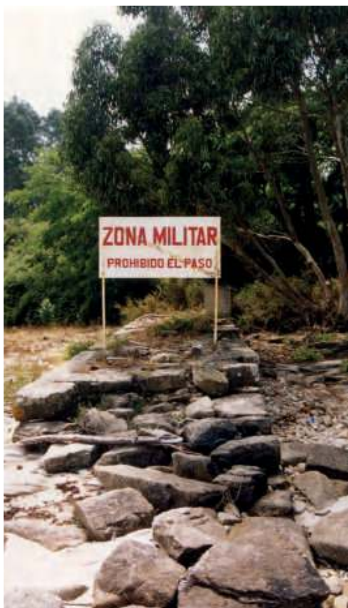
Cartel na illa de Tambo