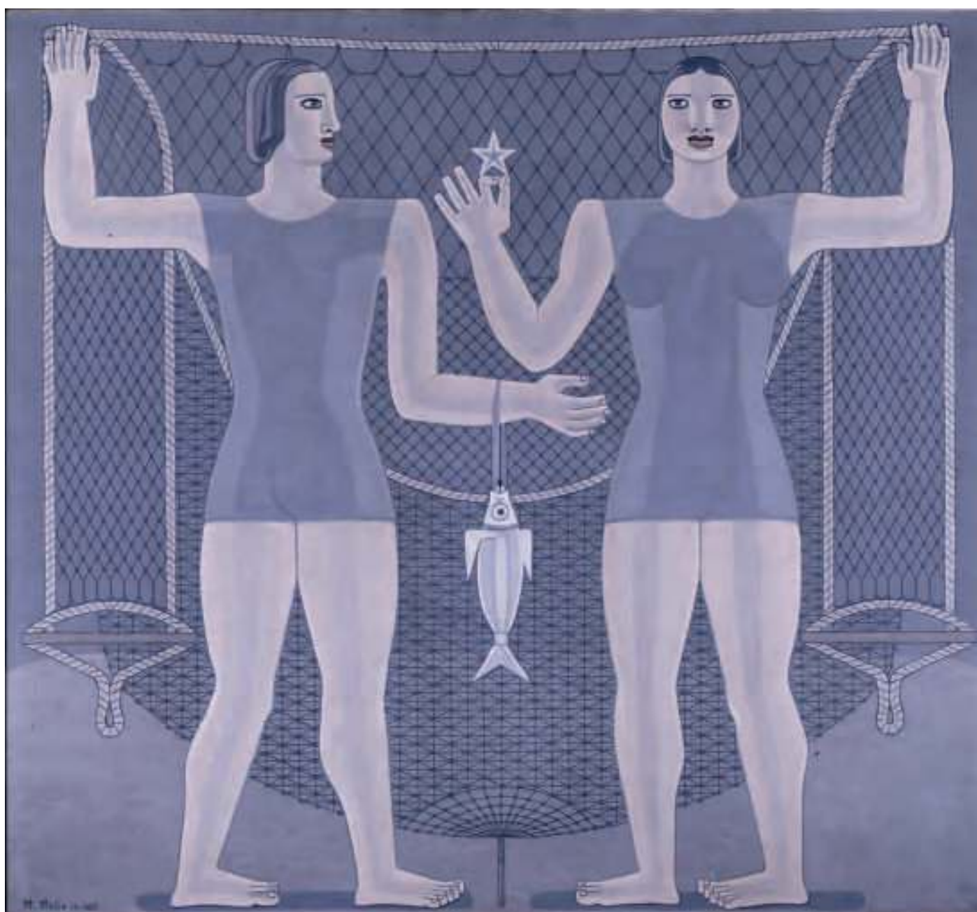
Estrelamar . Óleo sobre lenzo. 1937