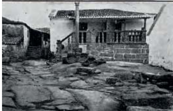
Combarro no número 241 da revista Vida Gallega , 1924