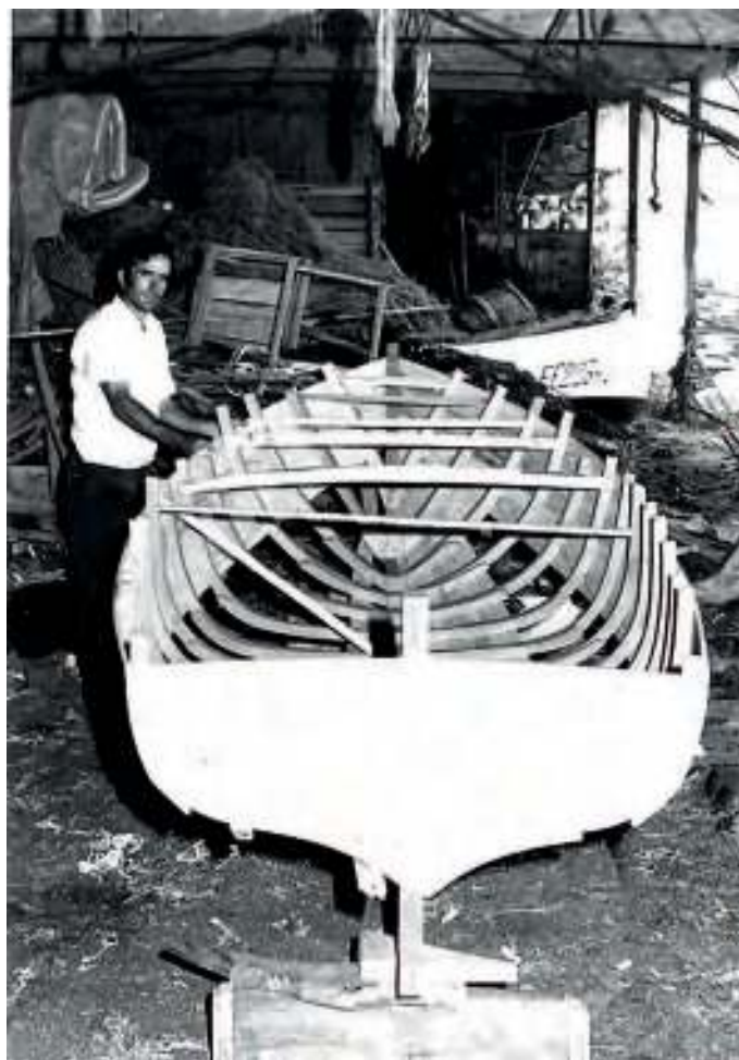
Interior da fábrica nova

Grade s. f. Estrela de mar. Equinodermo da clase dos asteroideos ( Asterias rubens ) do que existen diversas