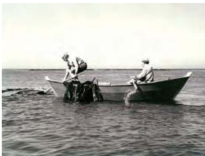
A atividade do sargaço influenciava a própria pesca

A atividade de Sargaço constituía uma “faina” de carácter agrícola, com um ciclo de vida próprio, que ocorria na época quente, de Maio a Setembro, e que obrigava a recursos próprios, sendo desempenhada por lavradores abastados que recrutavam para o trabalho da apanha do sargaço outras pessoas (criadagem e jornaleiros).