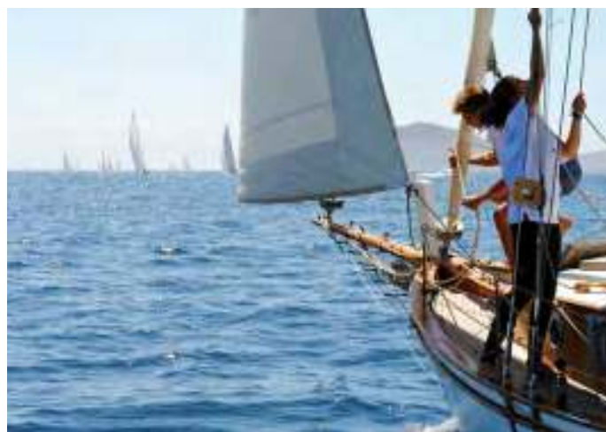
Tripulantes da dorna Sara O. na Regata Illas Atlánticas 2016