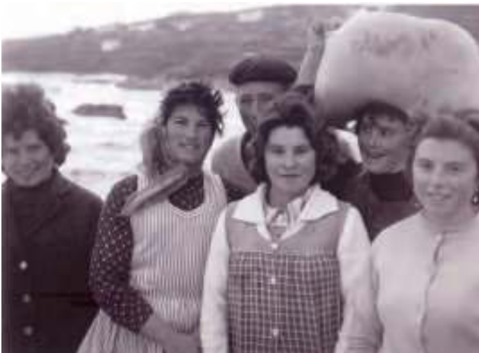
Mulleres carrexando millo, 1960

Despois había algunha ghamela, cando foi dos barcos. Pero a ghamela non é ighual de boa porque non se aghanta, vaise. Déixa-los remos e xa voa. Pero a dorna aghanta, porque ten moito calado, non sabes?, e aghántase, cunha man xa aghanta. A dorna, anque