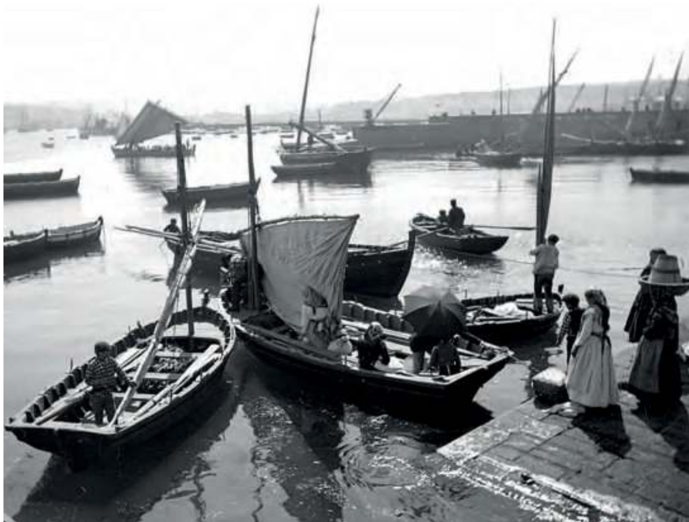
Rampa do peixe no ano 1900

As Guerras de Cuba, Puerto Rico e Filipinas mobilizaron a uns 250.000 mozos peninsulares que, segundo as previsións dos mandos, tiñan no rancho, varios días da semana, unha ración de sardiñas salgadas ou en conserva. O resto dos días tocáballes touciño. Na práctica, a cada un foille segundo a sorte que tivese, dándose o caso de que houbo alarma social pola fame