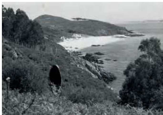
Praia de Melide e O Centulo, 1984

Despois diso, viñemos pa Bueu. Debeu ser alá polo ano sesenta e oito, porque no sesenta examineime eu