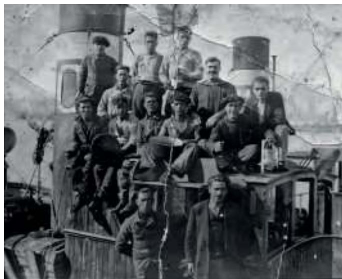
Tripulación parella de arrastre Mardomingo n°5

Mentres, os mariñeiros da Costa da Morte, acosados polas motoras das rías Baixas e polas tarrafas ártabras, solicitaron a prohibición do seu uso nas súas augas. Entón o goberno ordenou unha misión científica ó Instituto Oceanográfico que dirixiu o seu director, Odón de Buen. Realizada no verán de 1916 concluíu cun informe favorábel ás tarrafas e o cerco con xareta. Daquela quedou desautorizada toda oposición.