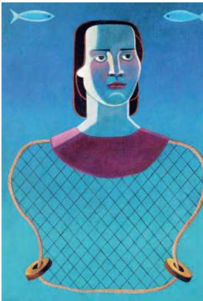
Cabeza de muller con rede. Óleo sobre cartón. 50x35 cm.