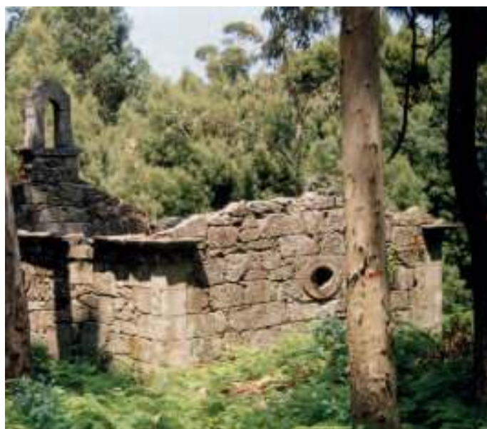
Ruinas da ermida

Na súa viaxe a Galicia efectuada ó longo do ano 1745, Sarmiento aborda a illa de Tambo o nove de setembro, quedando fascinado da feracidade do seu solo e describindo unha serie de plantas das que, segundo documentos do seu puño e letra, dicía: “en lo que anduve de la isla vi muchas plantas que no había vis-