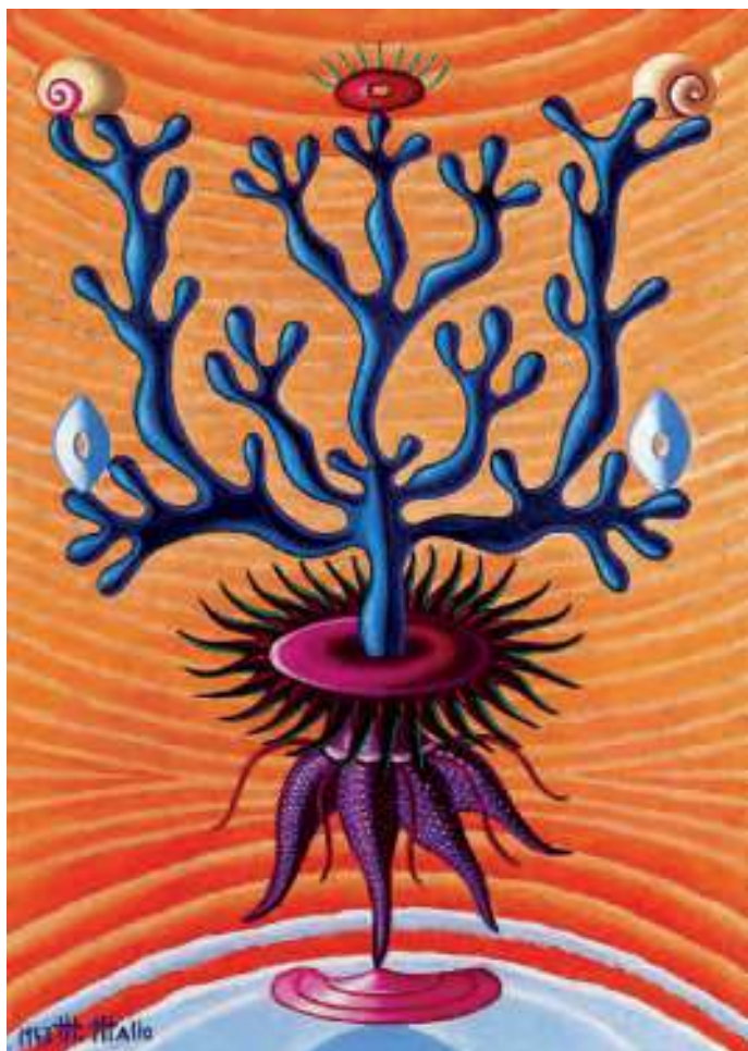
Natureza viva; vida vibrante Óleo sobre táboa. 1943