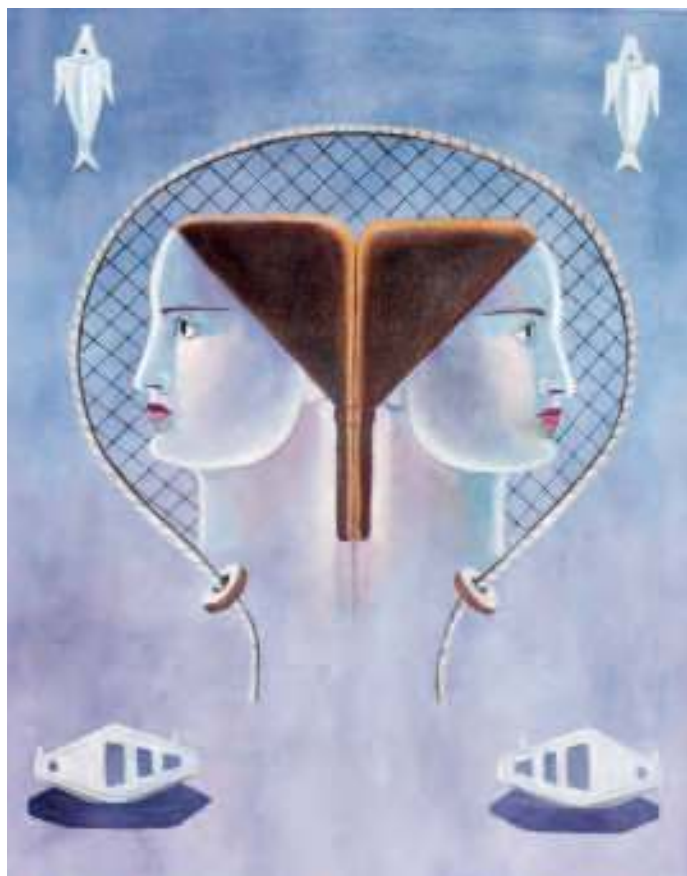
Mulleres e rede. Óleo sobre táboa. 48x40 cm.

presa del trigo”, “El canto de las espigas”) e o resto mariñeiros, entre os que destaca “Mensaje del mar”.