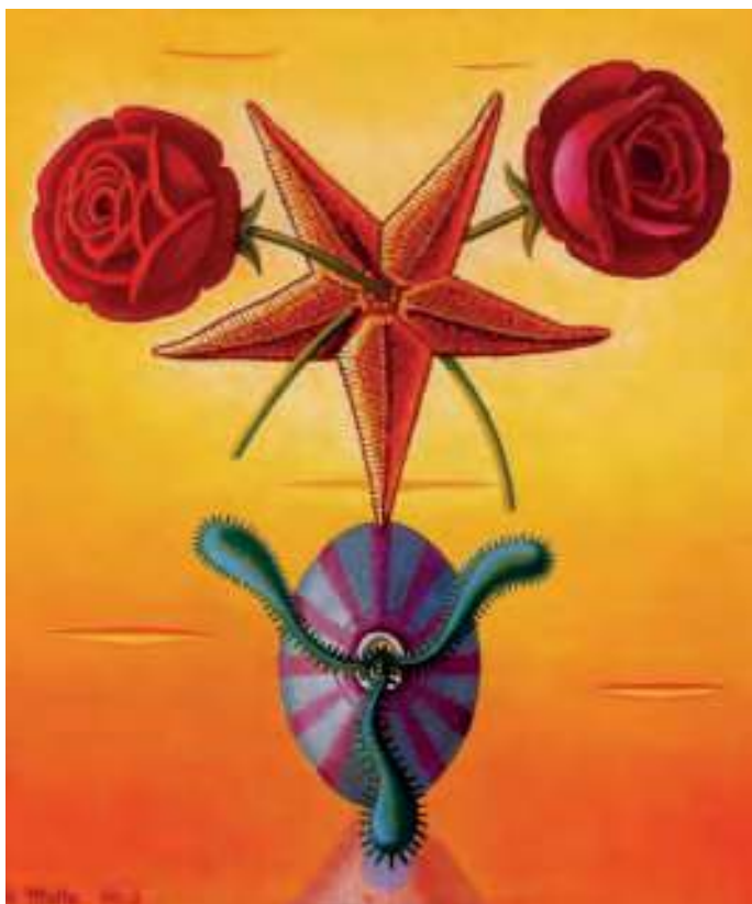
Natureza viva. 1943

Dado que seu pai, madrileño, era oficial de alfándega e andaba de destino en destino escalafón arriba, Maruja naceu casualmente no Viveiro cantábrico e pasou a infancia (1904-1912) cuns seus tíos (Ramiro Lorenzo e Juliana Lastres Carrera) entre a ría de Corcubión, o monte Pindo e o mar do Orzán coruñés. Os mares e rías de Galiza deixaron, pois, unha primeira imprompta de beleza e grandiosidade no seu espírito tan sensíbel como inquedo.