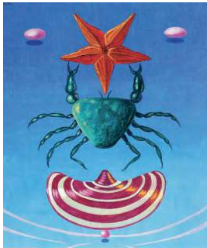
Natureza viva. Óleo sobre táboa. 32,5x29,5 cm.

A relación sentimental que mantén en 1936 co sindicalista e militante trostkista galego Alberto Fernández Mezquita fai que pase uns días en Beluso (Bueu), na compañía do xornalista e alcalde galeguista Johán Carballeira . Maruja realiza entón multitude de debuxos e bocexos a lapis de barcos, nasas, redes e rostros que lle han servir tempo despois, xa exiliada na Arxentina, para a elaboración da serie pictórica La religión del trabajo, en el mar y en la tierra , composta por 7 óleos de grande tamaño, 2 deles labregos (“Sor-