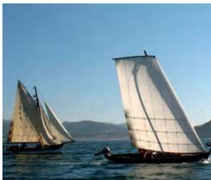
Barcos no mar de Poio, no 2009 / Mjo Meneau