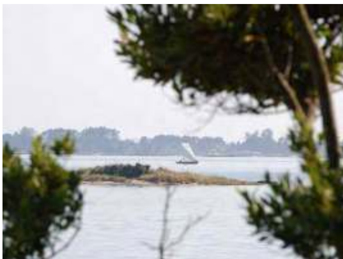
Vista desde a illa de Cortegada