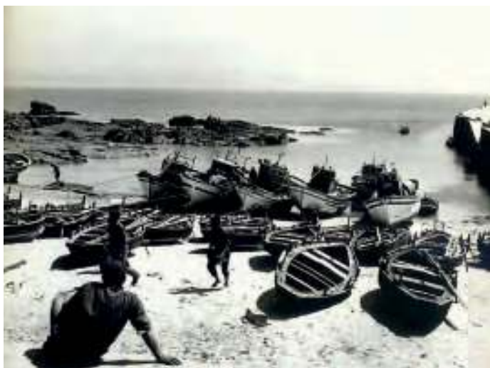
Praia de Curro, 1963

velas tamén todas alá, que equí non había quen fixera unha vela, eh. Vouche a disir, a dorna boa pa ardora custaba corenta e sinco pesos, eh! Todo, vela e dorna. E logho! Fixemos unha, a dorna ghrande nosa, porque tiñamos unha compañía, canda un carpinteiro bo, Don Radán, e valeu sento des pesos, a ghrande, de quinse cuartas. Si, ho! Era pa vir á terra. Sento des pesos! De vela eran corenta ou cincuenta metros, si. Nunha pequena, a marca de vela era trese varas e media, catorse xa pa unha dorna de oito cuartas. Pero o tamaño de vela dunha dorna polbeira son trese varas e media. Daquela era en varas, coma metros, non sabes?