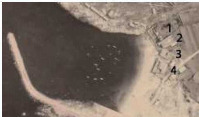
Fotografía aérea coas localizacións das catro salgaduras de Portocubelo

O seu primeiro propietario e probable construtor foi o veciño de Lira Francisco López, quen tivo que ser un empresario moi importante na bisbarra a mediados do século XIX. Amais das abundantes escrituras