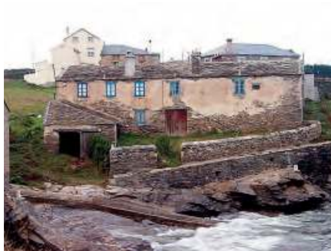
Ruínas da fábrica nova antes de ser restaurada

Se por un casual nalgunha das redes que tiña a marca dunha casa non mallaba ningún peixe, quedaba sen quiñón, aínda que isto era, certamente, moi raro. É tamén neste período cando hai dúas fábricas dedicadas ó salgado e prensado da sardiña -o arenque-... Tamén xurelo e chicharro... A Fábrica e a Fábrica Vella. As dúas tiñan, e teñen, varios píos -oito polo menos- grandes e fondos onde facían a salmoira... Un patio central aberto e na fronte unha ou dúas vivendas. Todo o proceso se facía nelas... Desde a salga, o prensado e envasado, ata a comercialización... Aínda hai na parroquia a casa do Toneleiro, descendente, de