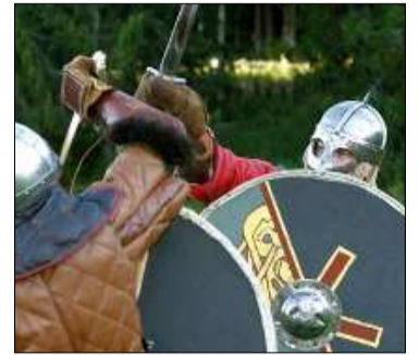
HANTVERK. Hirdmännen eller kanske -kvinnorna har sköldar som de målat själva. På dem finns bland annat runan för h och en bild av krigsguden Tyr.

En vikingaby är ingen riktig vikingaby om den inte har en hird – enligt ordboken en härskares personliga skara av krigare eller huskarlar. Det ansåg fornföreningen Fibula på Åland, som arrangerar en årlig vikingamarknad på Åland, och lyckades inspirera några unga män att lära sig att slåss med sköldar och svärd.