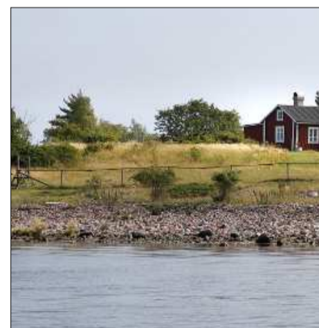
↑↑ Ö I HAVET. Huvudön eller hemlandet i Björkörs naturreservat. Ungefär mitt på ön ses huvudbyggnaden där öns sista invånare bodde till 1961.