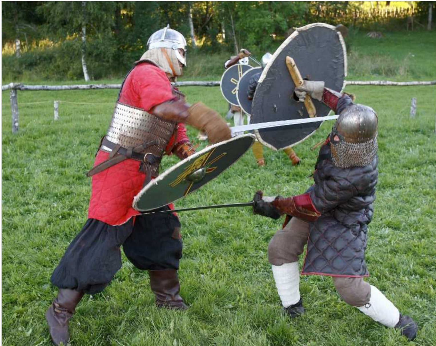
UTRUSTADE. När det blir riktigt tuffa närkamper klär sig hirdmännen i hjälmar och vadderade jackor.