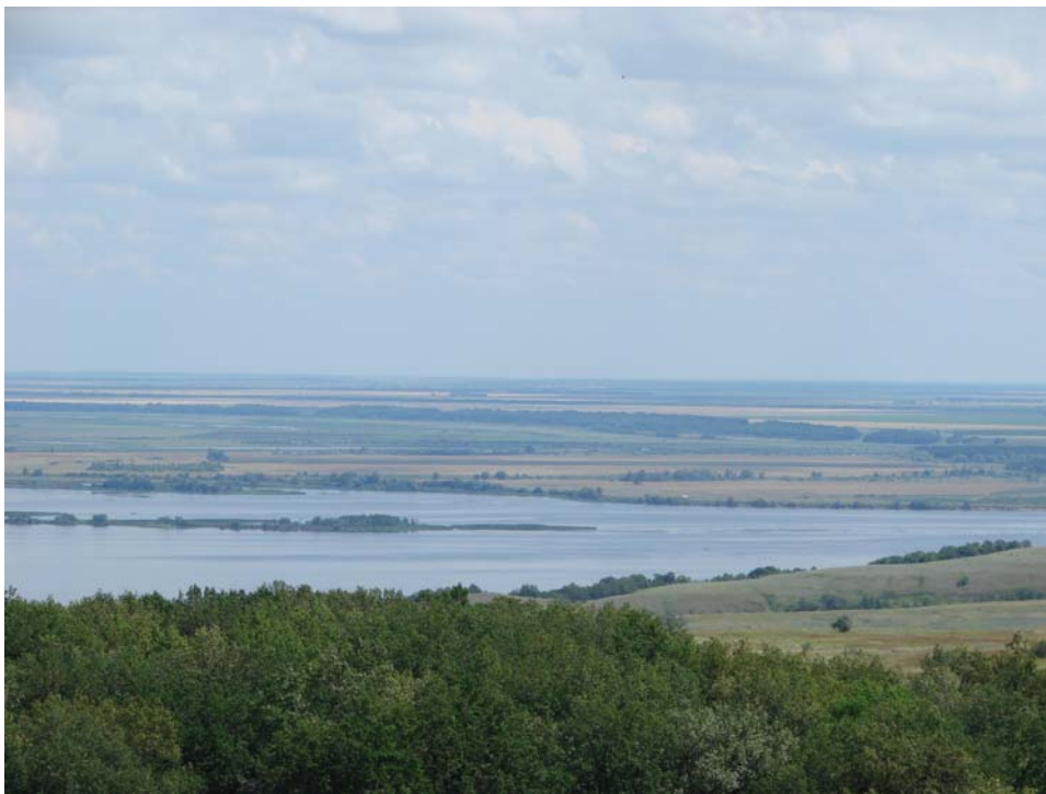
Рис. 2. Общий вид Екатерининского флористического подрайона Волго-Иргизского ландшафтного района (с правого берега Волги – г. Форфос)

во прудов-водохранилищ, наполняющихся преимущественно за счет талых снеговых вод. К искусственно созданным водоемам также относятся оросительные каналы. Протяженность Куйбышевский оросительно-обводнительного канала по исследуемой территории – более 80 км, а Саратовского оросительного канала – более 40 км.