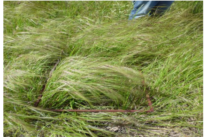
Figura 3. Pajonal-flechillar de Nassella neesiana con alta cobertura en el flanco inferior de la loma.

Pajonal-Flechillar de Nassella neesiana : i) Flanco inferior: El pajonal del flanco inferior de la loma está integrado en forma exclusiva por las matas de N. neesiana (G6) (Fig. 3).