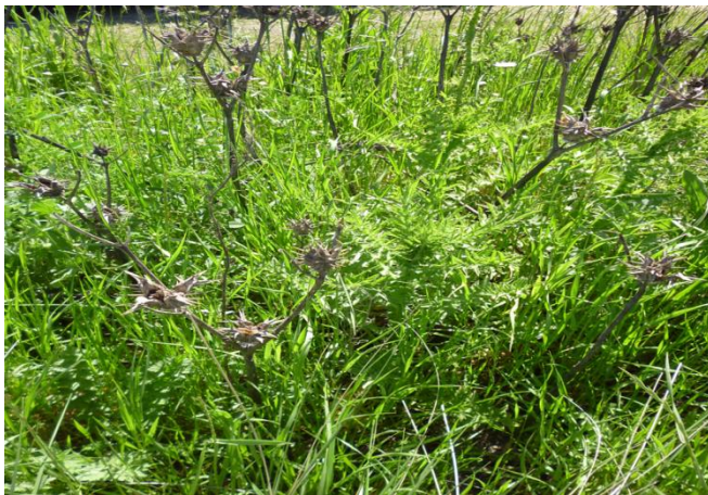
Figura 7. Stand de vegetación en la franja cortafuegos, situado en la cresta de la loma.

Franja cortafuego: En el mes de marzo de 2011 a causa de la labranza de la FCF en la primavera del año anterior, se pudo observar la dominancia de Datura ferox (chamico) en toda la FCF, en un gradiente de abundancia-cobertura decreciente desde la cresta al flanco inferior de la loma. En el relevamiento de noviembre de 2011 las plantas senescentes de chamico sólo presentaban sus órganos reproductivos maduros. En esta fecha se puso de manifiesto un aumento de la riqueza florística respecto del estado anterior: cresta de loma (R=9), flanco superior (R=6) y flanco inferior (R=21). En la primavera, la FCF presentó la mayor riqueza florística con 33 especies (89% de la riqueza total). i) Cresta: En este microambiente, donde el año anterior el chamico había alcanzado la mayor cobertura como única especie, aumentó la riqueza florística representada por especies de los grupos florísticos 4, 5 y 8 (Fig. 7). ii) Flanco superior: El stand estuvo representado por especies de los grupos florísticos 5 y 8, algunas de ellas también presentes en los espacios intermatas de ésta subunidad de paisaje. iii) Flanco inferior: Dominan las especies del grupo florístico 7 que alternan con algunas especies también presentes en los espacios intermatas. De esta manera, se alcanza la mayor riqueza florística.