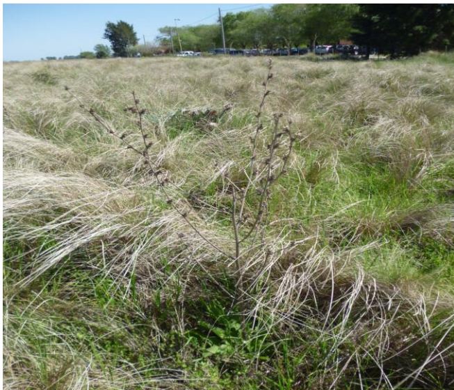
Figura 2. Pajonal-flechillar de Nassella brachychaetoides e intermatas en cresta y flanco superior de la loma.

Pajonal-Flechillar de Nassella brachychaetoides : i) Cresta: El pajonal-flechillar, ocupa la cresta y flancos de loma, alcanzando mayor cobertura en las crestas. En la cresta dominan en forma exclusiva las matas de N. brachychaetoides (G1) con importante acumulación de broza, la cual dificulta la germinación de otras especies, por falta de luz (Fig. 2).