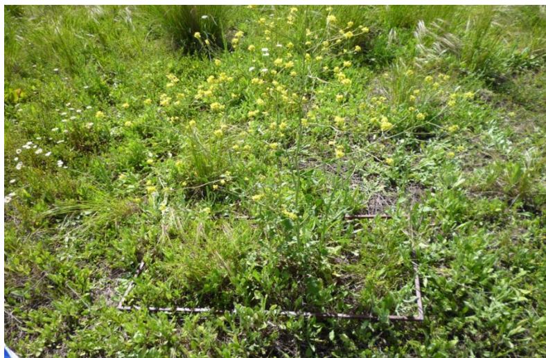
Figura 6. Intermata en el flanco inferior de la loma.