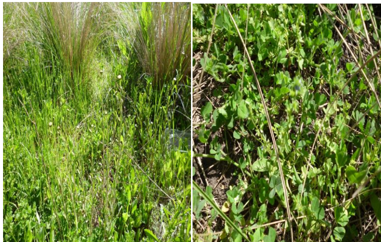
Figura 5. Intermata en el flanco superior de la loma. Izquierda: estrato superior dominado por Leucanthemum vulgare ; derecha: estrato inferior de vegetación integrado por algunas especies de hábito de crecimiento rastrero del grupo funcional 3.