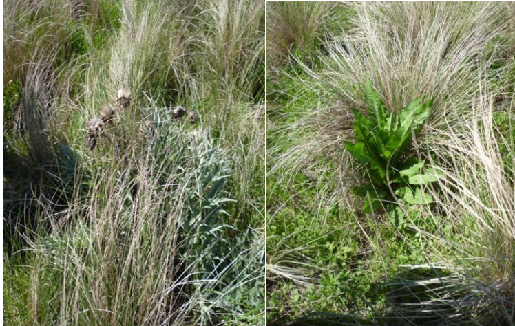
Figura 4. Pajonal flanco superior plantas de Cynara cardunculus (izquierda) y de Dipsacus fullonum emergen de los bordes de las matas de paja (derecha).