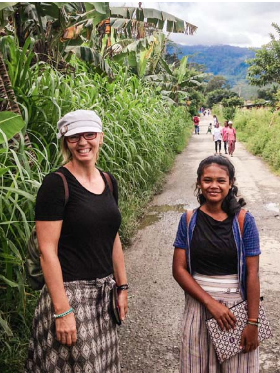
Tozali kosakola na Gleno, na Timor-Oriental

Nakómaki kosala boninga ná bato ya mbula nyonso na lisangá oyo bazalaki kosala nyonso na mosala ya Yehova, mpe