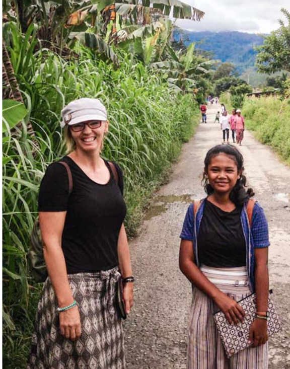
Tozali kosakola na Gleno, na Timor-Oriental

makasi ntango bamonaki nazali kolongwa na ndako. Yango etungisaki bango mingi, kasi bakanisaki ete nakokoba kosalela Yehova.