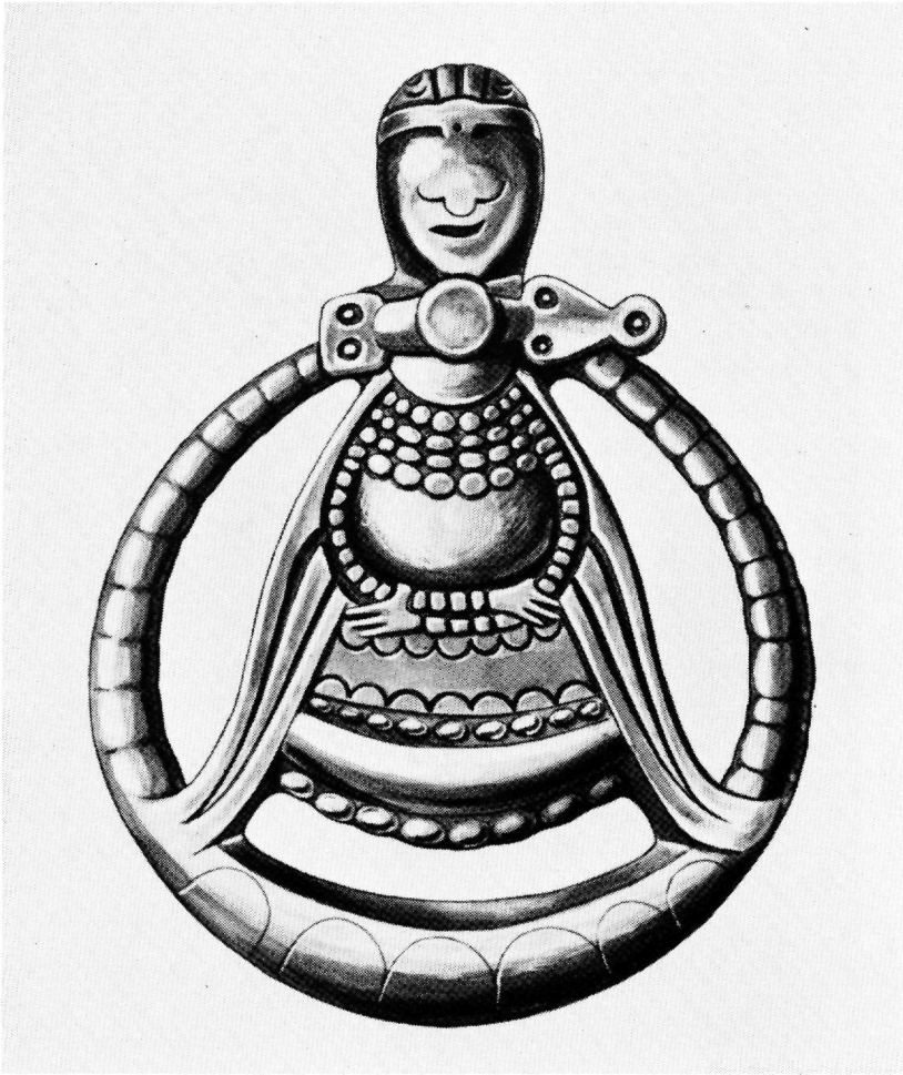
Fig. 1. Hængesmykke fra Hagebyhöga, Östergötland. 3:1

viser en mand og en kvinde, der synes at komme hinanden i møde eller at omfavne hinanden; og på en del af dem har kvinden i den ene hånd en genstand, der må tolkes som en kvist. Det må være nærliggende at tænke på frugtbarhedskult.