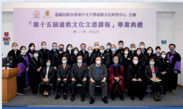
第十五屆道教文化文憑課程 (2021-2022) 畢業學員合照