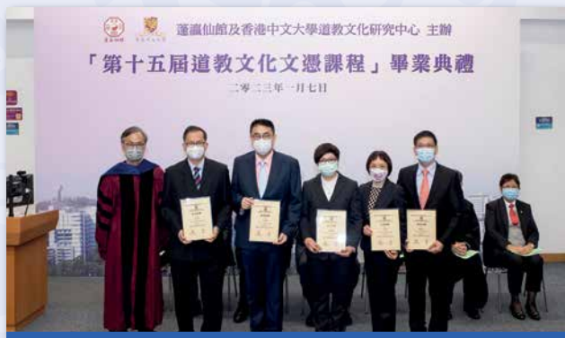
道教文化課程校友會第六屆 (2022-2025) 常務委員合照