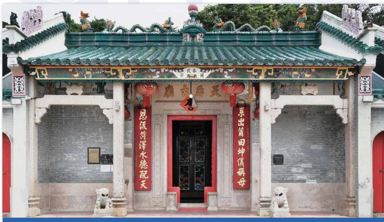
西貢佛堂門天后古廟

由於明末遺臣鄭成功（1624-1662）退駐沿海，為了斷絕鄭氏軍隊從沿海居民獲得接濟，清政府於順治十八年（1661）八月頒佈「遷海令」，強令沿海地區居民遷往內陸二十里至五十里不等。廣東沿海一帶，則遷地五十里。 8) 康熙元年（1662），新安縣三分二的土地被遷，併入東莞；香港全境及鄰近各島也不例外，居民被迫放棄家園田地，流徙內陸他鄉。 9) 由於官方執法甚嚴，新界宗族鄉村受到很大打擊，人口盡數迫遷內陸，盡棄家園田地，流離失所，鄉民深受其苦。 10) 許劍冰〈獅子嶺與清初香港九龍新界之遷海與復界〉一文徵引了嘉慶二十四年（1819）王崇熙編