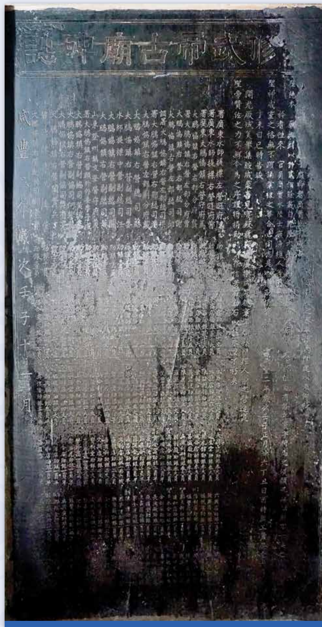
重修武帝古廟碑誌 咸豐二年（1852）

本篇碑文詳細記錄了咸豐二年（1852）廟宇重修的經歷。碑文題名「重修武帝古廟碑誌」，可知關帝古廟在當時或稱武帝古廟，武帝廟曾於乾隆六年（1741）重修，而這次咸豐二年的重修歷經六個月。碑文詳細記錄了為重修捐款的善信名單，名單亦反映了是時武帝廟附近的水師、駐軍、商鋪的名稱。碑文末尾公示了這次修廟的收支情況。