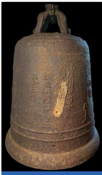
圖1 元朗屏山鯉魚山天后宮 康熙二十三年（1684）銅鐘