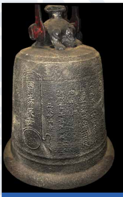
圖2 大埔舊墟天后宮后 康熙三十年（1691）銅鐘