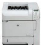
HP LaserJet P4014dn Drucker