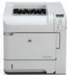
HP LaserJet P4014

Ideal für Arbeitsgruppen mit 5 bis 10 Benutzern in kleinen und mittelständischen Unternehmen, die hohe Druckvolumen in professioneller Qualität erstellen müssen.