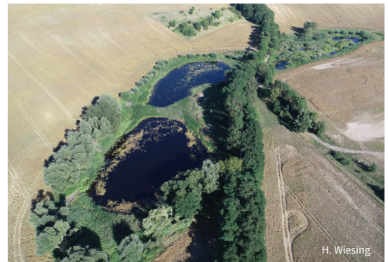
Einige der im Stiftungseigentum liegenden Feldsölle wurden 2017 als Amphibienrefugien wiederbelebt.

Die kleinen Feldsölle inmitten der Landwirtschaftsflächen bieten Lebensraum für die gefährdete Rotbauchunke und andere Arten kleiner Gewässer. Allerdings sind viele der Kleingewässer zugewachsen und zum Teil verlandet. Im Herbst 2017 baggerte die NABU-Stiftung daher vier in ihrem Eigentum liegende Sölle aus und verwandelte sie wieder zu wertvollen Amphibienrefugien.