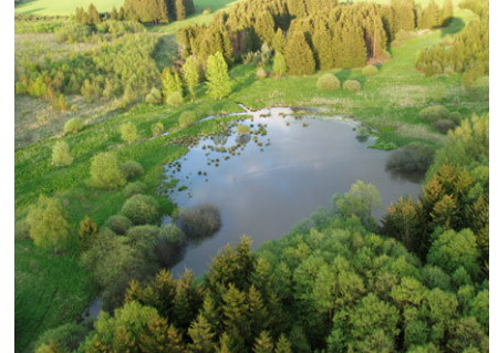
Das Naturschutzgebiet „Pfarrwiese“ im Grünen Band Sachsen.

Die NABU-Stiftung Nationales Naturerbe begann im Jahr 2001 damit, in Zusammenarbeit mit dem NABU Regionalverband Elstertal Flächen im Grünen Band Sachsen aufzukaufen, um den Erhalt dieser wertvollen Kette an Lebensräumen von Eigentümerseite her abzusichern. Die ersten Flächen konnten im Januar 2001 dank einer von der Volkswagen AG initiierten karitativen Autoversteigerung erworben werden. Im Februar 2004 gelangte mit dem Erwerb von 10,16 Hektar über die Hälfte des im Grünen Band Sachsen gelegenen Naturschutzgebiets „Hasenreuth“ in den gemeinsamen Besitz von NABU-Stiftung und NABU Elstertal. Durch weitere Flächenkäufe aus privater Hand im Juni 2004 und Juli 2007 konnte der Flächenbesitz der NABU-Stiftung auf 15,4 Hektar ausgeweitet werden. Gemeinsam mit den Flächen des NABU Elstertal sind damit nun über 35 Hektar in NABU-Besitz.