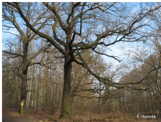
Alte Huteeichen zeugen von der Waldweide vergangener Jahrhunderte.

Zur Ergänzung ihrer Flächen bemüht sich die NABU-Stiftung um den Erwerb des Kindelsees, der ebenfalls dem Prozessschutz unterstellt werden soll.