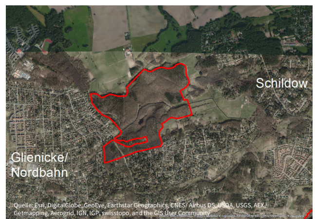
Das Naturschutzgebiet „Kindelsee-Springluch“

Das Naturschutzgebiet gehört zu den Gemeinden Glienicke/Nordbahn und Schönfließ am nördlichen Rand von Berlin.