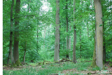
Mächtige Buchen und reiche Totholzvorräte prägen den Laubacher Wald.

Das Schutzgebiet der NABU-Stiftung Nationales Naturerbe umfasst 400,5 Hektar Wald, für den sie 2020 und 2023 mithilfe des Wildnisfonds die Nutzungsrechte dauerhaft erwarb. Das Gebiet liegt zentral in einem größeren Waldgebiet und ist frei von technischen Infrastrukturen und öffentlichen Verkehrswegen. Der NABU-Wald grenzt direkt an zwei Kernflächen im Staatswald in einem Umfang von rund 800 Hektar an, die bereits vollständig aus der forstlichen Nutzung entlassen wurden und sich gegenwärtig in der Ausweisung als Naturschutzgebiet befinden. Durch die Einstellung der forstlichen Nutzung auf den NABU-Flächen schafft die NABU-Stiftung eine mehr als 1.200 Hektar große zusammenhängende Waldfläche, in der die freie Naturdynamik zugelassen ist. Der Laubacher Wald wird so zu einer der seltenen, über tausend Hektar großen Wildnisflächen, die Deutschland besitzt.