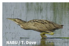
NABU / T. Dove