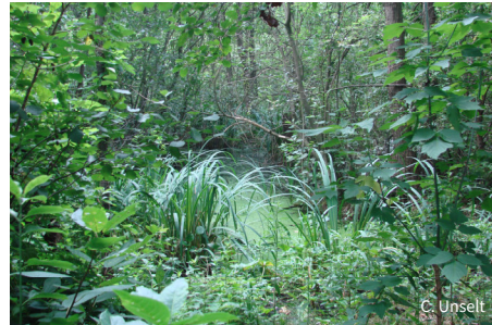
Der Großteil der Stiftungsflächen bei Beeskow darf sich ohne weitere menschlichen Eingriffe entwickeln.

Das betrifft zum einen Röhrichtgesellschaften, die sich im Gebiet sehr gut entwickeln. Auch die stiftungseigenen Laubmischwälder und feuchten Ufersäume werden nicht mehr forstwirtschaftlich genutzt und sind sich selbst überlassen. Im Laufe der Zeit können sich so altersgemischte, artenreiche Naturwälder mit hohem Alt- und Totholzanteil aufbauen.