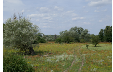
Langfristig könnte sich auch der Wiedehopf auf den Taufwiesenbergen wieder ansiedeln.

Durch Mahd oder Beweidung können die wald- und buschfreien Bereiche langfristig offen gehalten werden. Mit dem Entzug von Biomasse bleibt der nährstoffarme Charakter der Flächen erhalten. Aus diesem Grund hat die NABU-Stiftung ihre Flächen an einen Schäfer verpachtet.