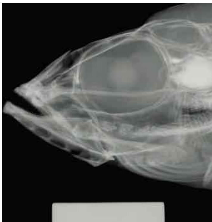
Diese Röntgenaufnahme des Kopfes (Männchen Reg.-Nr. LFC9) zeigt die winzigen spitzen Zähne und den leicht vorstehenden Unterkiefer, in dem die großen Öffnungen des sensorischen Systems des Kopfbereiches auffallen (Balken = 1 cm).

Der Fang erfolgte während eines Zeitraums von Februar 1994 bis August 1995. Dafür benutzten die Autoren Stellnetze von 8 bis 16 Millimetern Maschenweite. Die Tiere wurden ausschließlich nachts in einem Tiefenbe-