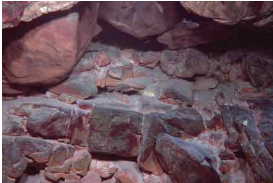
Nördlich von Kigoma lebt in dieser Höhle aus zerklüftetem Gestein Trematocara zebra .

fen sichtbar, und oberhalb der Brustflossen waren die senkrechten Streifen kürzer. An zwei Tieren wurde der Magen-Darm-Inhalt untersucht; er bestand aus Resten von Garnelen, Phytoplankton und Sand. DE VOS et al. deuteten Schwebelagen und Sand als möglicherweise unbeabsichtigt aufgenommene Begleitstoffe beim Fressen der Garnelen. Eines der gefangenen Weibchen von etwa 60 Millimeter Standardlänge enthielt im Ovar 41 Eier mit einem Durchmesser von 1,5 Millimetern.