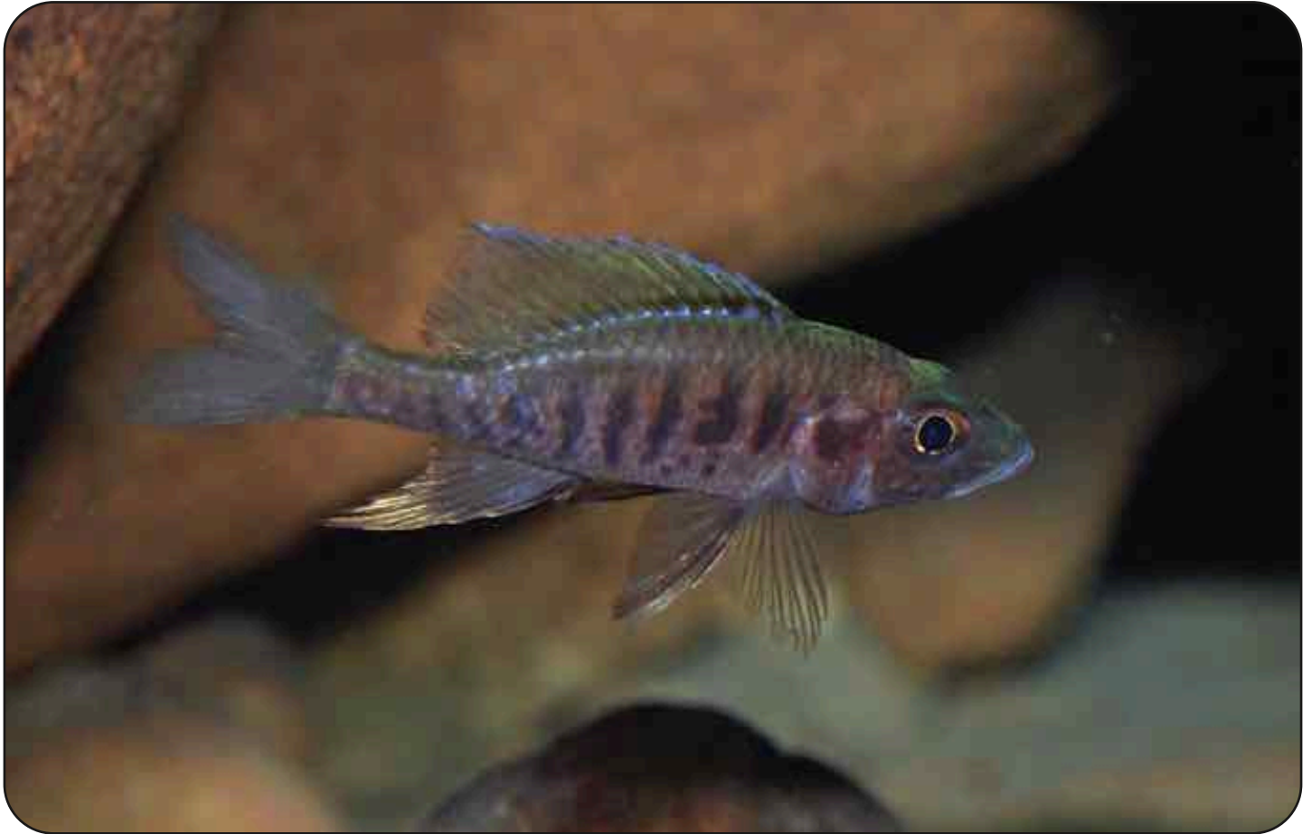
Männchen von Trematocara zebra . Dieses Tier wurde im Abstand von mehreren Tagen immer an der gleichen Stelle gefunden.

Die Gattung Trematocara umfasst derzeit neun Arten. Allen gemeinsam sind die vergleichsweise grossen Augen, ein Fehlen des unteren Zweigs der Seitenlinie und die auffälligen Vergrößerungen der unter den Augen liegenden (infraorbitalen) Poren des für Druckwellen empfindlichen Seitenlinienorgans (je nach Art zwischen drei und neun). Der Größbereich der Trematocara -Arten liegt zwischen sieben ( T. caparti ) und 15 Zentimetern Gesamtlänge ( T. unimaculatum ).