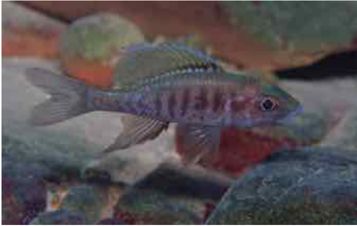
Dieses Männchen ist durch seine auffälligen Streifen individuell zu erkennen.