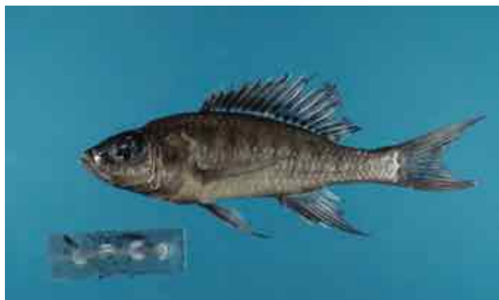
Konserviertes Männchen (Reg.-Nr. LFC9) der südlichen Population mit der typischen schwarzen Zone über dem gesamten körpernahen Bereich der Rückenflosse.