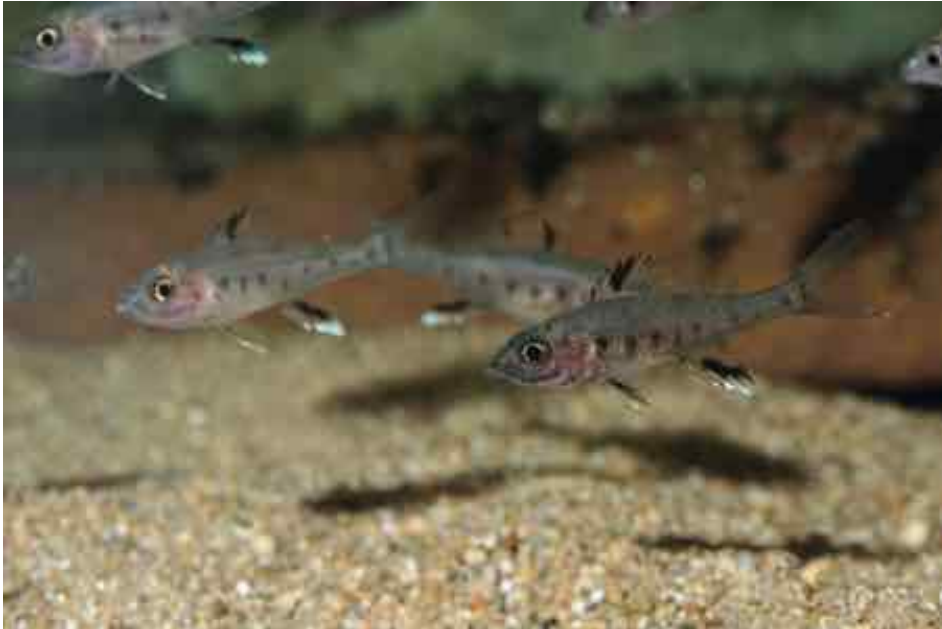
Jungtiere im Aquarium etwa vier Monate nach dem vermuteten Laichdatum.

Bei meiner Ankunft in der Schweiz, 52 Stunden nach dem Verpacken, betrug die Wassertemperatur 22 °C; der pH-Wert des Ausgangswassers war von 8,8 auf 8,1 gesunken. Während zwei Stunden wurde das Transportwasser langsam mit Aquarienwasser gemischt. Zur weiteren Kontrolle setzte ich die Jungen für 24 Stunden in ein 10-Liter-Aquarium mit eingefahrenem Aquarienwasser, anschließend kamen sie in ein 45-Liter-Aquarium (50 x 30 x 30 Zentimeter). Die relevanten Messwerte des Aquarienwassers lagen bei 14 °KH, pH-Wert 8,4, Temperatur etwa 24 °C.