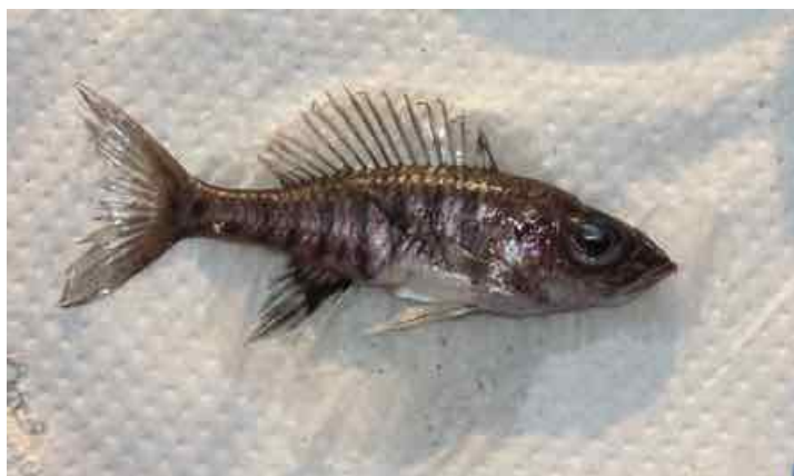
Frischtotes Weibchen der südlichen Population (Reg.-Nr. LFF2) kurz nach dem Fang. Im Unterschied zum Typusfundort fehlt diesem Weibchen der horizontale schwarze Streifen auf dem Körper im Bereich der Brustflossen.

Frisch gefangene Tiere des Typusmaterials zeigten geschlechtsspezifische Unterschiede im Farbmuster. Im wesentlichen besaßen die Männchen auf bräunlichem Körper mit purpurrotem metallischem Glanz bis zu zehn vertikale dunkle Bänder oder Flecke. In der hell-