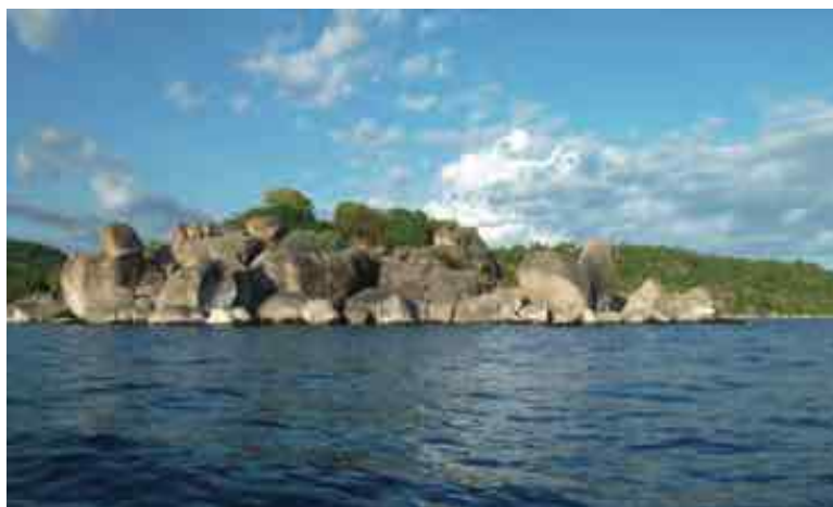
Diese mächtigen Felsbrocken setzen sich unter Wasser fort und bilden in entsprechender Tiefe lichtarme Höhlen.

Da nach verschiedenen Beobachtungen die Maulbrutpflege von Trematocara -Arten bei etwa 18 bis 21 Tagen liegt (Michael Näf, pers. Mitteilung; Krüter 1991), vermute ich als Laichzeit die letzte Juliwoche. Um die etwa zehn Millimeter großen Larven durch weitere Manipulationen nicht zu gefährden, wurden sie ohne genaue Messungen bis zur Rückreise während vier Wochen in einem Eimer an Bord unseres Bootes gehalten.