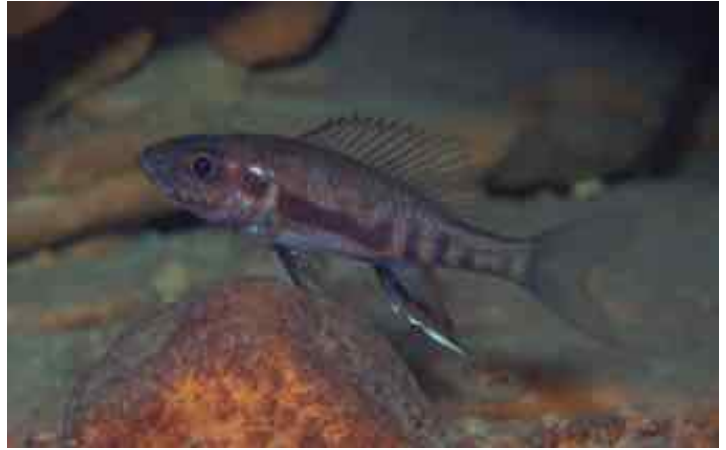
Ein Weibchen der Kigoma-Population mit dem charakteristischen Längsband auf der Körperseite entlang der Brustflosse.

und zwei juvenile Männchen. Das auffallend unterschiedliche Geschlechterverhältnis steht in bemerkenswertem Gegensatz zu den 15 Männchen und acht Weibchen des Typusmaterials. Vielleicht ist dieser Unterschied zwischen den beiden Fangorten zufällig. Andererseits ist denkbar, dass der nächtliche Fang des Typusmaterials über einen längeren Zeitraum und unsere Aufsammlung an einem einzigen Vormittag auf einer tageszeitlich unterschiedlichen Lebensweise beider Geschlechter beruht.