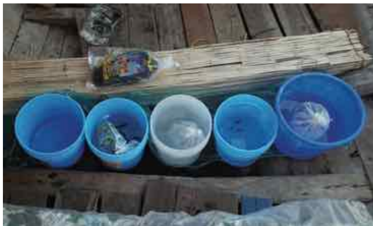
Die „Aquarienanlage“ an Bord unseres Bootes. Im linken Eimer schwimmen die winzigen Trematocara zebra .

maulbrütendes Tier, das an Bord etwa 40 Larven entließ. Die meisten davon überlebten Fang und rasches Auftauchen ohne ersichtliche Schädigung. Die Larven befanden sich mit dem noch sichtbaren Dottersack im letzten Stadium ihrer Entwicklung; einige von ihnen schnappten bereits am nächsten Tag nach frisch geschlüpften Artemia -Nauplien.