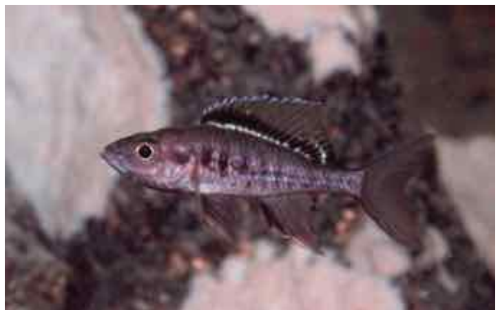
...und hier die linke des gleichen Tieres, die leicht unterschiedlich gezeichnet sind.