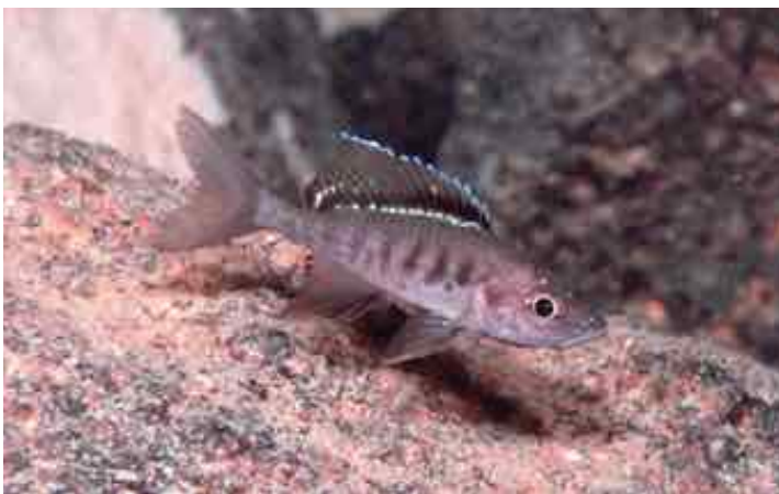
Trematocara zebra der südlichen Population, hier die rechte Körperseite ...

Die Tatsache, dass wir unsere Beobachtungen sowohl vormittags (Kigoma-Gebiet) als auch vor- und nachmittags (Utinta-Gebiet) machten, zeigt, dass die Tiere sich zumindest tagsüber im gleichen Lebensraum aufhalten. Nächtliche Wanderungen bis in Flachwasserbereiche macht T. zebra offensichtlich nicht. Eine „Tiefentreue“ lässt sich (mit Einschränkungen) auch aus den Untersuchungen vom Typusfundort herleiten, wo DE VOS et al. (1996) bei ihren Tauchgängen tagsüber keine Tiere antrafen. Abgesehen von der Erwähnung eines felsigen Bodengrundes machen die Autoren aber keine weiteren Angaben zur eigentlichen Struktur des Habitats. Sie diskutieren lediglich ein nächtliches Aufsteigen aus noch größerer Tiefe.