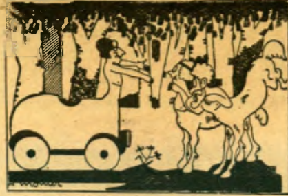
EL RETORN DEL CENTAURE PRODIG — Encara aneu així? No teniu cap idea del que la moda ha pogut canviar.

Cada dia concerts al recinte de l'Exposició per bandes civils i militars