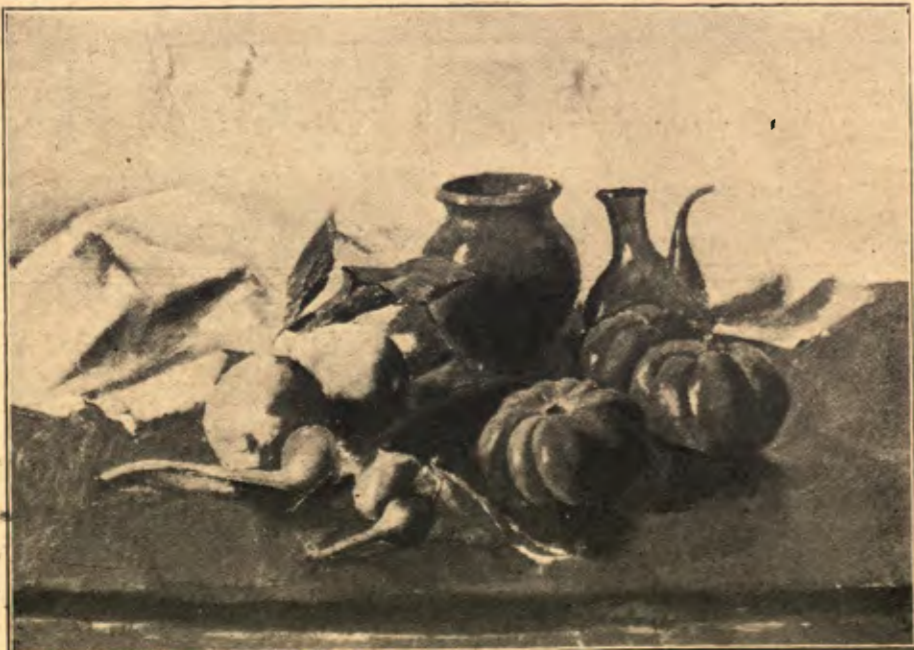
ALFRED SISQUELLA. — Natura morta .

Aquest pintor és un dels més inquiets que tenim. No es tracta aquí d'aquella INQUIETUD amb majúscules completament