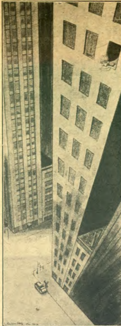
EL FESTEIG A NOVA YORK

litats sòrdides, amb un punt de corrupció lluminosa i un sensualisme gairebé mòrbid de la matèria associat amb un misticisme esotèric.