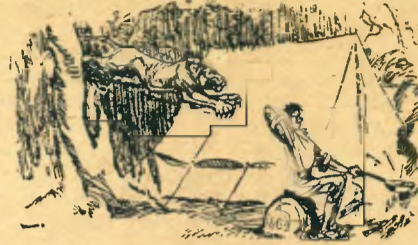
— Si tingués algú per gratar-me l'esquena...