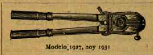
Modelo 1927, hoy 1931

Se mandan inmediatamente por ferrocarril a reembolso por