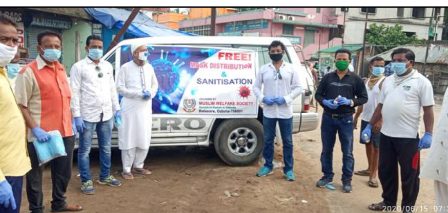
ଉପରେ ଗୁରୁତ୍ୱ ଦେବାକୁ ସେମାନେ ସମସ୍ତଙ୍କୁ କହିଥିଲେ । ସମସ୍ତଙ୍କୁ ମାସ୍କ ବଣ୍ଟନ କରିବା ସହିତ ସାମ୍ପ୍ରତିକ କରୋନା ସଂକ୍ରମଣ ସମୟରେ ସ୍ୱଚ୍ଛତା, ସାମାଜିକ ଦୂରତା ରକ୍ଷା, ସରକାରଙ୍କ ସର୍ବ ଡାଉନ୍ ଓ ଲକ୍

ଭୁବନେଶ୍ୱର, ୧୬/୬ (ନି.ପ୍ର): ଆସନ୍ତା ୧୯ ତାରିଖ ବେଳକୁ ଉତ୍ତର ବଙ୍ଗୋପସାଗରରେ ପୁଣି ଏକ ଲଘୁଚାପ ସୃଷ୍ଟି ହେବାର ସମ୍ଭାବନା ରହିଛି । ସେ ପର୍ଯ୍ୟନ୍ତ ରାଜ୍ୟରେ ବର୍ଷା ଲାଗି ରହିବ ବୋଲି ଭୁବନେଶ୍ୱରସ୍ଥିତ ଆଂଚଳିକ ପାଣିପାଗ ବିଜ୍ଞାନ କେନ୍ଦ୍ର ପୂର୍ବାନୁମାନ କରିଛି । ସେହିପରି ଉତ୍ତର ଆନ୍ଧ୍ୟାଳୟ ଓ ଓଡ଼ିଶା ଓ ଚନ୍ଦ୍ରପାଳ ସଂଚଳ ଉପରେ ଥିବା ପୂର୍ବବଲୟ ଏବେ ପୂର୍ବ ମଧ୍ୟପ୍ରଦେଶ ଓ ଏହାର ପାର୍ଶ୍ୱବର୍ତ୍ତୀ ଅଂଚଳ ଉପରେ ରହିବା ସହ ଦକ୍ଷିଣ ପୂର୍ବ ଉତ୍ତରପ୍ରଦେଶ ଏବଂ ପାର୍ଶ୍ୱବର୍ତ୍ତୀ ଅଂଚଳ ପର୍ଯ୍ୟନ୍ତ ସମୁଦ୍ର ପତନ ୦.୬ ଓ ୧.୬ କିଲୋମିଟର ଉଚ୍ଚତାରେ ଦକ୍ଷିଣ-ପଶ୍ଚିମ ଦିଗକୁ ବିସ୍ତୃତ ହୋଇଛି । ଅନ୍ୟପକ୍ଷରେ ଆସନ୍ତା ୨୪ ଘଂଟା ମଧ୍ୟରେ ରାଜ୍ୟର ଅଧିକାଂଶ ଜିଲ୍ଲାର ଅନେକ ସ୍ଥାନରେ ହାଲୁକାକୁ ମଧ୍ୟମ ବର୍ଷା କିମ୍ବା ବହୁପାତ ହେବାର ସମ୍ଭାବନା ରହିଛି । ନବରଙ୍ଗପୁର, କୋରାପୁଟ, ଜଗତସିଂହପୁର, ପୁରୀ, କଟକ, ମୟୂରଭଞ୍ଜ, କେନ୍ଦ୍ରାପଡ଼ା, ଯାଜପୁର ଏବଂ ବରଗଡ଼ ଜିଲ୍ଲାରେ ପ୍ରବଳ ବର୍ଷା ହେବାର ସମ୍ଭାବନା ରହିଥିବାରୁ ଏହି ସମସ୍ତ ଜିଲ୍ଲା ପାଇଁ ଯେଲୋ ପ୍ରାର୍ଥନା କରି କରୁଛନ୍ତି । ଏଥିସହ ୧୬ ତାରିଖ ଦିନ କୋରାପୁଟ, ନବରଙ୍ଗପୁର, ନୂଆପଡ଼ା, କଳାହାଣ୍ଡି, ବଲାଙ୍ଗୀର, ବରଗଡ଼, ସୋନପୁର, ସମ୍ବଲପୁର ଓ କେନ୍ଦ୍ରୀୟ ଆଦି ଜିଲ୍ଲାର କିଛି କିଛି ସ୍ଥାନରେ ପ୍ରବଳରୁ ଅତି ପ୍ରବଳ ବର୍ଷା ହେବ । ୧୭ ତାରିଖ ଦିନ କେନ୍ଦ୍ରୀୟ, ମୟୂରଭଞ୍ଜ, ବାଲେଶ୍ୱର, ଭଦ୍ରକ, ଯାଜପୁର, ଅନୁଗୁଳ, ଜେଜାନାଳ, ଦେବଗଡ଼, ସମ୍ବଲପୁର, ସୁନ୍ଦରଗଡ଼, ଝାରସୁଗୁଡ଼ା, ସୋନପୁର ଓ କଟକ ଆଦି ଜିଲ୍ଲାରେ ପ୍ରବଳ ବର୍ଷା ହେବ । ୧୮ ତାରିଖ ଦିନ କେନ୍ଦ୍ରୀୟ, ମୟୂରଭଞ୍ଜ, କେନ୍ଦ୍ରୀୟ, ଅନୁଗୁଳ, ଦେବଗଡ଼, ସମ୍ବଲପୁର, ଝାରସୁଗୁଡ଼ା, ସୁନ୍ଦରଗଡ଼, ବରଗଡ଼ ସୋନପୁର ଓ ଜେଜାନାଳ ଜିଲ୍ଲାରେ ପ୍ରବଳରୁ ଅତି ପ୍ରବଳ ବର୍ଷା ହେବାର ସମ୍ଭାବନା ରହିଥିବା ପୂର୍ବାନୁମାନ କରିଛି ପାଣିପାଗ ବିଭାଗ ।