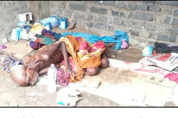
ପ୍ରକାଶ କରିଛନ୍ତି । ତାଙ୍କର ଘର ମୟୂରଭଞ୍ଜ ଜିଲ୍ଲାର ବୋଲି ବୃଦ୍ଧଙ୍କଠାରୁ ଜାଣିବା ପରେ କରୋନା ଭଳି ସ୍ଥିତିରେ ଘରକୁ ଚାଲିଯିବା ପାଇଁ ଲୋକମାନେ ତାଙ୍କୁ ପରାମର୍ଶ ଦେଇଥିଲେ । ମାତ୍ର ପୁଅ-ବୋହୂଙ୍କଠାରୁ ମାତ୍ର ଖାଇ ଘରଛାଡ଼ି ପଳାଇ ଆସିଥିବା ଜାଣିଗଲୁ ସେ ଆଉ ଘରକୁ ଫେରିବେ ନାହିଁ ବୋଲି ବୃଦ୍ଧ ଜଣକ ଲୋକମାନଙ୍କୁ କହିଥିଲେ । ତେବେ ଗତ ୧ମାସ ପୂର୍ବରୁ ତାଙ୍କର ସ୍ୱାସ୍ଥ୍ୟବସ୍ଥା ଖରାପ ହେବା ସହ ଅର୍ଦ୍ଧ ନିର୍ନିତ ଘରୁ ସେ ଆଉ

ବାଲେଶ୍ୱର, ୧୬/୬ (ନି.ପ୍ର): ବାଲେଶ୍ୱର ସହରର ଷ୍ଟେସନରୋଡ଼ରେ ଦୀର୍ଘ ୬ମାସଧରି ଅବହେଳିତ ଅବସ୍ଥାରେ ପଡ଼ି ରହିଥିବା ଜନିତ ଅଭିଭାବକଙ୍କ ଆଜି ମୃତ୍ୟୁ ହୋଇଯାଇଛି । ରାସ୍ତାରେ ଯାଉଥିବା ଲୋକ ଓ ସାଉଁଟରୀଙ୍କୁ ଆହୁରିବା ଭକ୍ତଙ୍କ ଦାନରେ ଖାଇପିଇ କୌଣସି ମତେ ପୌରପାଳିକାର ଅଧିକାରୀଙ୍କ ମାଧ୍ୟମରେ ଗୋଟିଏ ଘରେ ସେ ରହିଥିଲେ । ତେବେ ସମ୍ପୃକ୍ତ ବୃଦ୍ଧଙ୍କ ସମେତ ଏକାଧିକ ପାଖକ ପାରିଜି ବି ସେଠାରେ ଆସି ରହିବା ଦେଖି ସ୍ଥାନୀୟ ଲୋକେ ପ୍ରଶାସନର ଦୃଷ୍ଟି ଆକର୍ଷଣ କରିଥିଲେ । ତେବେ ମାର୍ଗମାଧ୍ୟମ ଶେଷ ସମ୍ଭାଷଣ କରୋନା ପାଇଁ ସର୍ବ ଡାଉନ୍ ହେବା ଉତ୍ତରେ ଅନ୍ୟ ପାଖକ ପାରିଜିମାନେ ସେଠାରୁ ଚାଲି ଯାଇଥିବା ବେଳେ ଏହି ବୃଦ୍ଧ ଜଣକ ସେଇ ଅଧିକାରୀଙ୍କ ଗୃହରେ ରହିଥିଲେ ବୋଲି ସ୍ଥାନୀୟ ଲୋକେ