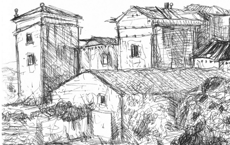
Figura 2: Palacio Jauregizar (Viguria) 20 .

armería rurales. Por ello, la casa levantada en la ciudad heredaba el escudo de la vieja fortaleza del campo, que continuaba siendo habitada por los caseros o 'claveros' que cuidaban también los privilegios que ésta poseía en el lugar. Nos encontramos así con las casonas de los Guenduláin, Ezpeleta, Rozalejo y Navarro-Tafalla en Pamplona o las de los San Cristóbal y los Eguía en Estella. Las edificaciones residenciales de los linajes de Veráiz, San Adrián e Ibáñez-Luna en Tudela y los palacios de Granada de Ega y Valle-Santoro en Sangüesa. O, por último, los de Sonsierra, Guenduláin y Feria en Tafalla y las casas-palacio de los Ezpeleta y los Rada en Olite entre otras muchas.