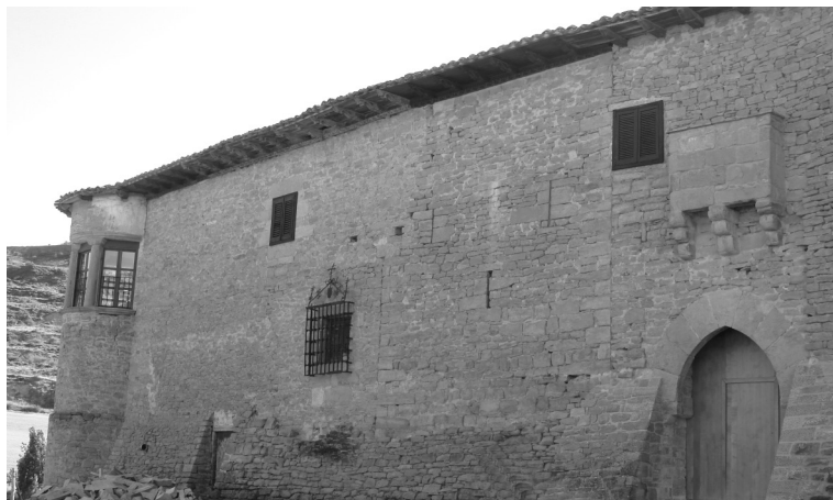
Figura 1: Casa palacio de Echarren de Guirguillano 10 .

de ellas con puerta adintelada, lo más común desde mitad del siglo XVI fue el arco de medio punto. Las casas se elevaban en tres alturas con ventanas adinteladas y balcones que lucían buenas obras de forja.