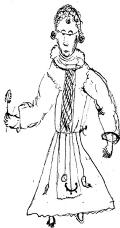
Figura 4: Dama navarra del Antiguo Régimen 92 .

vivido el difunto hasta su muerte. Entre las pertenencias del abad, Juan de Armendáriz, se mencionan una chaquetilla, un calzón de “pañó muy ordinario”, un jubón blanco de lienzo con mangas de tafetán nuevas, tres toallas, veinte paños de lienzo, dos paños de manos de terliz en un arca, que según el palaciano “son de una mujer del lugar de Unzué y los tenía en imperio o prenda de dos robos de trigo su tío” 91 .