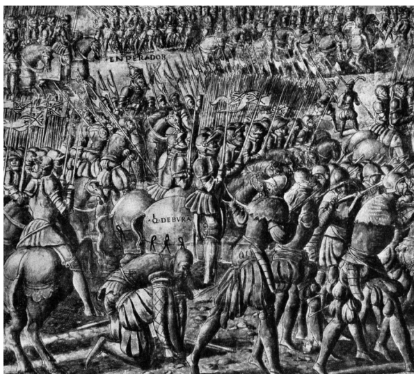
Figura 3: Sección de las grisallas del Palacio de Oriz 39 .

La grandeza de los interiores de los palacios venía vestida y adornada por tapices y colgaduras sustituidos desde comienzos del siglo XVII por cuadros. No obstante, en pleno siglo XVI el noble tudelano don Miguel de Eza, caballero de la Orden de Alcántara, decoró su casa con diferentes pinturas. Concretamente fueron “diez lienzos de Flandes guarnecidos de madera de un tamaño, y otros dos con dos bultos de mujeres 40 ”. Agustín de Rojas en su obra El viaje entretenido de 1603 escribía: “veo las pobres salas de mi soledad acompañadas y adornadas con la más rica tapicería del mundo 41 ”. El lujo llegó a ser un problema que supuso la aprobación de duras pragmáticas contra las colgaduras de brocado, telas de oro y plata, así como los bordados. Según Sempere y Guarinos, sólo se permitían las telas de terciopelo, damascos, rasos, tafetanes y seda prohibiéndose traer tapices de fuera con oro y plata 42 . En las descripciones del viaje a España entre 1576 y 1577 del rey Sebastián de Portugal siempre se