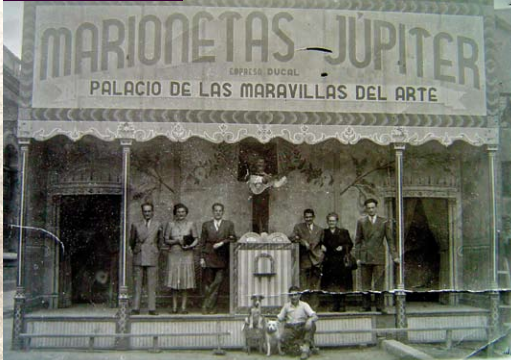
Instalaciones del Teatro Júpiter