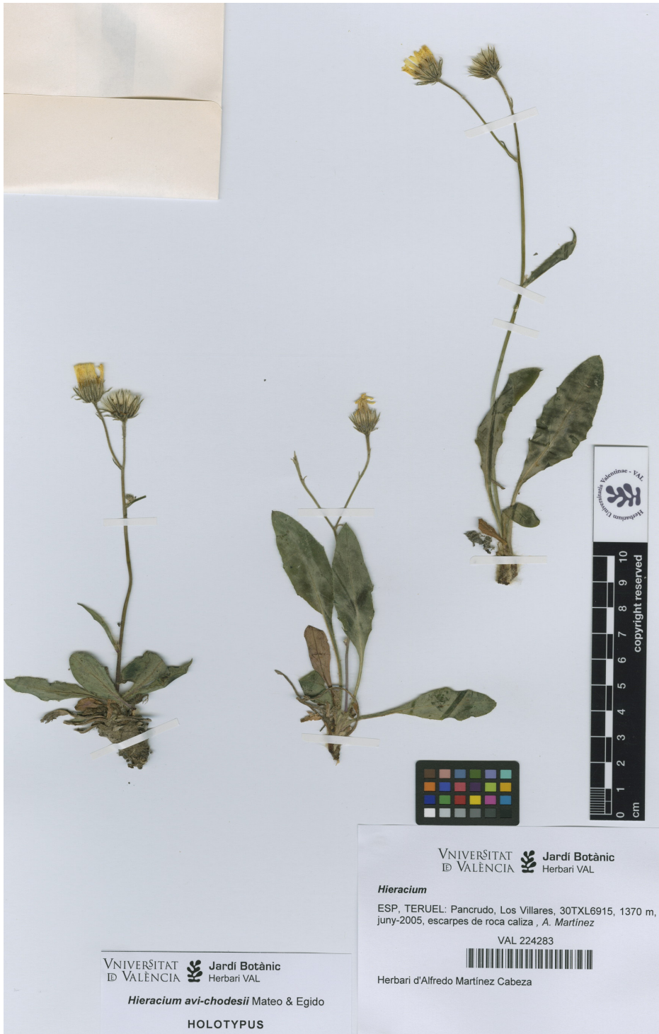
Fig. 2: Muestra tipo de Hieracium avi-chodesii , recolectado en Pancrudo (Teruel).