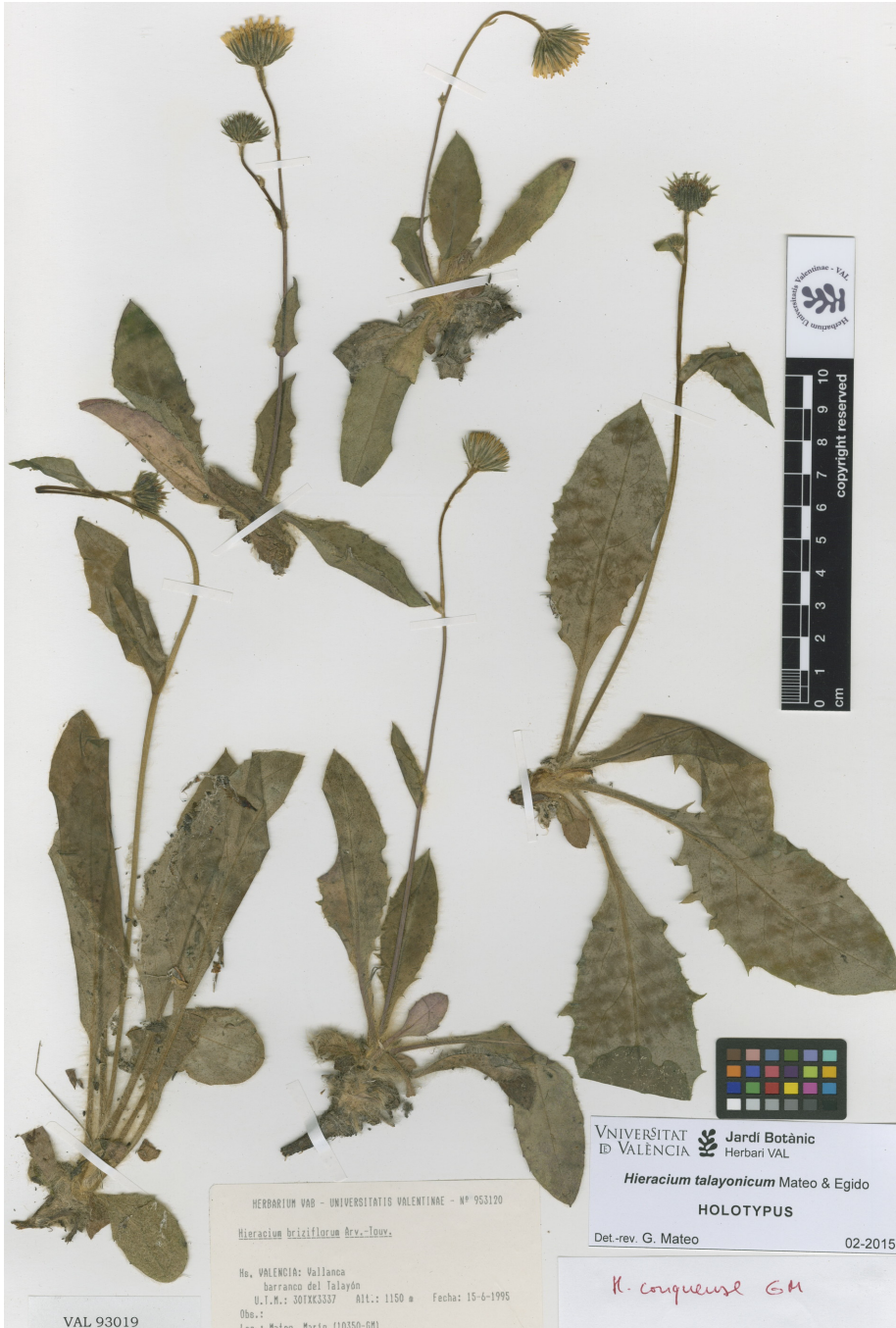
Fig. 3: Muestra tipo de Hieracium talayonicum , recolectado en Vallanca (Valencia).