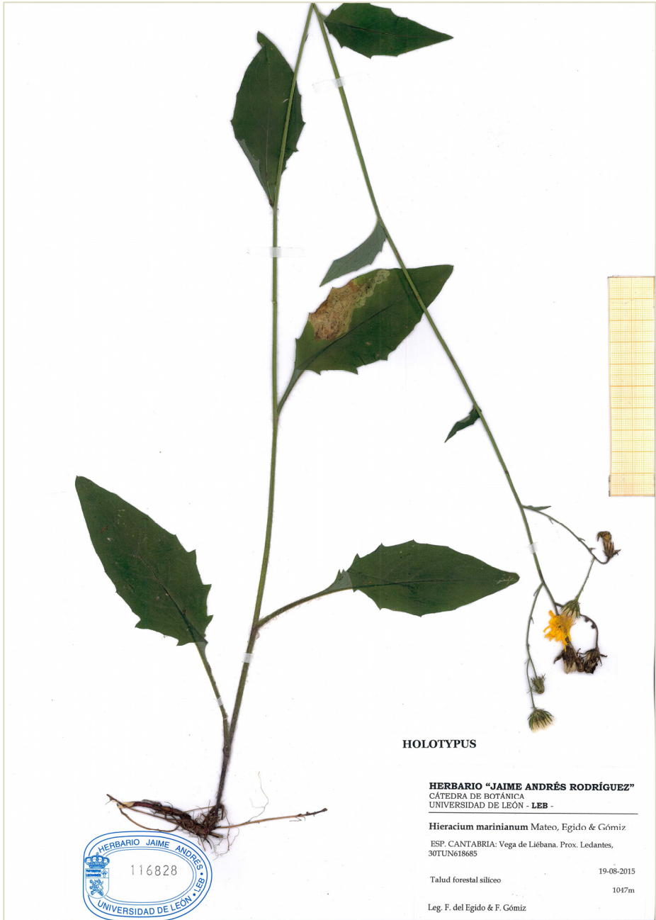
Fig. 7: Typus de Hieracium marinianum procedente de Ledantes (Cantabria).