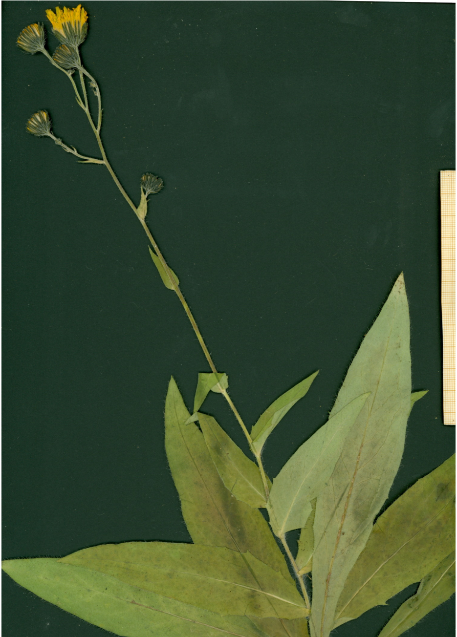
Fig. 5: Typus de Hieracium lancipalentinum procedente del Puerto de Piedrasluengas (Palencia).