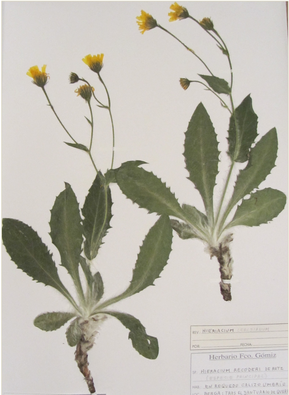
Fig. 10: Typus de H. protoconquense , procedente de Berga (Barcelona).