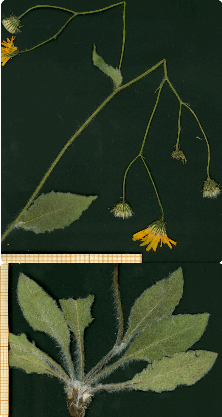
Fig. 3: Typus de Hieracium cercsianum , procedente de Cercs (Barcelona).