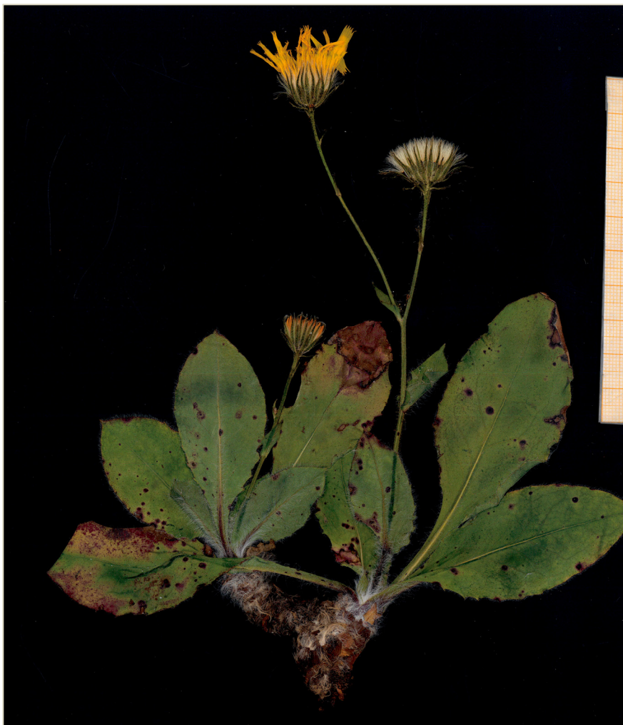
Fig. 1: Typus de Hieracium barrioluciense , procedente de Barriolucio (Burgos).

(Recibido el 19-II-2016) (Aceptado el -25-II-2016)