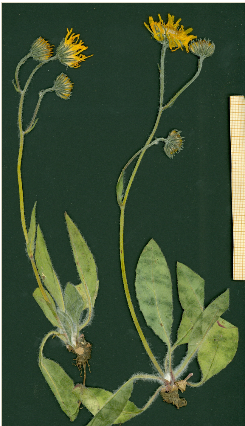
Fig. 2: Typus de Hieracium cabrillanense , procedente de Cabrillanes (León).