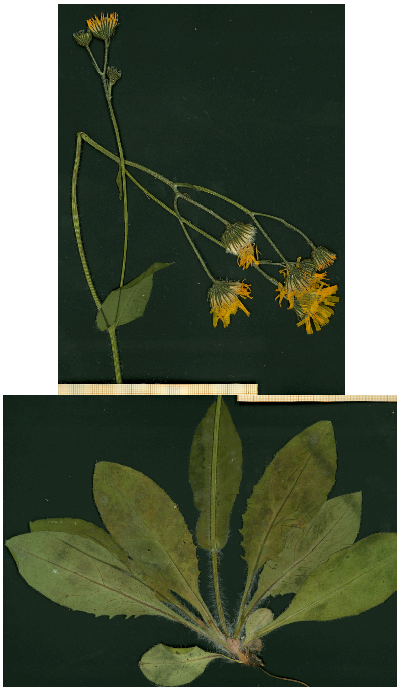
Fig. 6: Typus de Hieracium latequeralense , procedente de Berga (Barcelona).