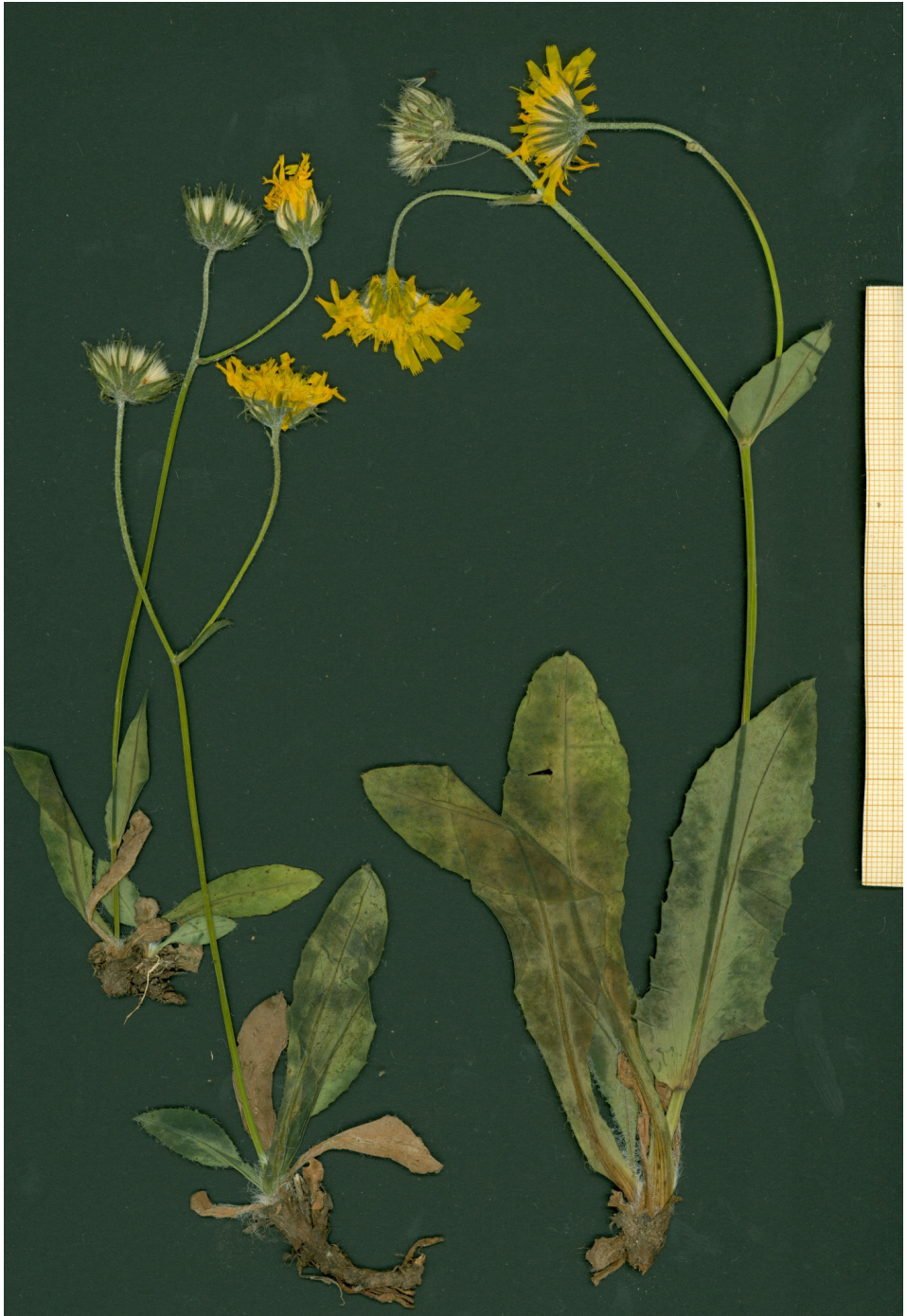
Fig. 11: Typus de Hieracium sahunianum , procedente de San Juan de Plan (Huesca).