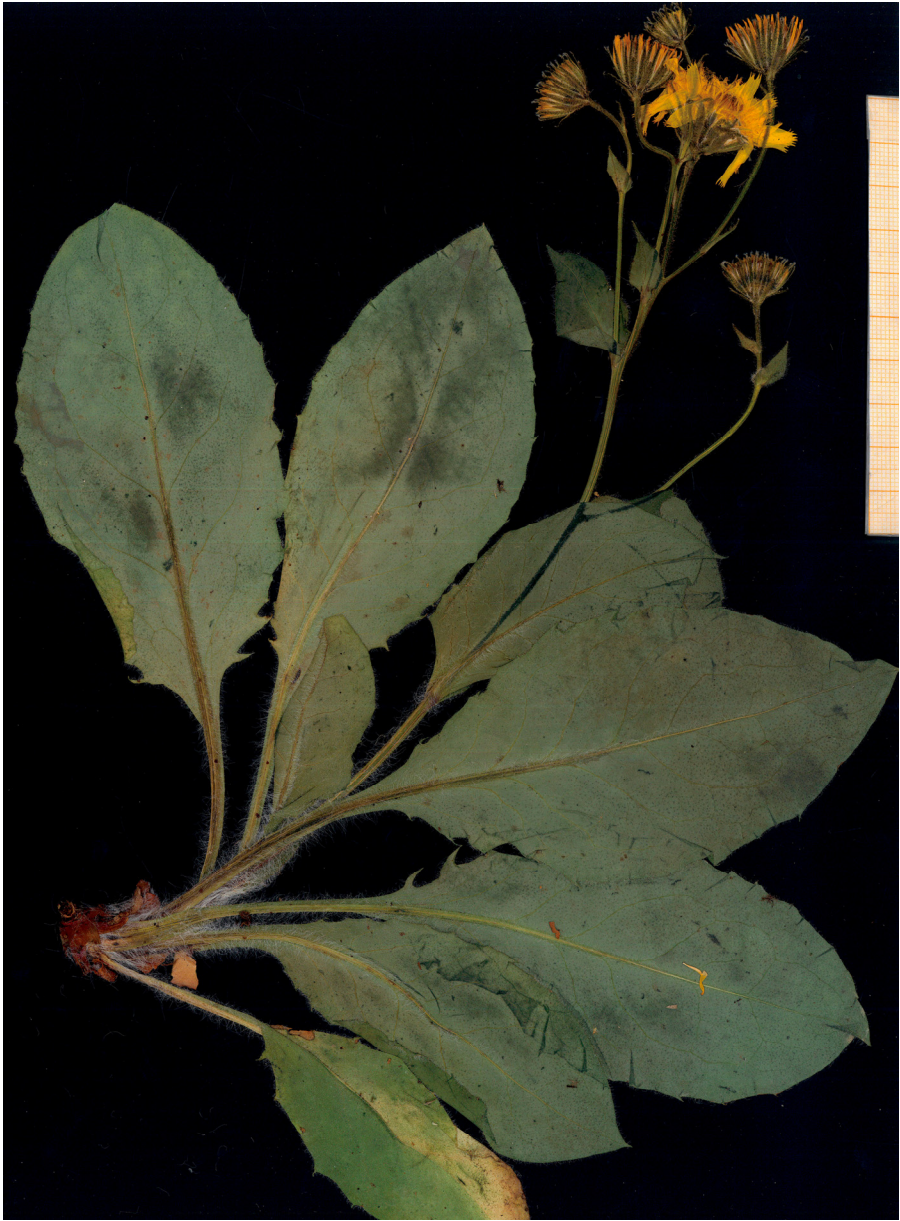
Fig. 9: Typus de Hieracium megaluciense , procedente de Barriolucio (Burgos).