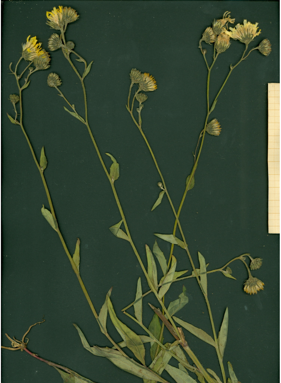
Fig. 13: Typus de Hieracium tercianum , procedente de San Martín de la Tercia (León).