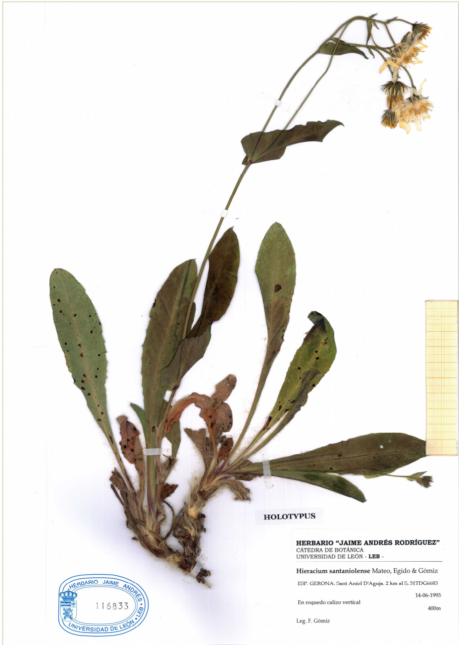
Fig. 12: Typus de Hieracium santaniolense procedente de Sant Aniol d'Aguja (Gerona)