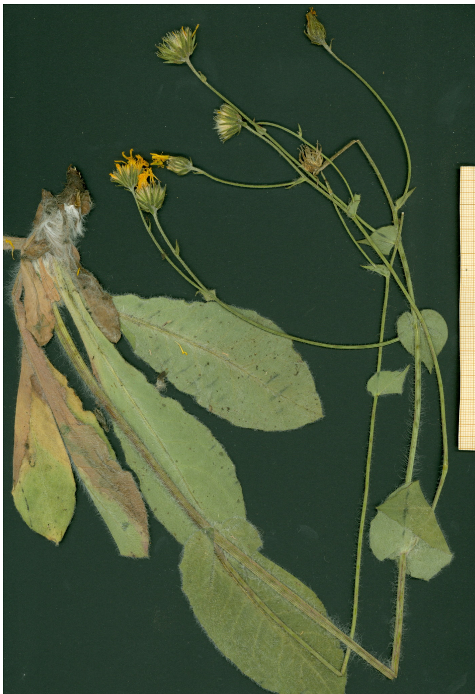
Fig. 8: Typus de Hieracium megabelsetanum , procedente de Bielsa (Huesca).