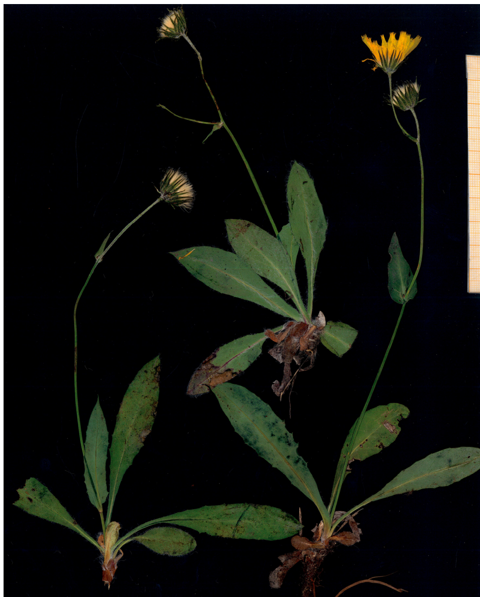
Fig. 4: Typus de Hieracium gymnocense procedente de Bielsa (Huesca).