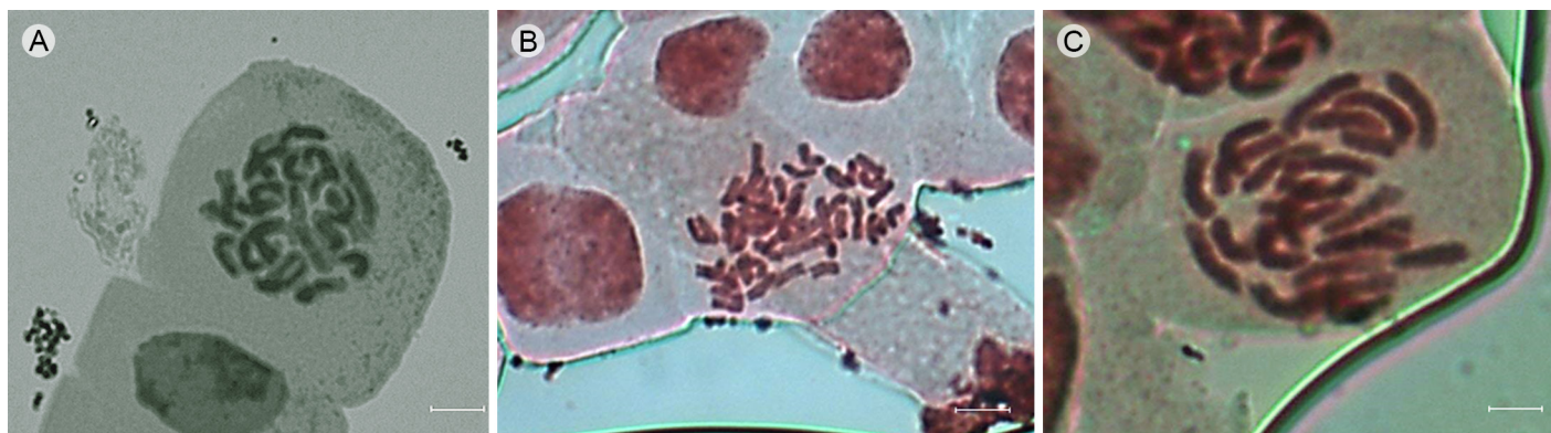
Figura 1: Cromosomas en metafase mitótica para tres especies de Cosmos Cav. sección Discopoda (DC.) Sherff. Escala=5 \mu m. A. Cosmos nitidus Paray (2n=2x=24); B. Cosmos pseudoperfoliatus Art. Castro, Harker & Aarón Rodr. (2n=4x=48); C. Cosmos ramirezianus Art. Castro, Harker & Aarón Rodr. (2n=2x=24).

la aneuploidía, poliploidía y los rearrreglos estructurales a nivel cromosómico han sido determinantes para la evolución de las especies sudamericanas y norteamericanas de los géneros Stevia Cav. y Solidago L., respectivamente. Así mismo, Malallah et al. (2001) encontraron en diferentes poblaciones de Picris babylonica Hand.-Mazz. una amplia serie cromosómica aneuploide que fue relacionada con una variación en el desarrollo de capítulos homocárpicos o heterocárpicos. La aneuploidía en Cosmos es un área de oportunidad en la investigación y su examen a fondo podría revelar procesos evolutivos importantes en el género.