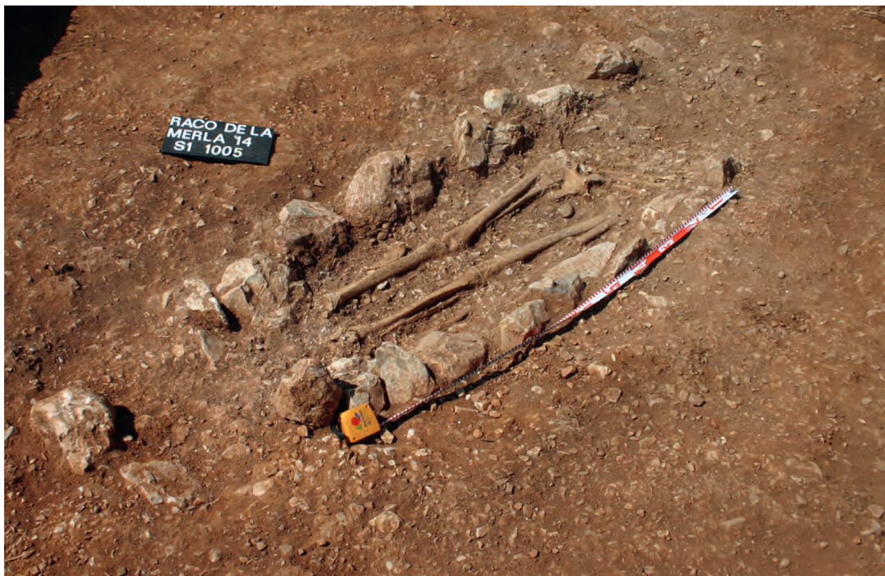
Figura 3. Inhumación del Racó de la Merla.

su pésima conservación o por tratarse de piezas de un tamaño inferior a tres centímetros.