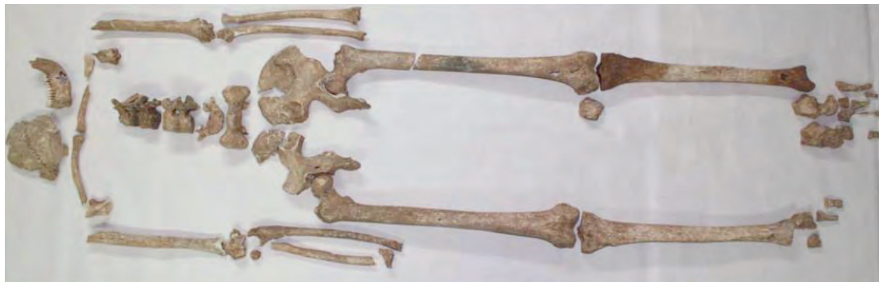
Figura 4. Restos Óseos de la inhumación.

Por lo que respecta a los restos craneales, en general su conservación esquelética es buena y son muy consistentes. Se han recuperado varios fragmentos que corresponden a parte del occipital y el parietal izquierdos, a los temporales, al frontal,