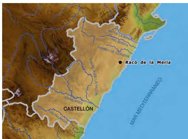
Figura 1. Localización geográfica de la necrópolis del Racó de la Merla.

perfiles suaves y redondeados. Al oeste se extiende la sierra de las Atalayas y al este la sierra de Irta. Las montañas que conforman la orografía de la primera alcanzan cotas superiores a los 600 metros sobre el nivel del mar como por ejemplo el cerro donde se localiza la ermita de San José conocido como "dels Frarets"; mientras que en la segun-