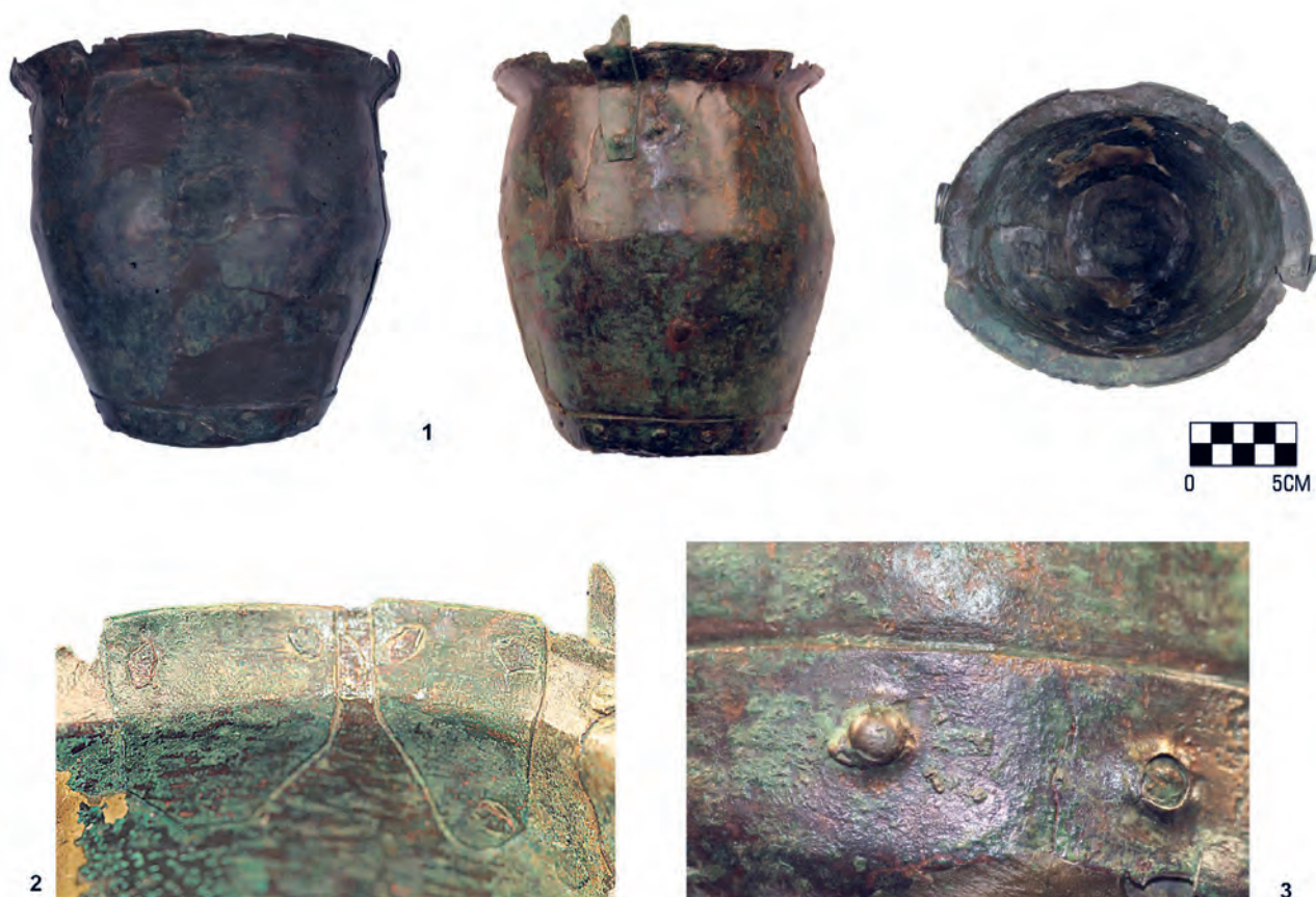
Figura 6. Ajuar de la inhumación. Situlae fabricada en bronce.

1995). Además, es ampliamente utilizada en la época imperial como ajuar funerario y se corresponde en la mayoría de los casos documentados con un enterramiento femenino.