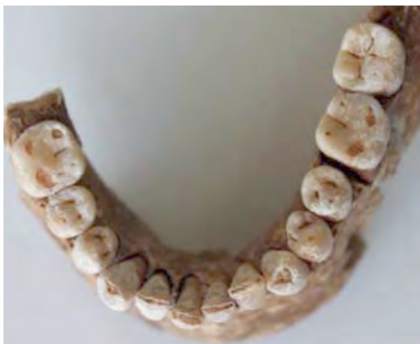
Figura 5. Vista superior de la mandíbula inferior.

que solamente conserva el arco supraciliar izquierdo, y la hemimandíbula izquierda, la única que se ha podido reconstruir. Los fragmentos localizados nos muestran un cráneo poco robusto donde las marcas de la cresta occipital y la línea temporal no son muy marcadas. Las suturas occipitales y parietales en la zona lambdaidea nos indican que los restos óseos pertenecen a un individuo de edad menor de cincuenta años.